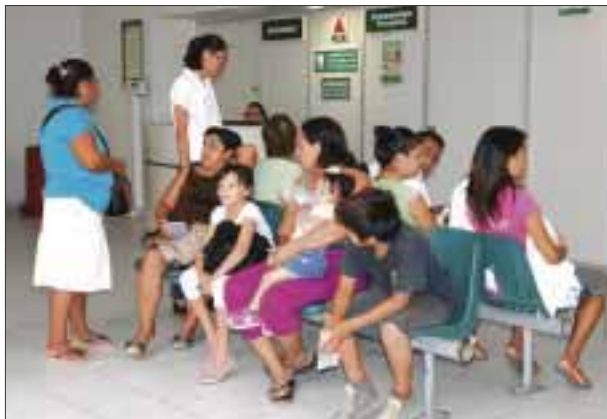
La tarea del personal consiste en atender a los pacientes que esperan consulta.