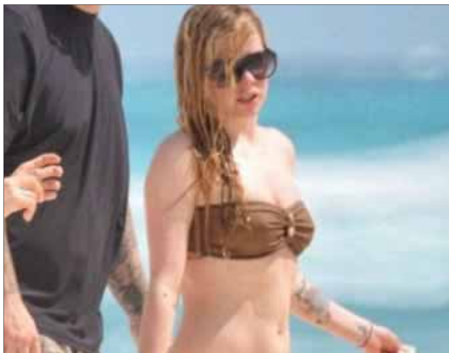
Avril Lavigne fue captada divirtiéndose en las cristalinas aguas del mar de Cancún.

discapacidades. Zignia Live y Avril Lavigne donarán 1.00 USD por boleto vendido de cada uno de los conciertos en México para apoyar dicha fundación.