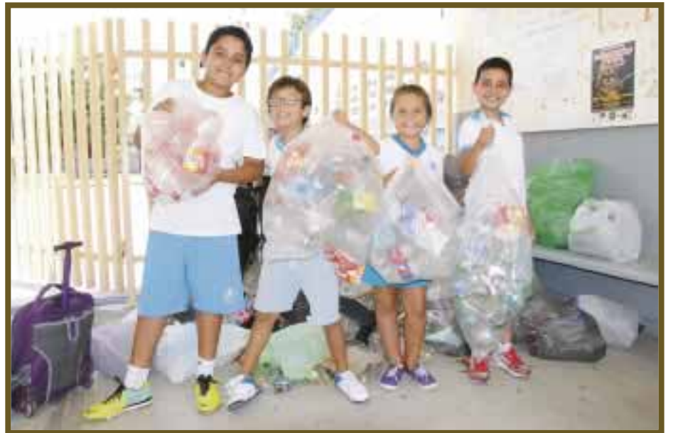
Pequeños ecologistas posan para DIARIO IMAGEN.

Con el proyecto se busca que los alumnos adquieran mayor conciencia, además de fomentar la tarea en equipo, la sana competencia y sobre todo el desarrollo de nuevas y creativas ideas para la obtención de dicho material. El planeta requiere de acciones inmediatas, por lo cual estas instituciones ya están dando inicio con la concientización para que sea de forma permanente.