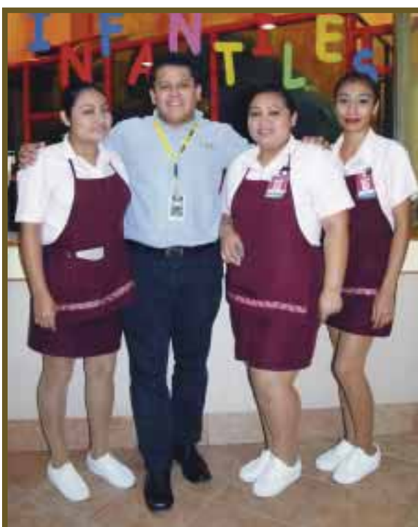
Personal de El Portón posa para DIARIOIMAGEN.