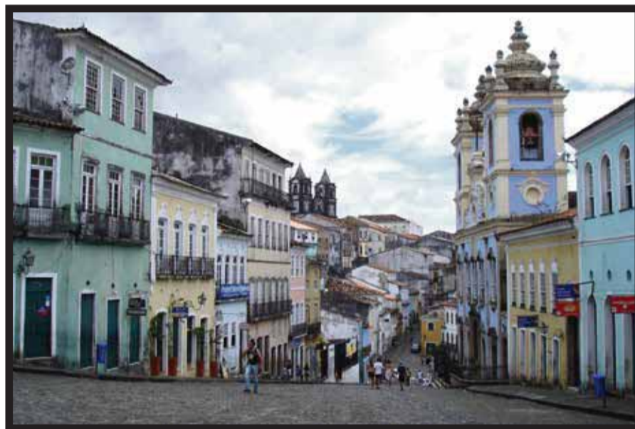
Salvador de Bahía, Brasil, sede del mundial de futbol.

☆☆☆☆☆ Interval International , proveedor mundial de servicios de vacaciones y un segmento operativo de Interval Leisure Group , anunció la afiliación de The Resort at Diamante , un complejo de propiedad compartida localizado dentro de Diamante Cabo San Lucas. La comunidad planificada de mil 500 acres (607 hectáreas) está situada en una franja espectacular de la costa del Pacífico, en la península mexicana de Baja California. "El componente de propiedad compartida de Diamante