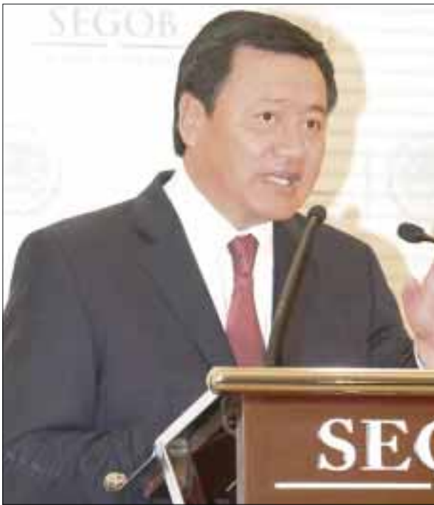
Miguel Ángel Osorio Chong , titular de la Secretaría de Gobernación, inauguró la Convención Nacional de Protección Civil 2014 en Acapulco, Guerrero.