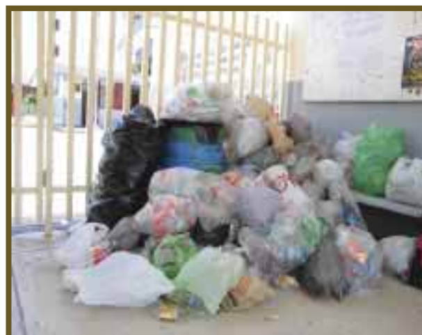
El pet llenó 2 camionetas.