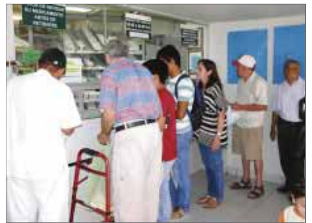
Los derechohabientes solicitan el servicio de las enfermeras.