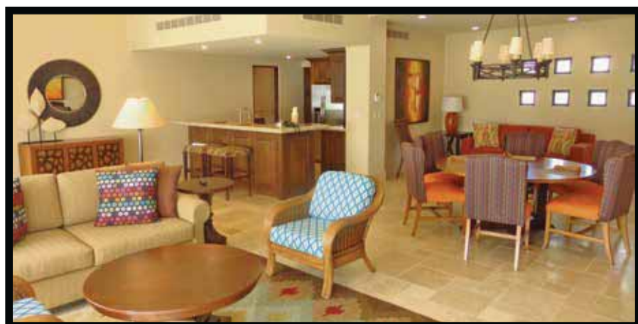
The Resort at Diamante.

hacen único. Estamos muy orgullosos de que será parte de nuestra red". Diamante Cabo San Lucas aloja a The Dunes , un campo de golf de 18 hoyos diseñado por Davis Love III , que ocupó el puesto número 52 en Los 100 mejores campos de golf del mundo en 2013 de Golf Magazine y el 55 en Los 100 mejores campos de golf del mundo de Golf Digest en 2014. El Cardonal, el primer campo de golf del mundo diseñado por Tiger Woods , se espera que abra este año. Se ha planeado un tercer campo dentro de la propiedad. Se espera que todos estén exclusivamente a disposición de los propietarios y los huéspedes del complejo turístico. Otro punto focal espectacular es la Crystal Lagoon , de más de 11 acres (cerca de 5 hectáreas), una prístina área de juego de agua salada para nadar, navegar a vela, hacer surf con remo y navegar en kayak . Creada con una tecnología patentada, tiene un consumo eficiente de energía y usa menos productos químicos que los sistemas tradicionales de piscinas. Cabañas, áreas de playa y senderos para trotar rodean la laguna. El complejo de uso mixto también contará con villas alrededor del campo golf de propiedad absoluta, un club de residencia privada y un hotel. Entre los servicios e instalaciones planeados que los propietarios y los huéspedes en The Resort at Diamante disfrutarán se encuentran un gran centro