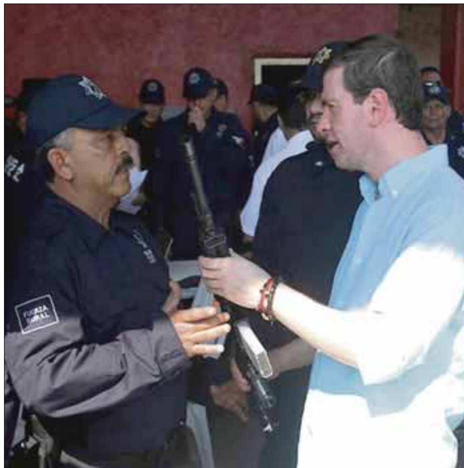
El comisionado federal para la Seguridad y el Desarrollo en Michoacán, Alfredo Castillo Cervantes, continúa sus reuniones con la Fuerza Rural.

Castillo añadió que esta semana se retirará a los grupos de autodefensas en otras dos alcaldías, que podrían ser Coalcomán, Apatzingán o Aguililla. Y confió en que el proceso de integración a la Fuerza Estatal Rural concluya de manera total en aproximadamente tres semanas