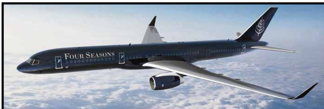
El nuevo servicio de la cadena hotelera.