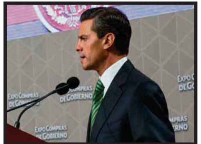
SEGÚN INEGI HUBO crecimiento industrial de 3.4%.

tentable a fin de generar bienestar y desarrollo en todo el país. Destacó que con esta exposición se fortalece el mercado interno y se crea una sinergia entre el mayor comprador del país, que es el gobierno, y las micro, pequeñas y medianas empresas (Mipymes), que... >15