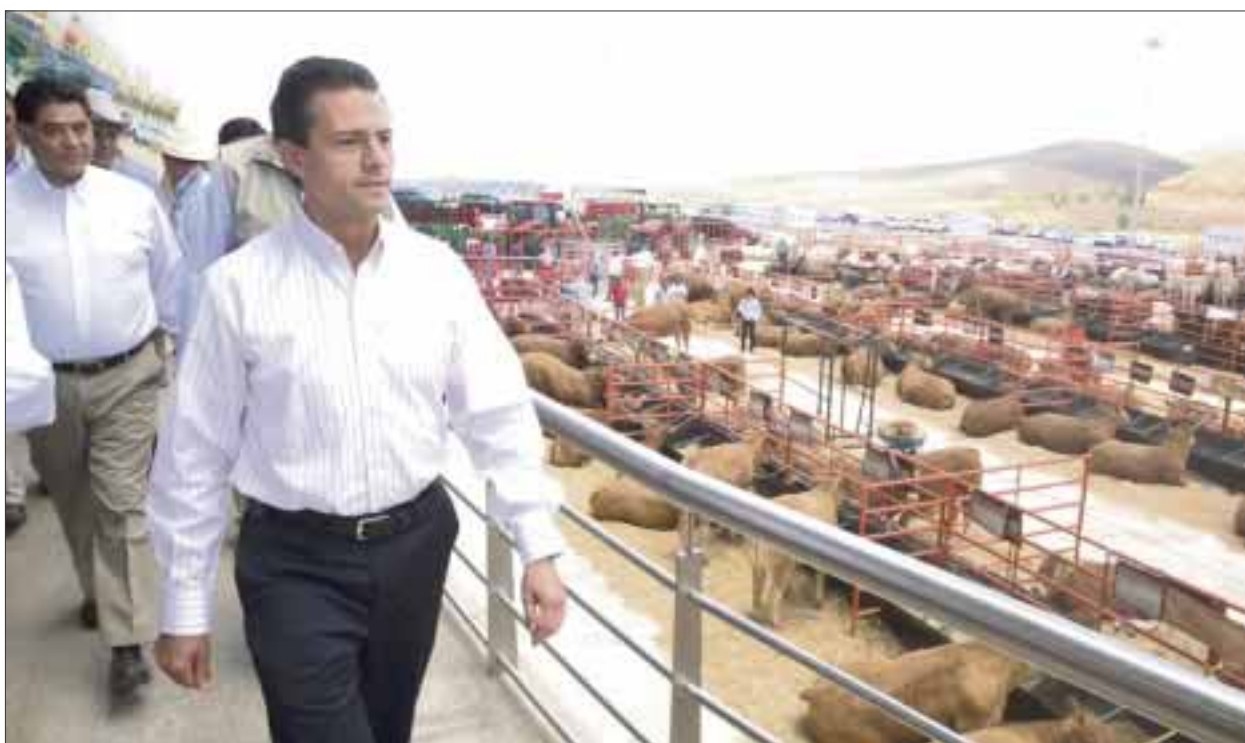
Zacatecas, Zac.- El presidente Enrique Peña Nieto inauguró la Asamblea Ordinaria de la Confederación Nacional de Organizaciones Ganaderas.

El Ejecutivo destacó que el país es el séptimo productor mundial de proteínas de origen animal. “Además, gracias a los elevados estándares de sanidad y calidad agroalimentaria de nuestro ganado, México es el segundo exportador mundial de bovinos en pie”