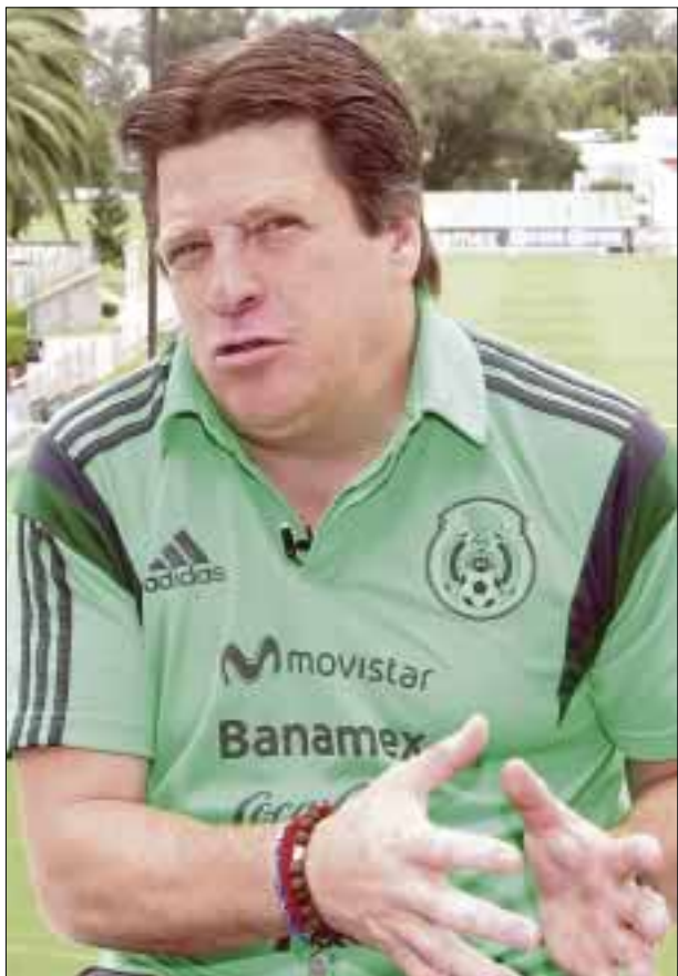
Miguel Herrera , director técnico de la selección mexicana de fútbol, dice que tiene ubicados a los jugadores rivales.