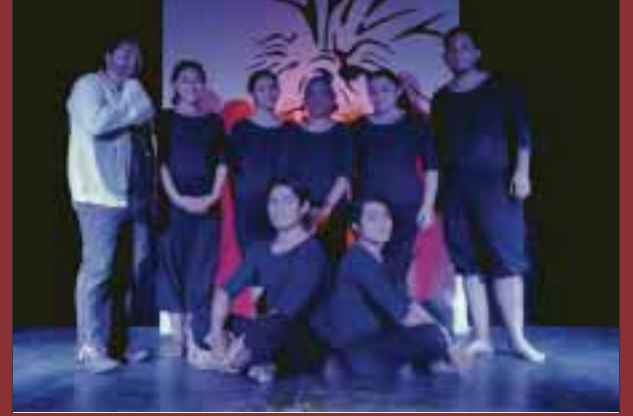
Actores posan para DIARIO IMAGEN.