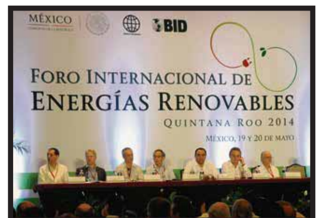
HABRÁ SERVICIOS PROFESIONALES de consultoría sobre eficiencia y diagnóstico.

lo que podrán brindar servicios profesionales enfocados a la consultoría sobre la eficiencia y diagnóstico energéticos. El funcionario hizo hincapié en que el gobierno del estado trabajó de manera coordinada con el Congreso local para... >2