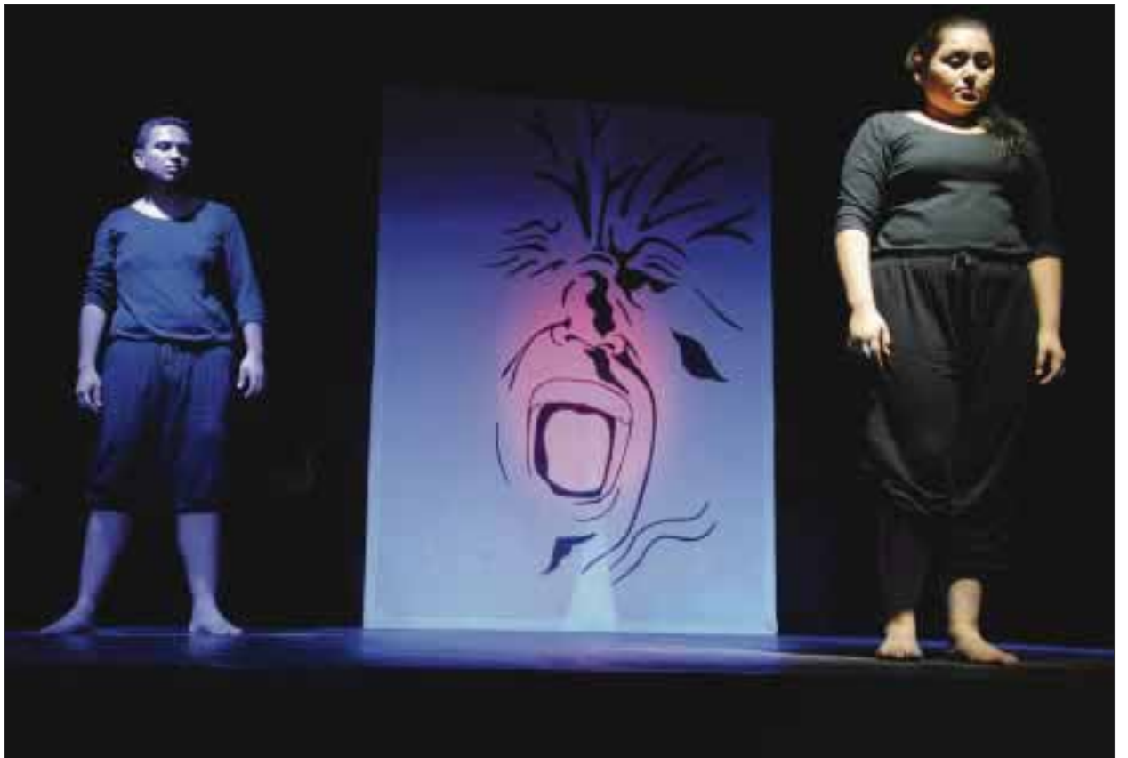
Las almas que son su conciencia y sus preguntas sin respuesta.