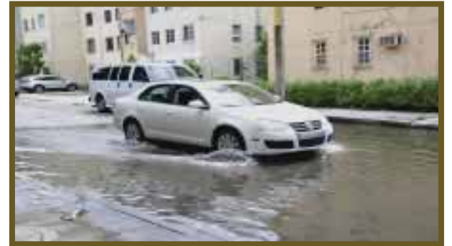
El agua provoca daños en los motores de los automotores