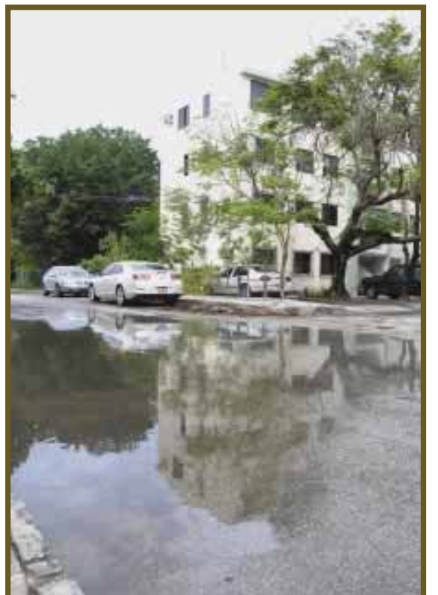
Zonas habitacionales registran grandes inundaciones.