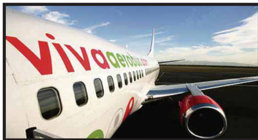
La línea aérea está imposibilitada para transportar órganos humanos en sus operaciones.