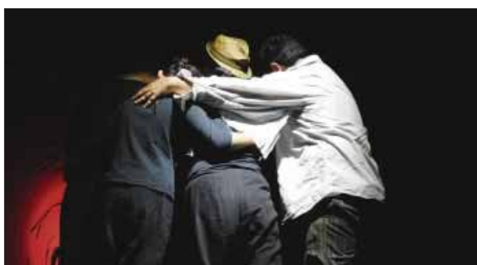
En un reencuentro con su interior, renace a su nueva vida.