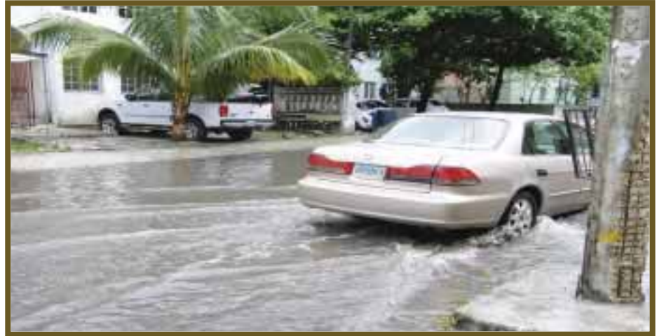
Zonas inundadas entorpecen el paso de automóviles.

Los sistemas pluviales registraron un atascamien- to por basura y desechos, lo cual es el principal fac- tor de inundaciones en las diversas áreas de la ciudad, registrando así un fuerte problema.