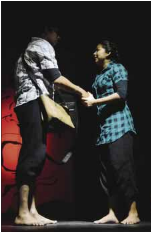
Los artistas ofrecen gran proyección.