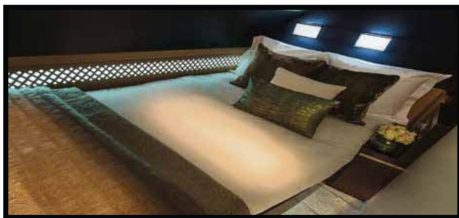
Primera clase de Ethad Airways .