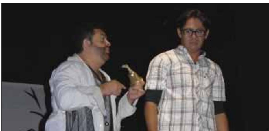
Escucha una voz que es la de su ángel consejero y consolador.