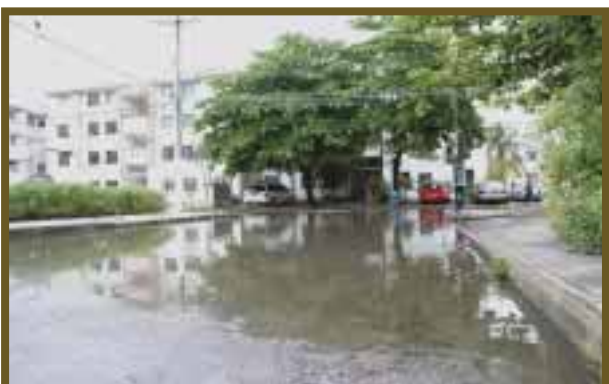
Cientos de calles carecen de buen sistema de desagüe.