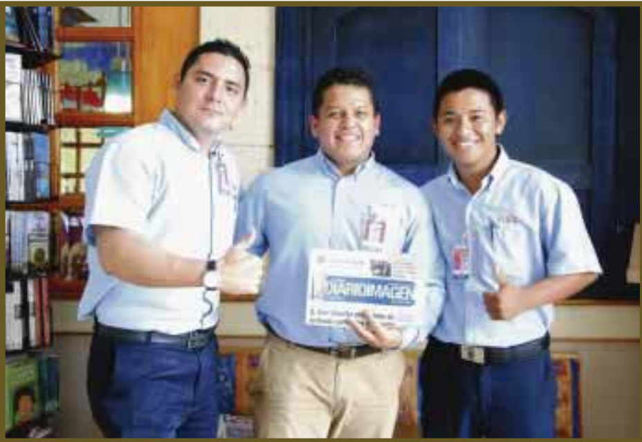
El personal de El Portón posa para DIARIO IMAGEN.