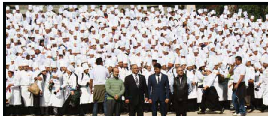
En el récord Guinness de la ciudad de México.