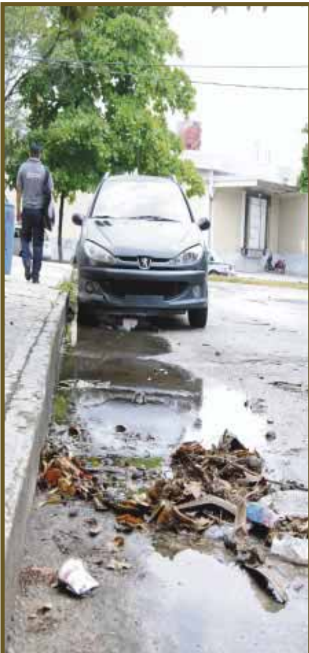
Agua encharcada y basura es lo que dejaron las fuertes lluvias.