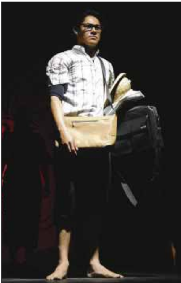
Aquel hombre que ahora encuentra su esencia, decide vivir su única vida.