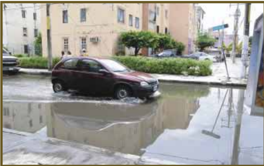
Automovilistas se arriesgan a transitar por estos lugares.