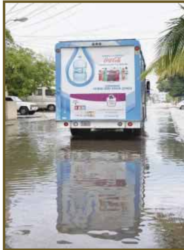
Con grandes encharcamientos luce la ciudad.