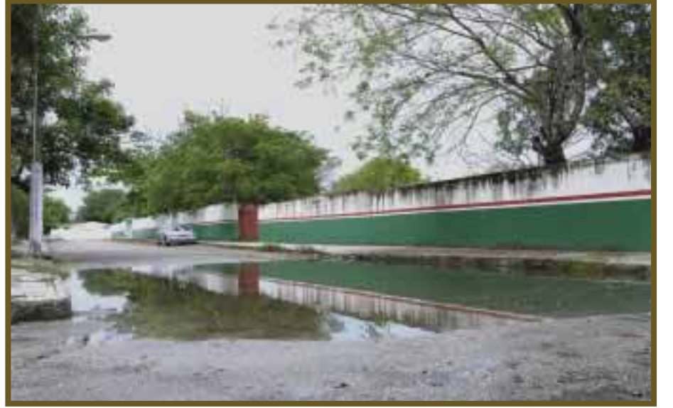
Escuelas se ven afectadas por los profundos charcos.