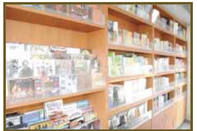
Se oferta material cultural, como libros, música y algunas publicaciones de interés.