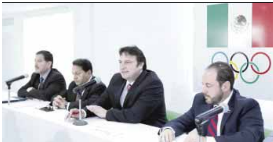
Funcionarios del deporte mexicano, al anunciar ayer el número de participantes en la delegación mexicana a los Juegos Centroamericanos y del Caribe.