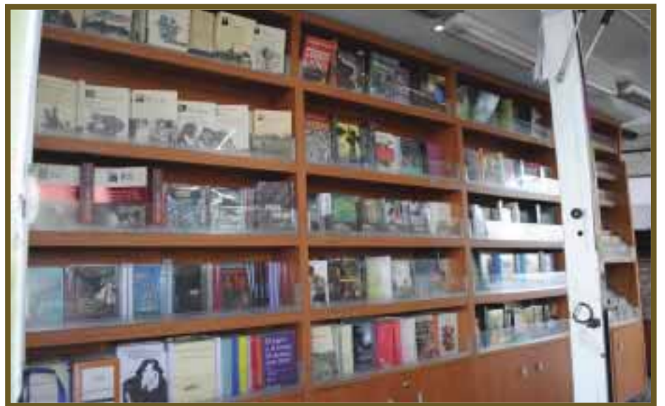
En un recorrido por la ciudad de Cancún.