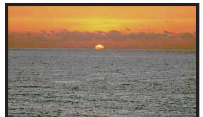
EN EL ESTADO, la luz del sol es dinero.

Carrillo Puerto en la zona maya no realiza el cambio de horario establecido por la federación desde 1998 y con su horario rebelde busca aprovechar la luz natural y por ello desobedece la orden cuando... >6