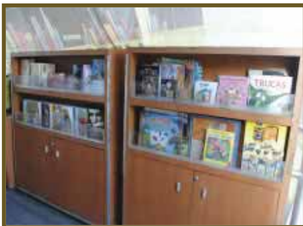
En puntos estratégicos, la misión del proyecto fue exitosa.