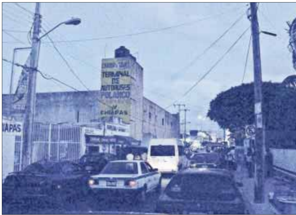
De esta forma se encuentra la Calle 7 de la supermanzana 66, donde se han registrado varios atracos.

Los atracadores aprovechan la escasa iluminación en la zona para cometer sus fechorías