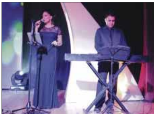
Dueto versatil, interpreto conocidos exitos