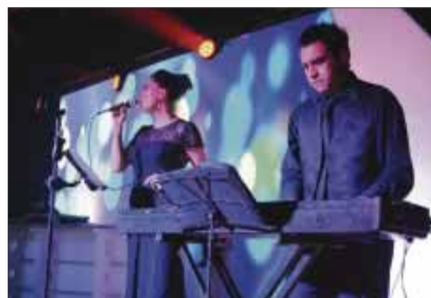
Para el gusto de la gente ofrecieron complacencias.