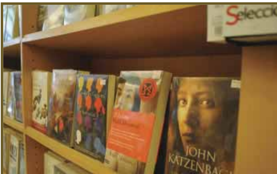
La cultura se acerca a zonas alejadas.