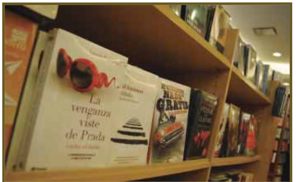
Ha sido buena la respuesta de los visitantes.