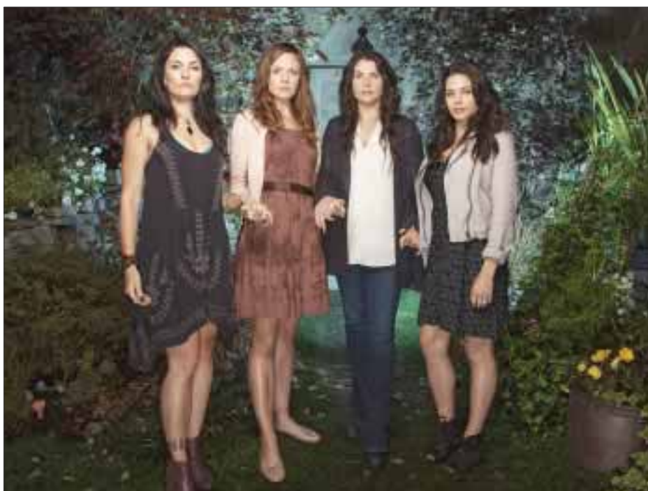
Con una entrega especial de dos episodios seguidos: "La otra llave" y "Ah, qué mundo", la serie festeja el "Halloween" y su éxito en nuestro país.

Lifetime tiene preparada una aterradora noche con: