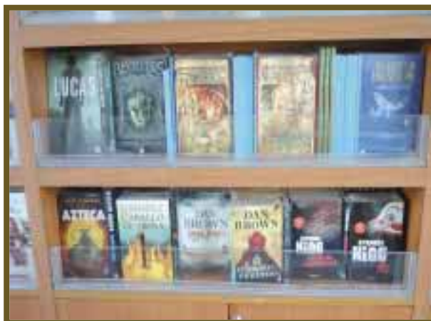
La literatura es extensa y variada.