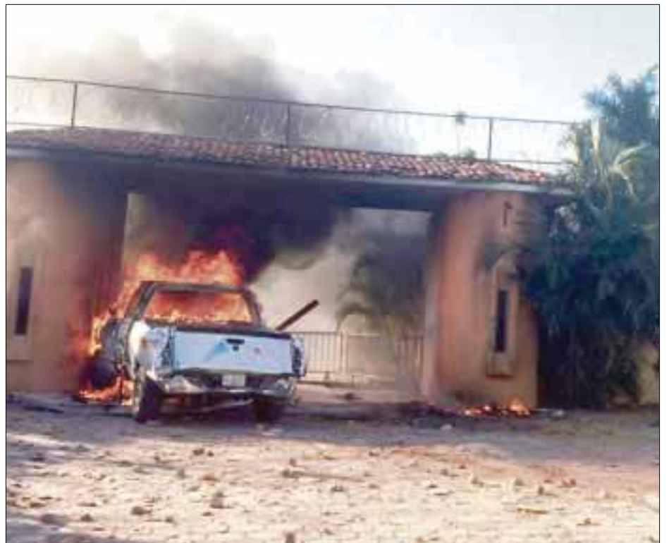
Esta es la Casa Guerrero, residencia oficial del gobernador de ese estado, que fue vandalizada por maestros, que estamparon una camioneta en la puerta y le prendieron fuego.

“Era fundamental dado lo que había ocurrido. Tenía día y medio que había sucedido. Fue el comentario directo, preciso, que le pusiera doble vigilancia, para que no fuera a escapar dado que la responsabilidad se le veía”