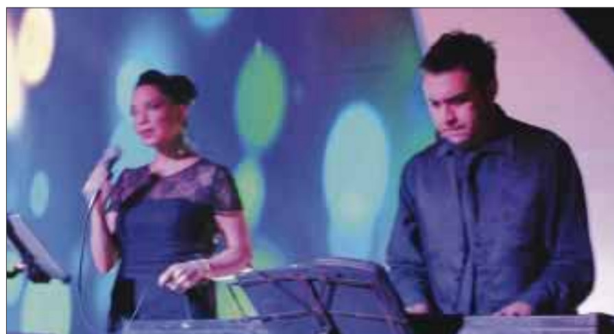
Música acústica para pasar noche bohemia.