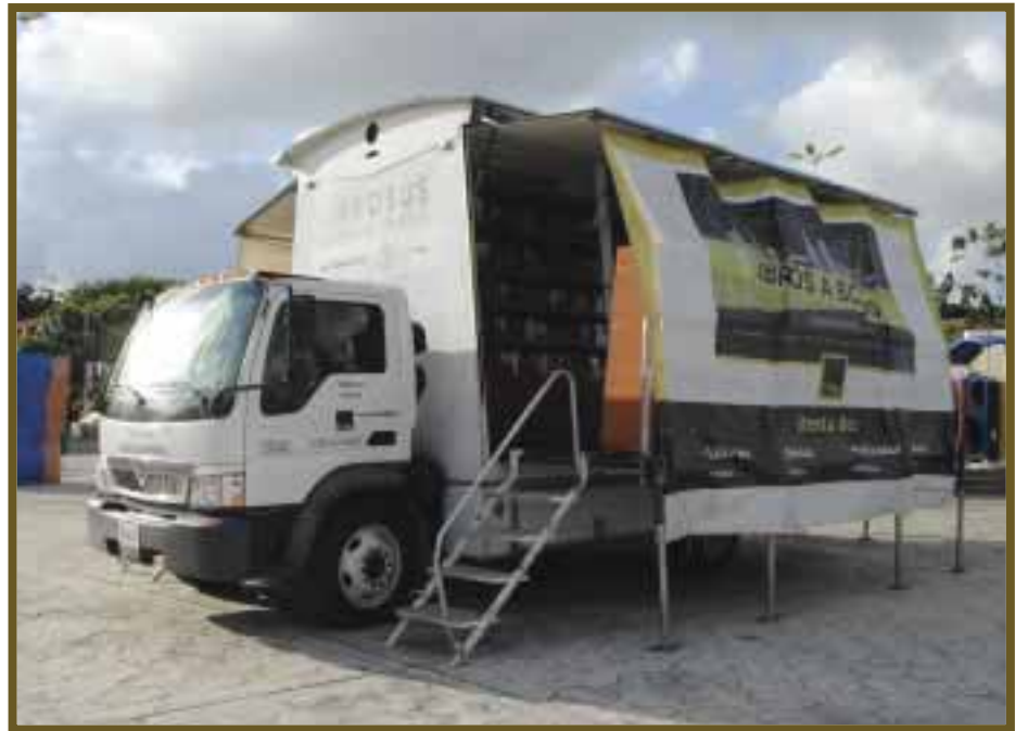
Librobús espera recorrer más ciudades.

Librobús realizó un recorrido por diferentes puntos de Cancún, Playa del Carmen y Puerto Morelos. Asimismo, se ubicó a las afueras de escuelas en zonas de la periferia, culminando su estancia en el parque Las Palapas.