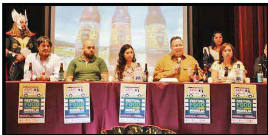
En la presentación del Festival Internacional de la Cerveza Food Truck & Beer .

☆☆☆☆☆ El Festival Internacional de la Cerveza Food Truck & Beer Morelia, se realizará de 1 al 3 de noviembre y no faltará esa tradicional diversidad de colores, olores, texturas y sabores en gastronomía y cervezas de calidad es lo