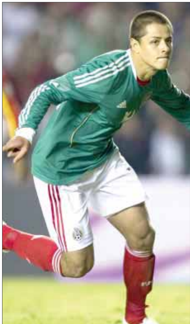
Javier "Chicharito" Hernández es uno de los integrantes de la legión extranjera llamados a integrar la selección nacional.