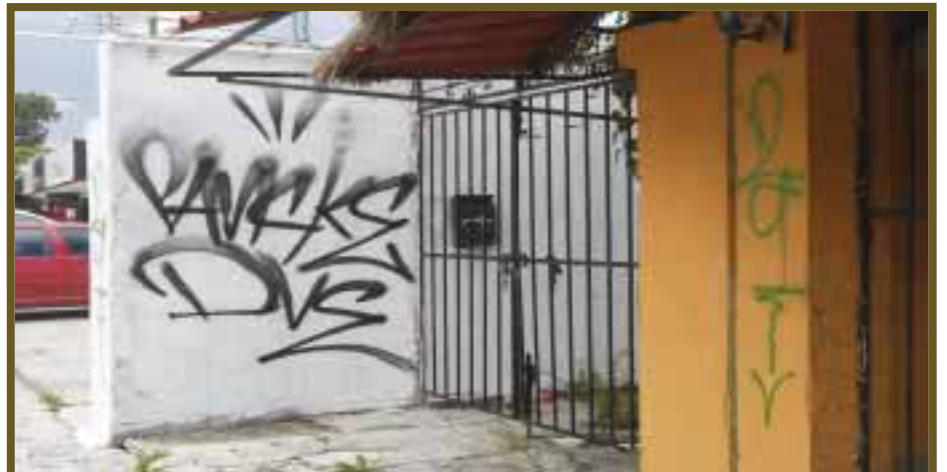
Entradas de domicilios particulares.