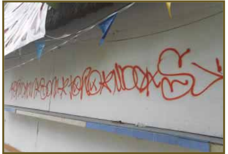
Caseta de comida abandonada.