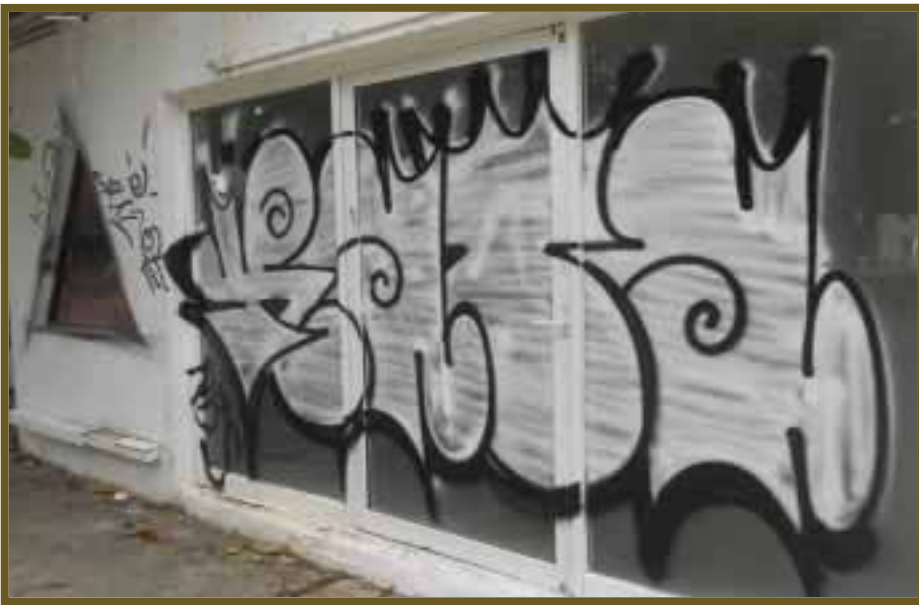
La falta de respeto por la propiedad ajena ha desatado una oleada de vandalismo.