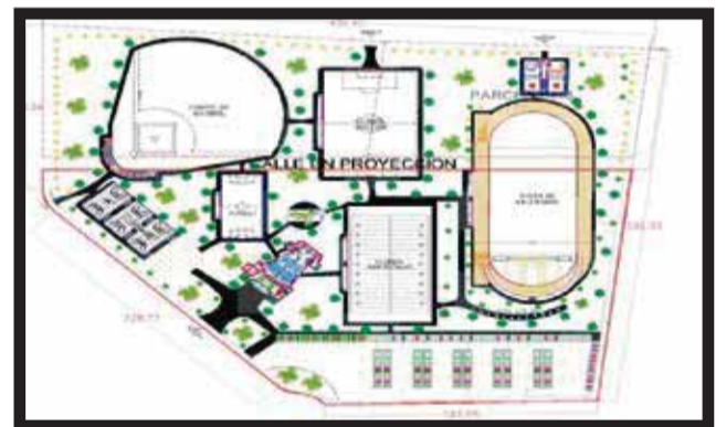
LA OBRA BENEFICIARÁ a una comunidad de seis mil personas.

tistas saldrán beneficiados. El funcionario detalló que en esta unidad deportiva concentrará de forma integral las disciplinas deportivas de la región, donde se incluirá la escuela técnico deportiva... >2