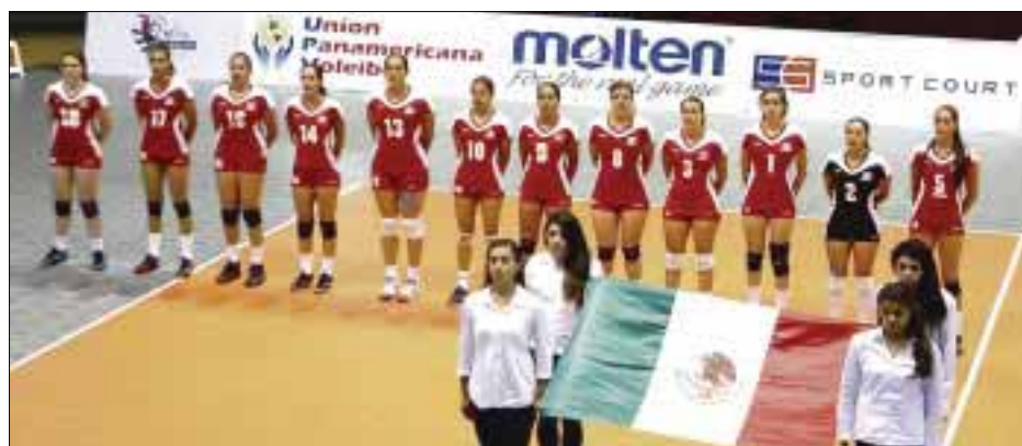
Verona, Italia.- La selección mexicana de voleibol femenil se enfrenta hoy a su similar de Estados Unidos, en su primer partido en el mundial de la especialidad.

"Todo depende de lo del Barcelona, si dependiese de mí yo ya estaría aquí hace 15 días, pero no depende de mí", dijo el mexicano.