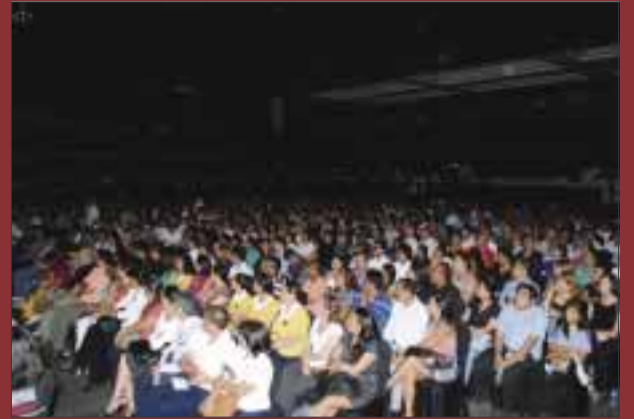
El auditorio registró lleno total.