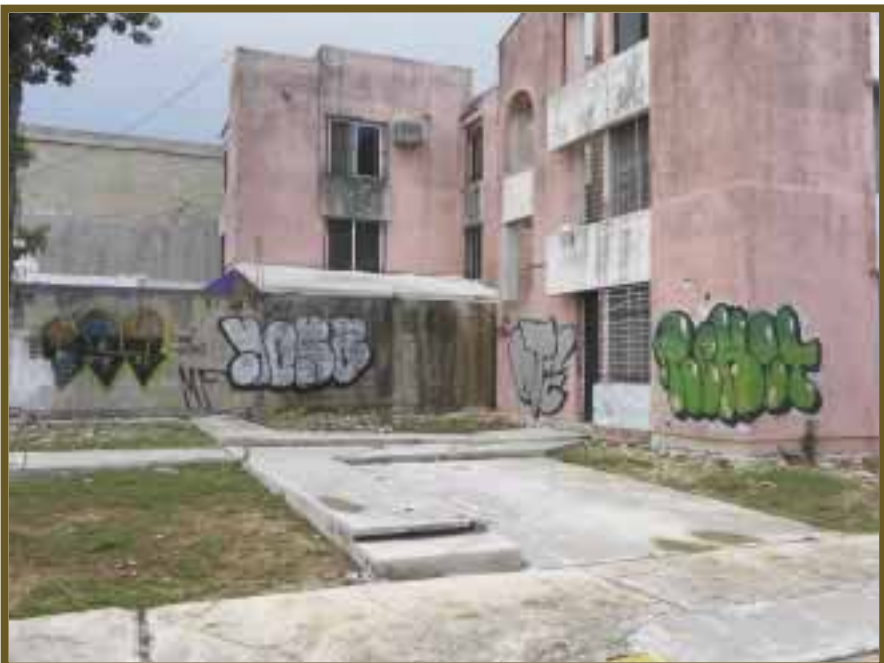
Las unidades habitacionales lucen así.