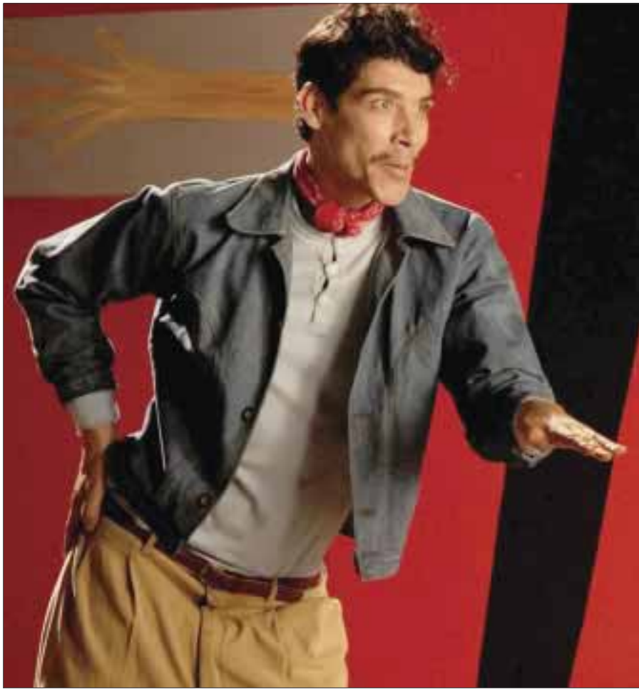
De acuerdo con Videocine, encargada de distribuir la cinta en México, "Cantinflas" se colocó en primer lugar del top ten de la taquilla mexicana.

De acuerdo con Videocine, encargada de distribuir la cinta en México, "Cantinflas" se colocó en primer lugar del