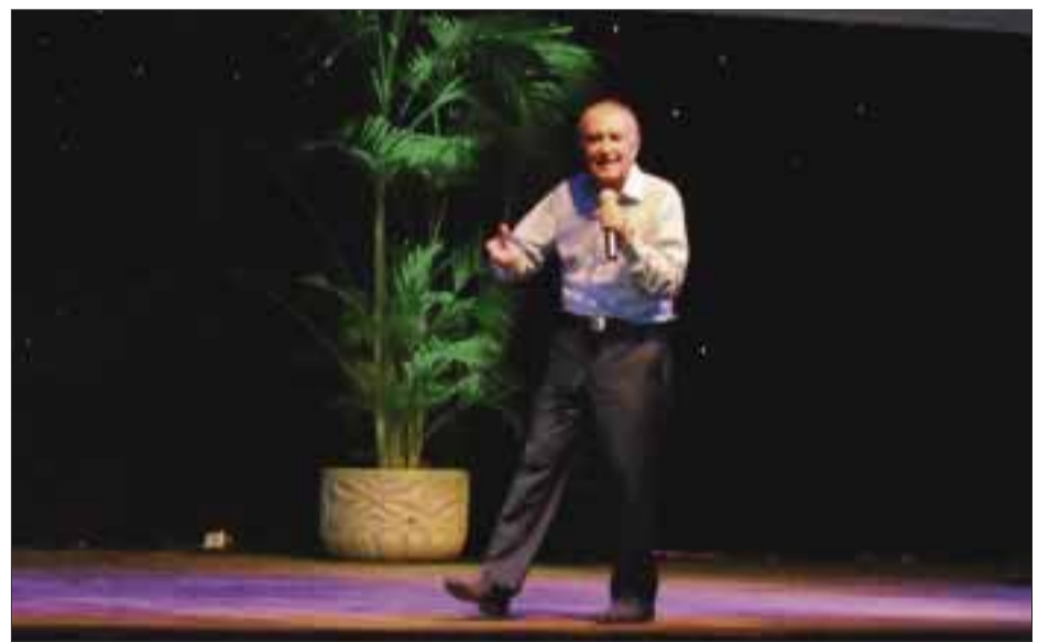
Pedro Ferriz de Con.

Estimado lector, si tiene algún acontecimiento social, cultural, deportivo, etc. Envíenos un correo y DIARIO IMAGEN con gusto lo cubrirá y publicará. diarioimagenqroo@gmail.com