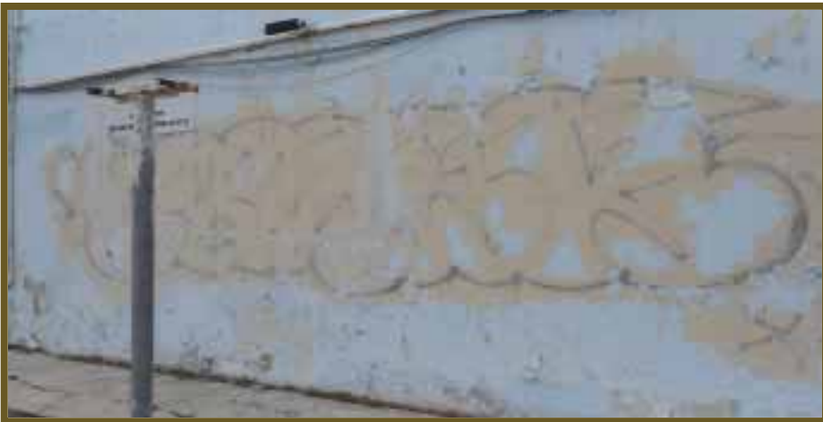
A pesar que tratan de cubrir con pintura la imagen, no mejora.