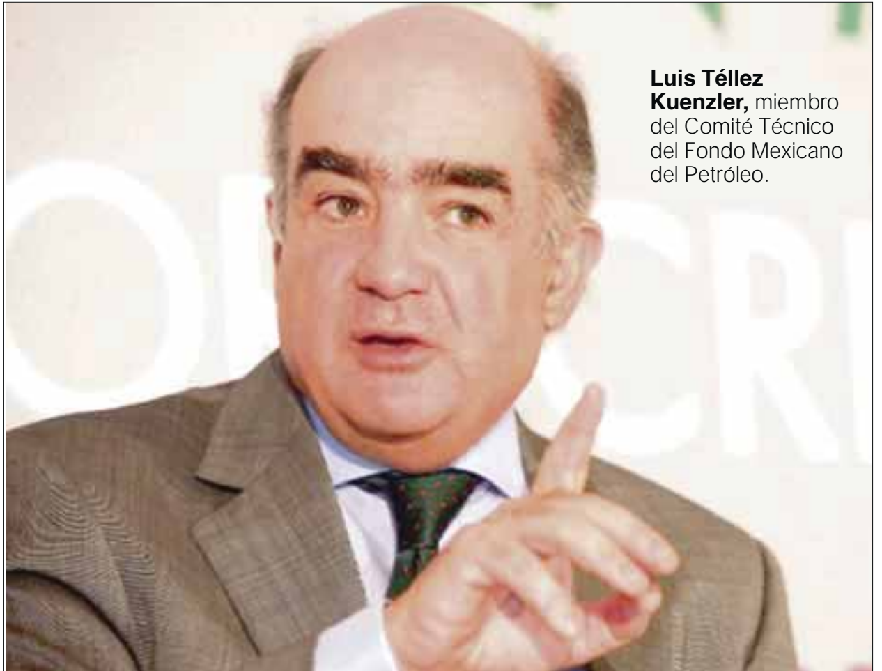
Luis Téllez Kuenzler , miembro del Comité Técnico del Fondo Mexicano del Petróleo.