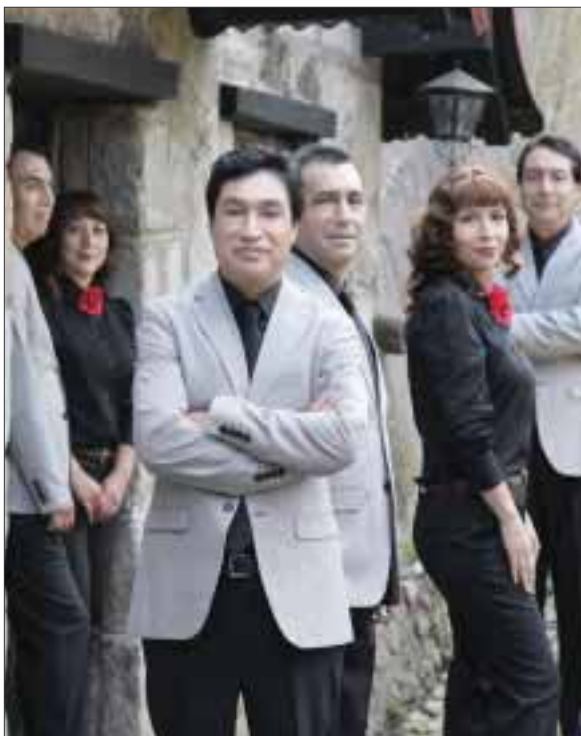
Reconocidos por las más grandes figuras de la escena musical nacional, los oriundos de Iztapalapa han sido nombrados como una de las figuras líderes de la sociedad mexicana en la actualidad.

Los boletos para ser testigos de este gran concierto están disponibles en taquillas del Auditorio Nacional y a través del sistema Ticketmaster.