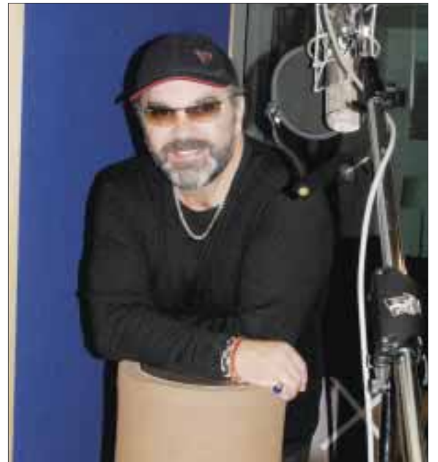
"Ya llevaba varios años sin hacer nada inédito, ya me tocaba hacerlo y estoy orgulloso": Mijares.

La cinta cuenta con las actuaciones especiales de Bárbara Mori (Elizabeth Taylor); Adal Ramones (Fernando Soto "Mantequilla"); Joaquín Cosío (Emilio "Indio" Fernández); Ximena González Rubio (María Félix), Rafael Amaya (Frank Sinatra) y Michael Imperioli (Mike Todd).