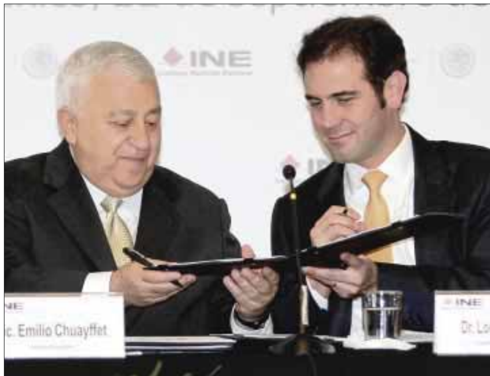
Los titulares de la SEP, Emilio Chuayffet Chemor, y del INE, Lorenzo Córdova, firmaron convenio de colaboración.