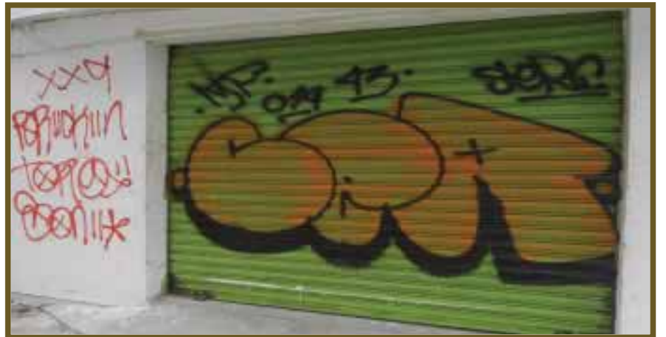
Comercios lucen esta imagen.

Negocios y casas-habitación han sido tapizadas con los dibujos mal hechos, registrando además de la mala imagen, una reducción en la afluencia de clientes, por la desconfianza que esto provoca en los visitantes. Es urgente la restauración de estos espacios para recuperar los espacios que han sido rayoneados.