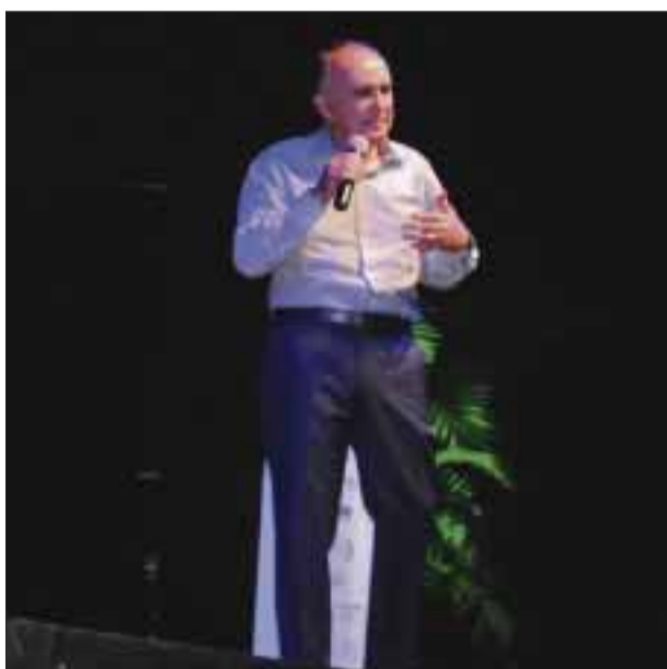
Durante su conferencia.