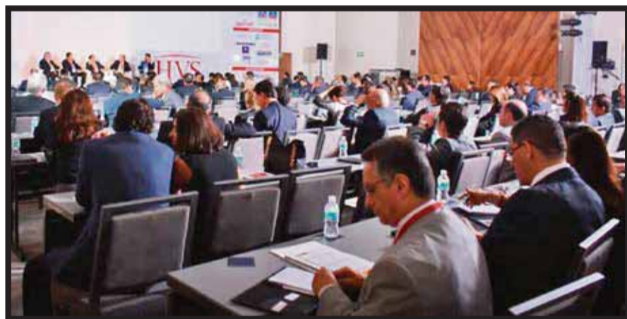
Durante MexHic 2015.