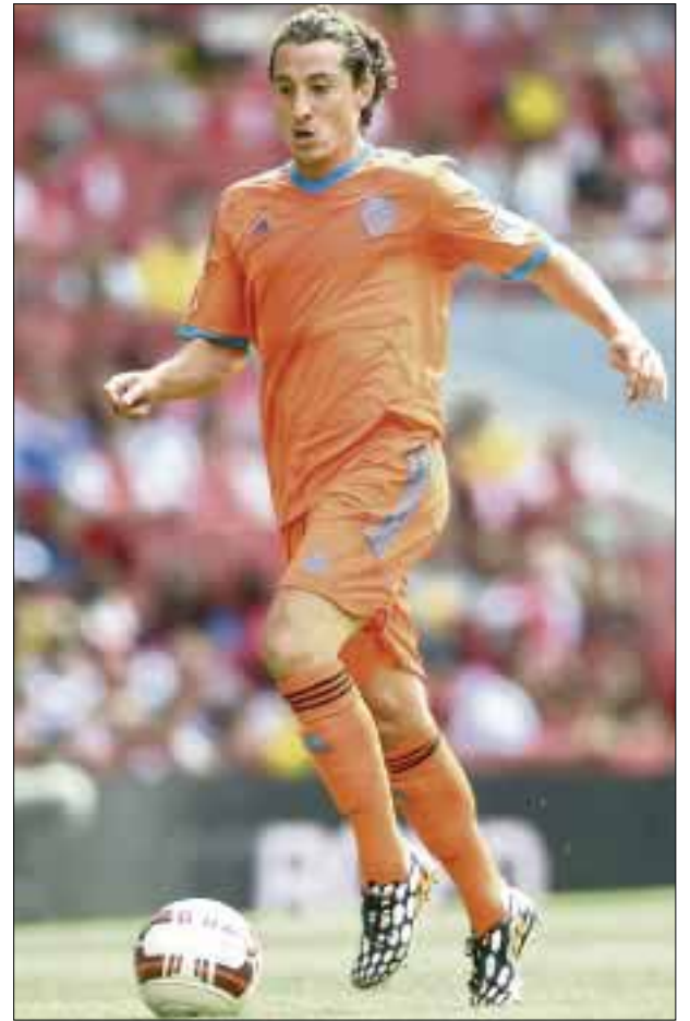
Reconocen en Holanda el trabajo que ha hecho el volante mexicano Andrés Guardado con el PSV Eindhoven.

Ha disputado las Copa del Mundo Alemania 2006, Sudáfrica 2010 y Brasil 2014, en la que marcó un gol en el triunfo de México sobre Croacia, dentro de la fase de grupos.