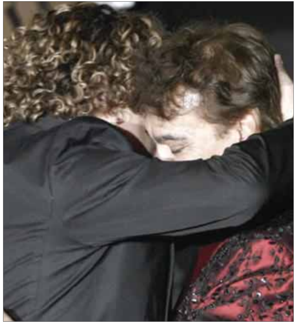
"El Divo de Juárez" se presentará durante 14 noches en el foro de la ciudad de México y el intérprete español será su invitado de lujo el 10 y 11 de abril.

Autor de más de un mil 500 canciones, Juan Gabriel ha ofrecido más de cien conciertos en el Auditorio Nacional desde 1981.