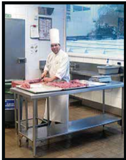
Por sexta ocasión el hotel recibe el Distintivo H.

Los panelistas fueron funcionarios de cadenas hoteleras nacionales e internacionales, como Accor , Apple Leisure Group , Choice Hotels México , Carlson Rezidor Hotel Group , Grupo Hotelero Santa Fe , Grupo Presidente , Grupo Posadas , G6 Hospitality LLC , Hilton Worldwide , Hoteles City , Hyatt of Latin America & Caribbean LLC , InterContinental Hotels Group , La Quinta Inn & Suites ,