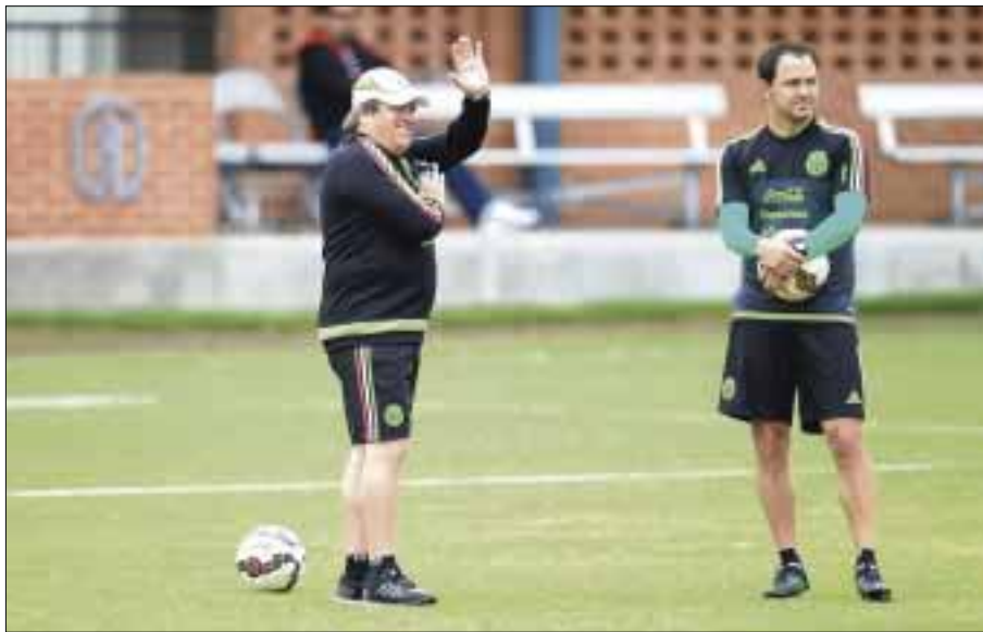
El Tri de Miguel Herrera y la selección estadounidense se verán las caras este miércoles en el Alamodome.