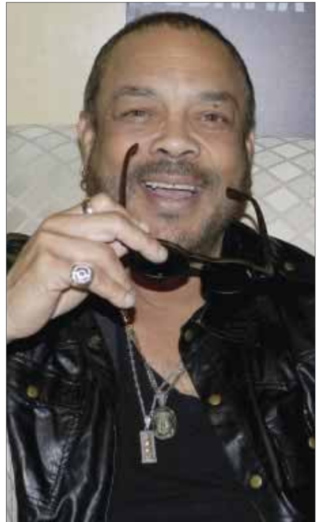
Francisco Céspedes realizará una gira, donde dará a conocer su nuevo material discográfico, además de interpretar sus grandes éxitos, en lo que serán noches muy bohemias.

Céspedes, quien abandonó su carrera de medicina para concentrarse en la música, durante varios años formó parte de algunas agrupaciones cubanas como el grupo de Puchito López (con el que visitó España por primera vez a principios de la década de los 90's) y la Orquesta Cubana de Música Moderna, agrupación con la que cantaba temas tanto de su autoría como de “feeling” -un movimiento de música que surgió en Cuba, el cual es una mezcla de bolero con jazz y con el que se estuvieron presentado a lo largo de su país-, para finalmente llegar a México, donde decide radicar iniciando una carrera en la música.