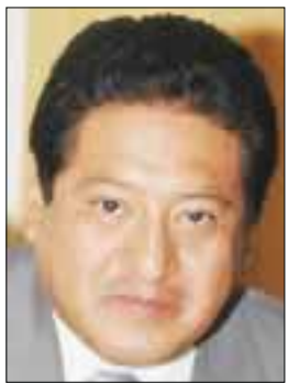
POR JORGE VELÁZQUEZ

Indicó que la importancia de este convenio radica en que actualmente en ninguna norma se establecen de forma clara los derechos básicos de ese sector como vacaciones, aguinaldo y todas las prestaciones.