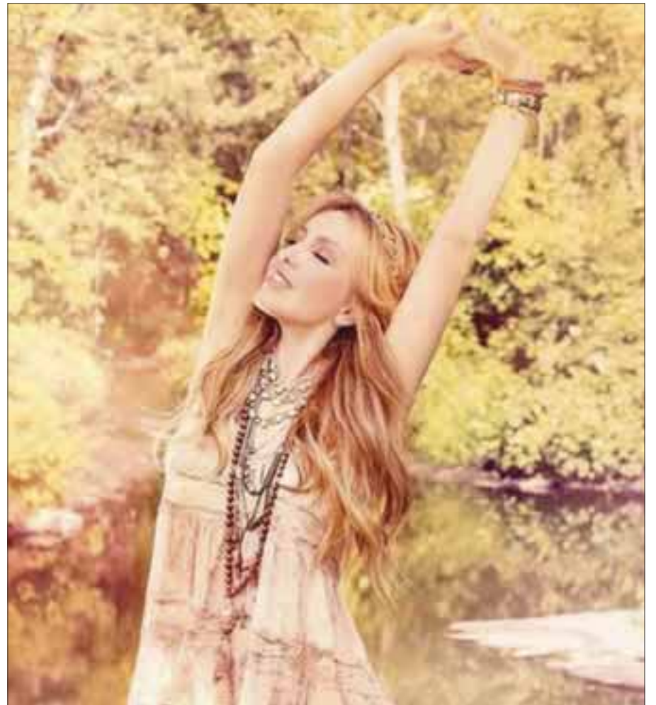
El tema "Sólo parecía amor" está incluido en su más reciente material discográfico "Amore mío". El material debutó en número uno en Amprofon y cuenta con certificación de oro en México, gracias a sus altas ventas.