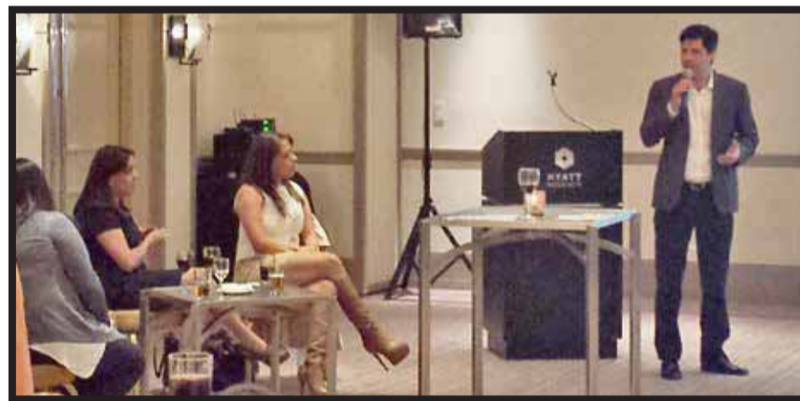
Presentan los Hyatt Place