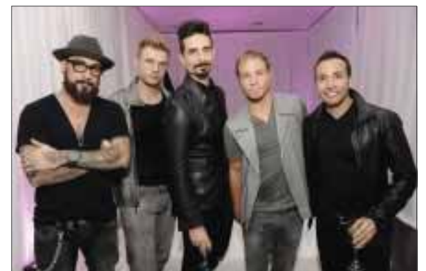
Los Backstreet Boys han sido nominados y han recibido múltiples premios Grammy, además de vender más de 130 millones de discos a nivel mundial.

Ha llegado el momento de que los Backstreet Boys presenten a sus fans mexicanos su más reciente álbum titulado 'In A World Like This' además de una selección de los temas que los colocaron en la cima de la realeza del pop mundial y que los ha mantenido como la boy band más importante de la historia.