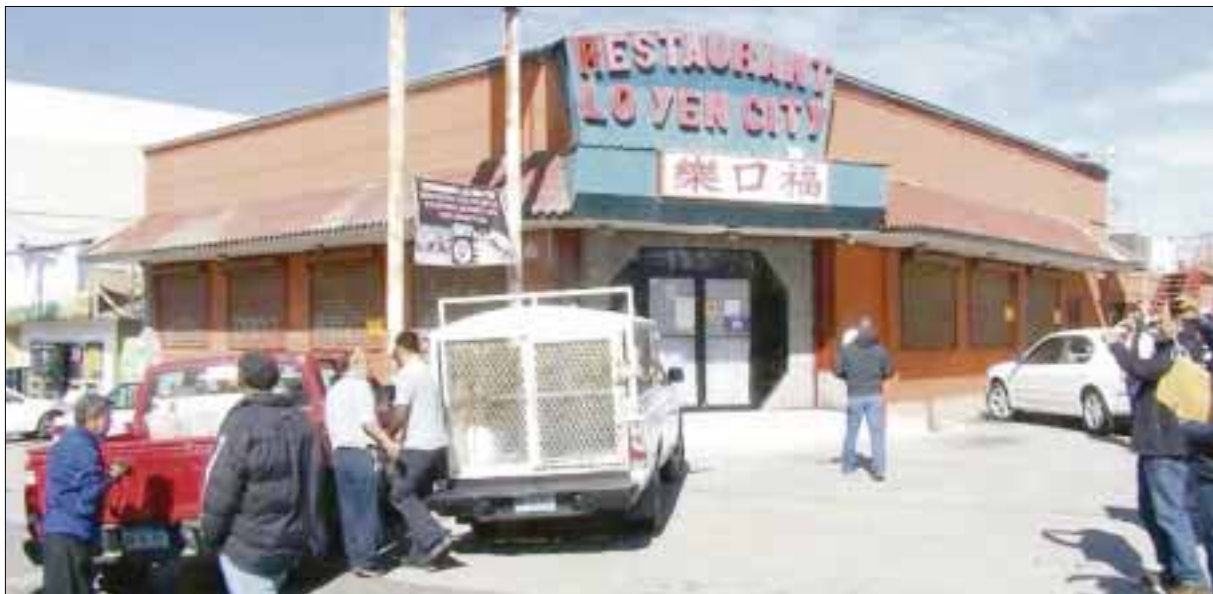
En la ciudad de Tijuana fue clausurado un restaurante que vendía platillos con carne de perro.