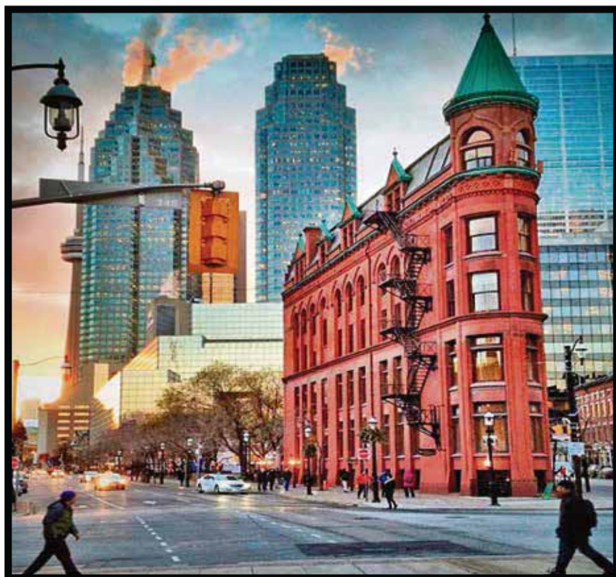
Las convenciones, pilar de la economía en Toronto.

Además, detalló que el enfoque de acciones en conjunto se dará no solo a vacacionistas, sino también al segmento corporativo, lo que lo hace doblemente interesante, según el perfil del turista