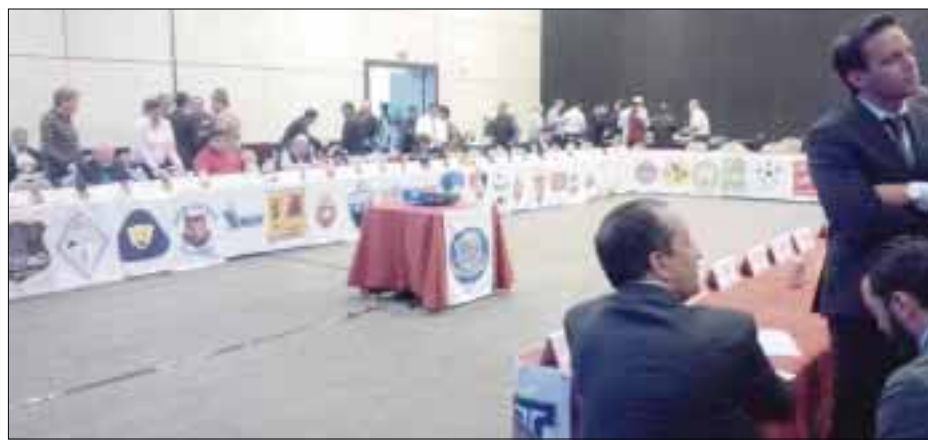
El partido de ida de los Pioneros se desarrollará en el estadio de los Potros, mientras que el de vuelta será en Reynosa.

Como ha sido una costumbre en Pioneros de Cancún, la entrada para este trascendental partido de ida, será completamente gratis, por lo que la directiva de los caribeños ha anunciado el reparto de al menos cinco mil boletos para los aficionados, que podrán ser adquiridos en puntos todavía por definir.