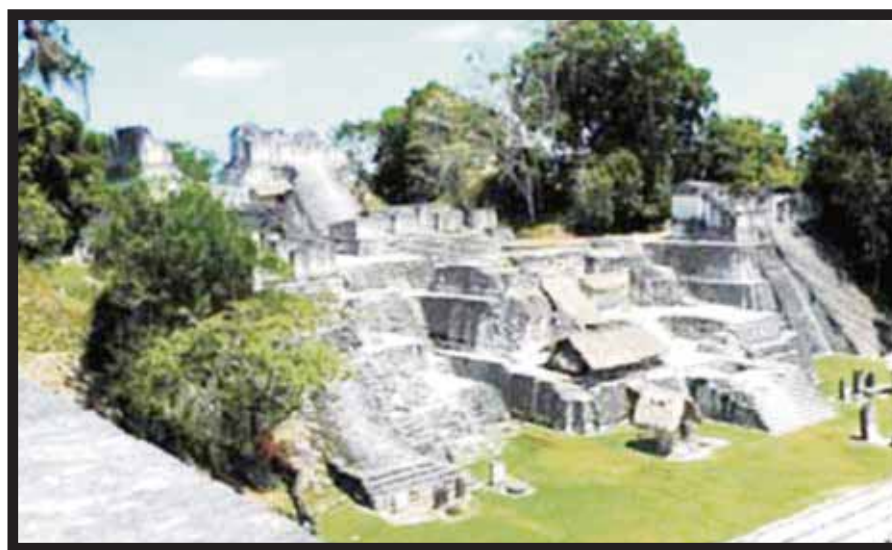
Tikal, un lugar mágico.