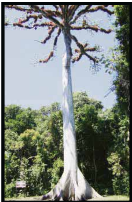
La ceiba, el árbol sagrado de los mayas.

sagradas de los mayas y símbolo de Guatemala.