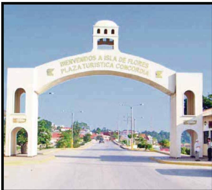
El arco que da la bienvenida a Flores.