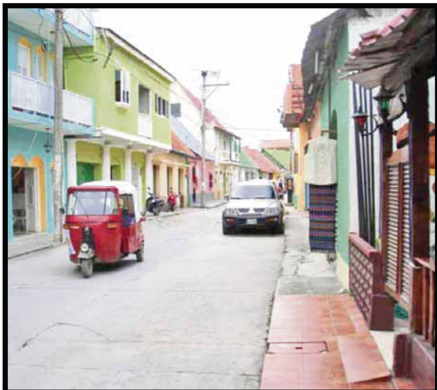
Isla de Flores, en El Petén.

En Tikal la selva se despliega en inmensa variedad y abundancia de flora y fauna. Ahí habitan especies extintas en el resto del mundo y por eso es también un santuario para los amantes de la observación de aves. Es refugio de tucanes, loros, guacamayas, colibríes, especies muy raras como los halcones de pecho naranja y quetzales, las aves