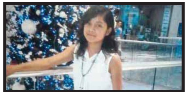
LA POLICÍA TIENE REPORTES DE DOS ADOLESCENTES desaparecidas, una ya regresó a su casa.

también dieron a conocer la desaparición de una joven de 12 años de edad, pero la policía aún no inicia su búsqueda, porque los padres aún no... >2