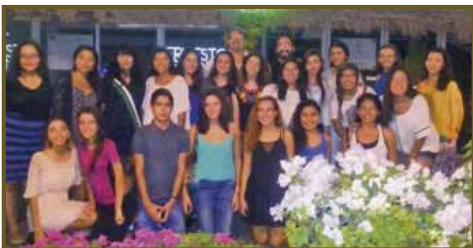
Los alumnos y docentes que participaron en la exhibición de las obras.