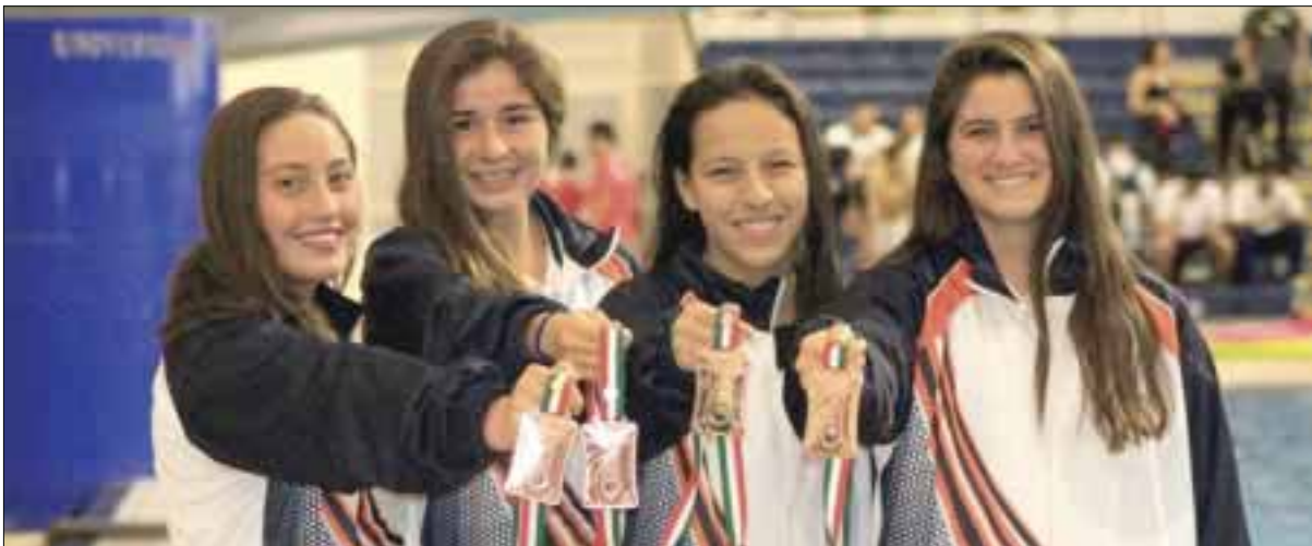
Un buen papel han desempeñado hasta ahora, los representantes de la selección de Quintana Roo en la Olimpiada Nacional.