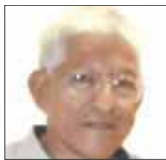
POR ÁNGEL SORIANO

Las tecnologías de la información y comunicación “han tomado gran parte para facilitar las tareas de comunicar e informar a la ciudadanía en casos de emergencia”, indica el dictamen.