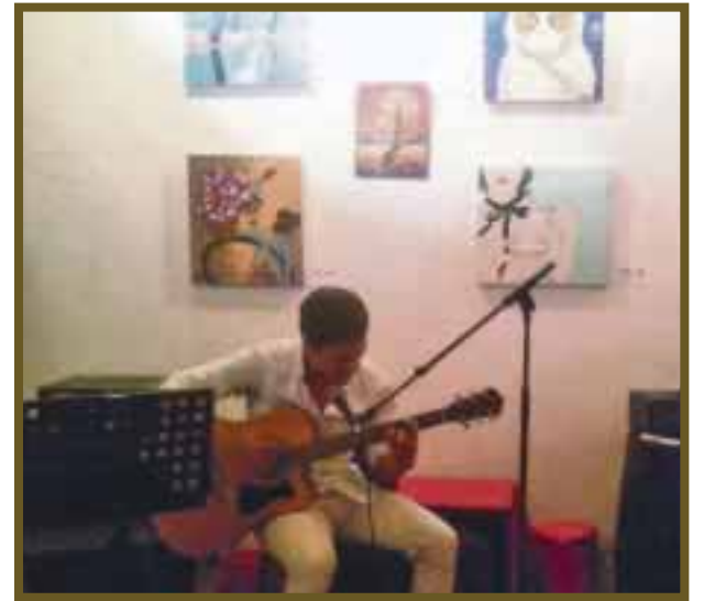
Algunos estudiantes amenizaron la noche con música bohemia.