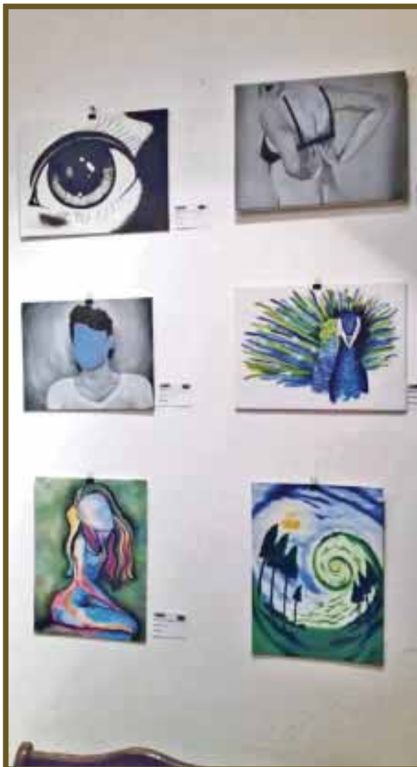
Se observa la evolución de los artistas en la disciplina.