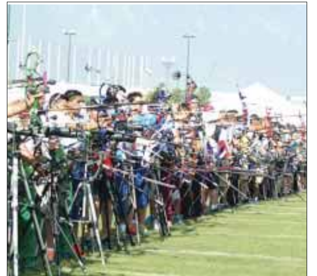
Muy cerca del metal dorado se encuentran los modernos "Robin Hood" del estado en la olimpiada, que se celebra en Monterrey.

anunció también que con el plantel se ha tenido una plática personalizada, analizando su rendimiento en el torneo y se definirá su situación en el transcurso de los días para ir formando el cuadro base que arrancará las prácticas.