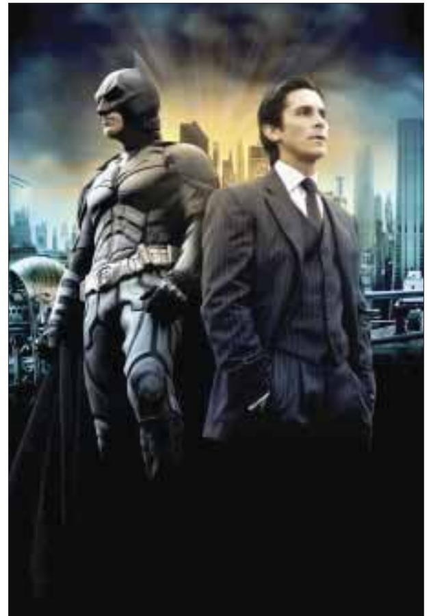
Los creadores de Batman afirmaron que la capa se retira junto con Bruce Wayne .

Marvel Comics, la casa de Los Vengadores, X-Men y Spiderman, ofrecerá comics gratuitos en inglés y español ese día.