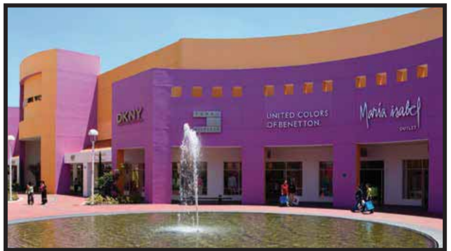
Premium Outlets Punta Norte.

☆☆☆☆☆ Desde ahora y hasta el 2030, más de 1.8 mil millones de personas harán viajes internacionales todos los