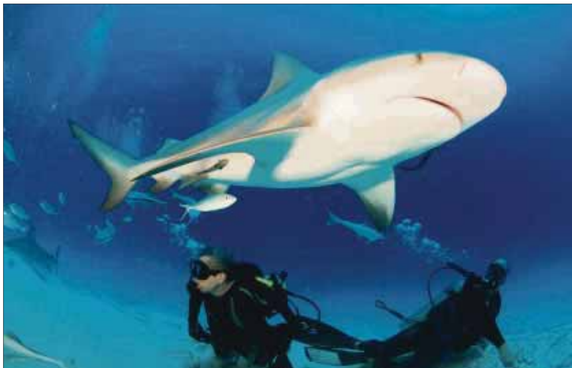
La fotografía submarina con escualos y otros especímenes es lo que pretenden llevar a cabo los socios de la cooperativa.

Indicó que este planteamiento ya fue presentado a las autoridades, pero es necesario ser reiterativos a fin de preservar los ejemplares que habitan en la zona de la reserva de Sian Ka'an.