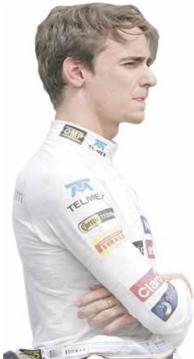
Esteban Gutiérrez piloto de la F-1.

Ferrari se convirtió en el segundo equipo de Fórmula 1 en presentarse en la capital mexicana rumbo al Gran Premio de México en el Autódromo Hermanos Rodríguez, antes en el Zócalo estuvo Red Bull.