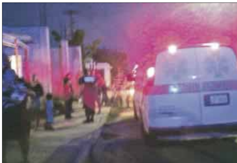
La mujer fue ingresada al Hospital General.