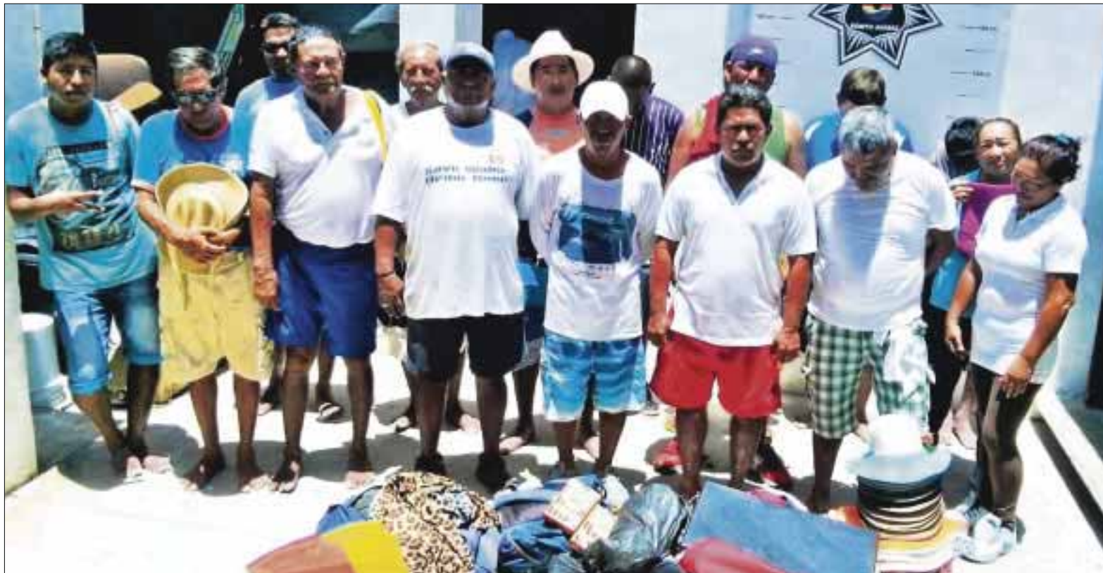
Turistas denunciaron a 17 vendedores ambulantes por vender plata falsa en playas de Cancún.

En esta temporada de vacaciones llegan a este destino turístico cientos de vendedores ambulantes de distintas entidades a vender su mercancía, que va desde artesanías de "plata", cobijas, dulces, bloqueadores solares, hasta quienes sólo traen una canasta en la que co-