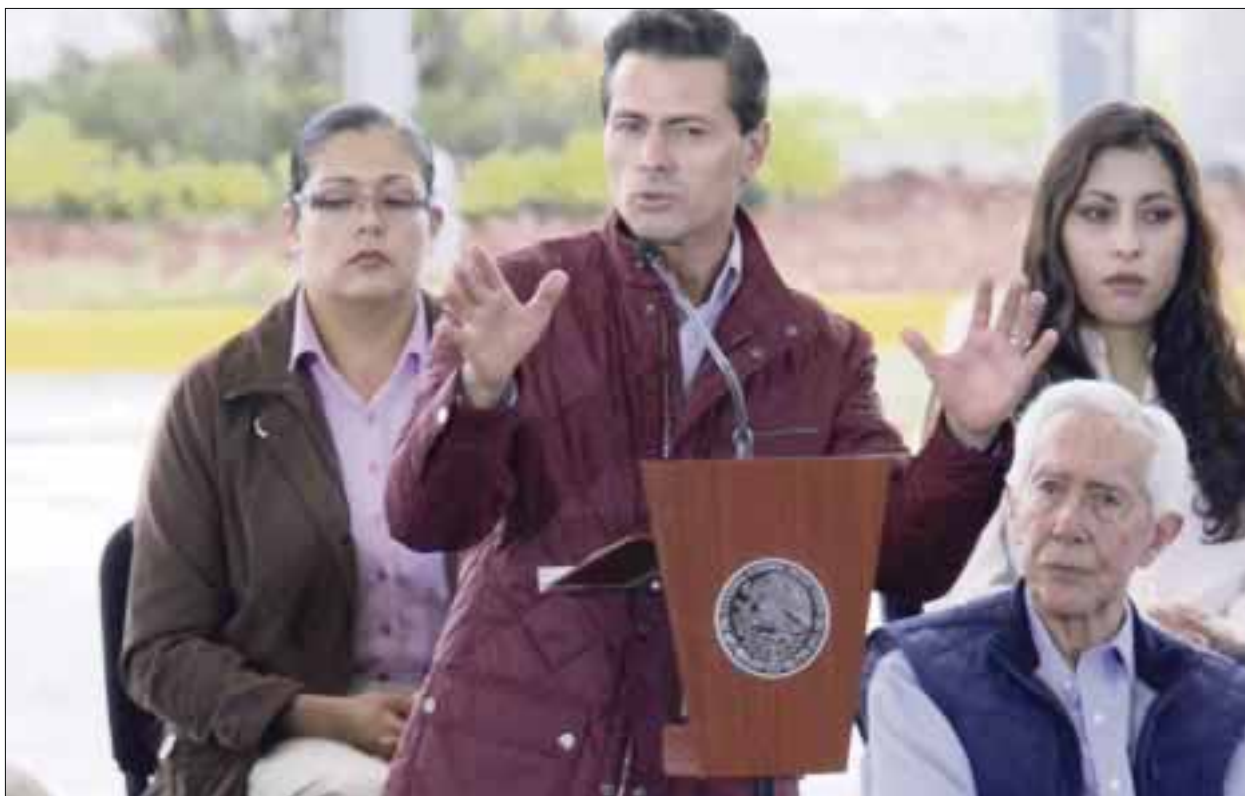
El presidente Enrique Peña Nieto, al encabezar la entrega del Distribuidor Vial "Ignacio Pichardo Pagaza", en San Mateo Atenco, Estado de México.

A partir de un diagnóstico de lo que el país necesitaba, se determinó que no sólo era necesaria la am-