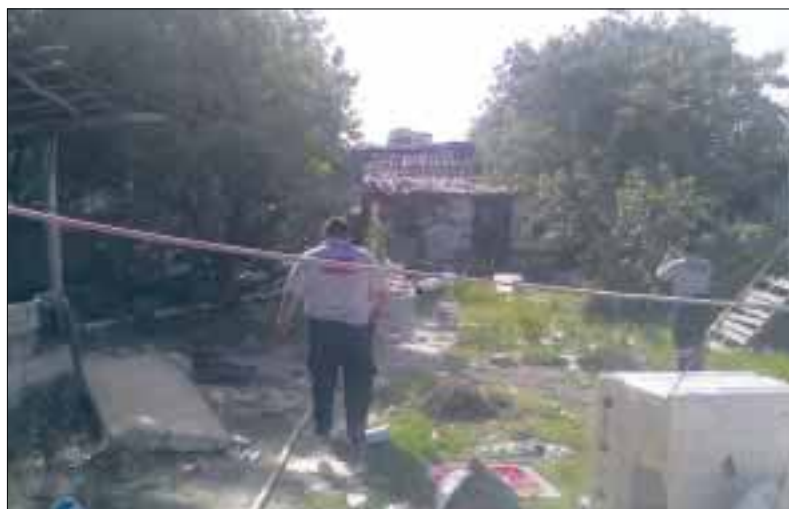
Bomberos inspeccionaron el área para evitar cualquier amenaza de reinicio del incendio.

“Yo me asusté mucho. No supe qué hacer. Lo bueno es que los vecinos hablaron a los bomberos si no, hubiese perdido mi casa”, exclamó el afectado con visible crisis nerviosa, por lo que fue atendido por los paramédicos.