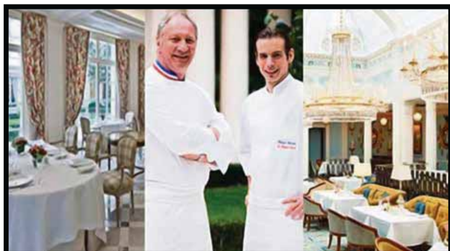
Ideal relación gastronómica.

“Deja que todos tus sentidos se envuelvan en música y aromas. Cada tratamiento es personalizado. Sentirás que te transportas a un lugar mágico donde tus sueños de verte y sentirte bien se harán realidad”, invita.