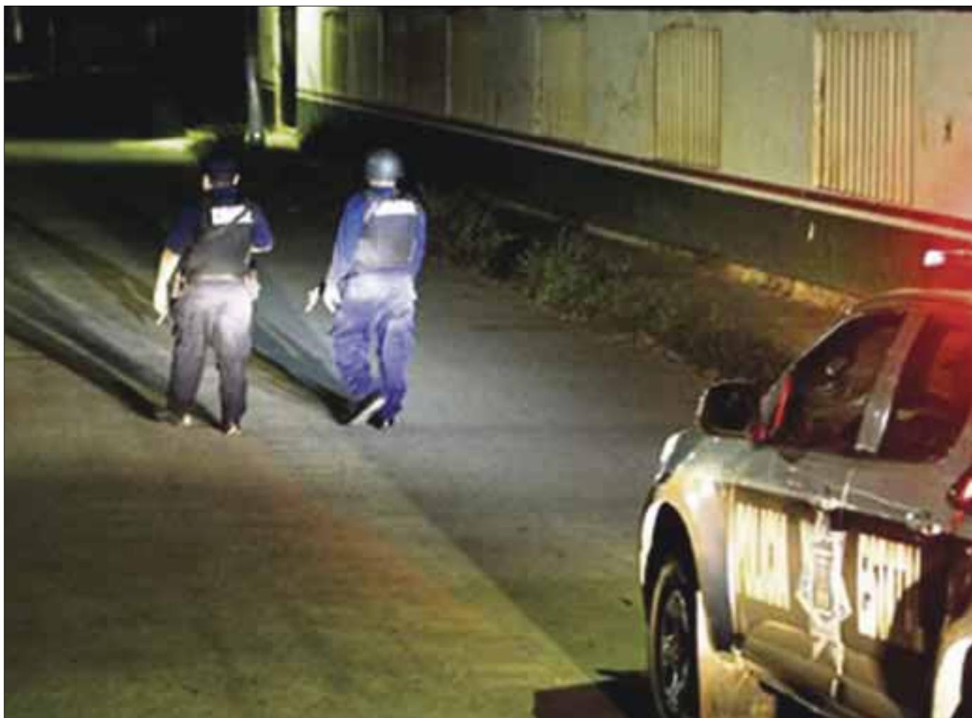
Se incrementaron los asaltos en zonas conflictivas de Chetumal en los últimos meses.

Policías preventivos también estarán recorriendo las calles en grupos, además de estar palpando la necesidad y denuncia de los colonos.