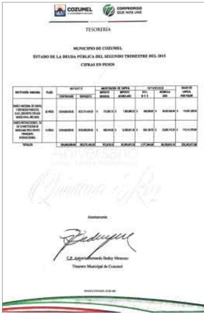
Documento oficial firmado por el tesorero, donde se muestra el estado de la deuda pública.

Asimismo, luego de presentar un análisis de la situación financiera del ayuntamiento de Cozumel durante el primer semestre del 2015, el representante popular indicó que en los próximos meses se presentará una reducción en la recaudación de la Tesorería, ya que la mayor parte de los contribuyentes han realizado el pago del impuesto predial y la recolección de basura. Por lo tanto, es necesario impulsar acciones de ahorro.