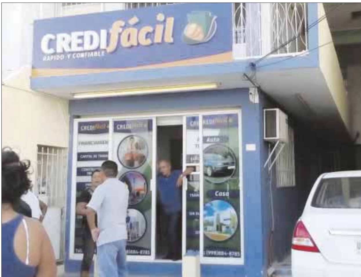
Difícil caso de las 50 familias defraudadas por Credifácil, pues no se ha podido tipificar el fraude.

Cabe mencionar que se unieron otras diez personas que también pagaron entre siete y diez mil pesos para recibir un préstamo de 150 y 200 mil pesos.