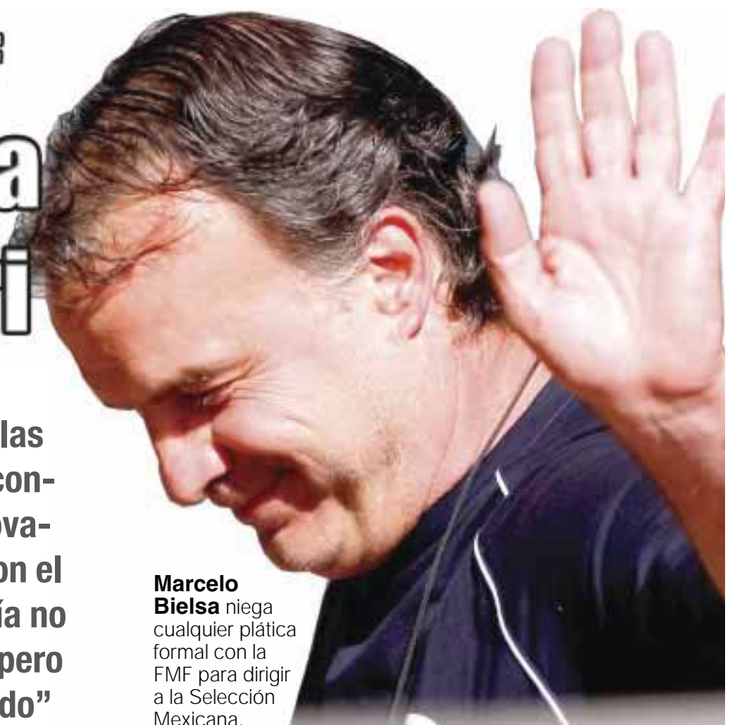
Marcelo Bielsa niega cualquier plática formal con la FMF para dirigir a la Selección Mexicana.

El 'Top Five' lo conforman Bélgica, con 1244 unidades; Alemania, con 1226 puntos; Colombia, con 1218, y Brasil, con 1186 puntos.