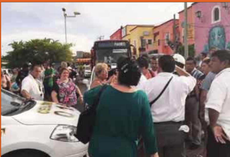
Este pleito se registró el miércoles, entre taxistas y camioneros de Turicún.

Cancún.- El problema que mantienen los taxistas del sindicato Andrés Quintana Roo, contra los conductores de camiones urbanos de la línea Turicún y Autocar, que desencadenó un escándalo y conato de bronca en avenida Xelhá, lleva meses afectando a los pasajeros, denunciaron los ciudadanos.