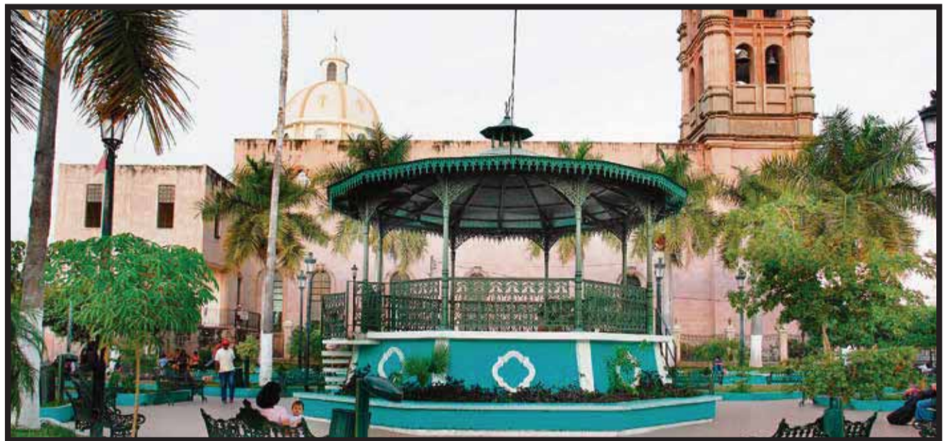
El Jardín principal de Escuinapa.

☆☆☆☆Volaris felicita a los 130 atletas y entrenadores de la delegación mexicana de Olimpiadas Especiales por su destacada partici-