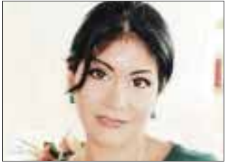
POR YOLANDA MONTALVO