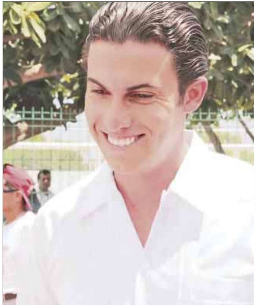
El impulso al uso de nuevas fuentes de energía hará necesaria la creación de otras empresas del ramo.

El joven diputado federal electo se pronunció por la instrumentación de mecanismos de financiamiento público y privado para paliar los riesgos del financiamiento inicial y problemas de liquidez