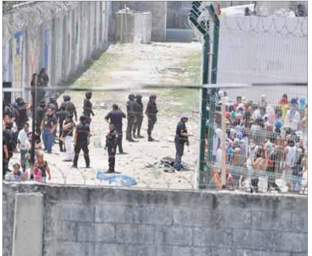
Trasladan a 14 internos al Cereso de Chetumal, como parte de las medidas disciplinarias por el pleito registrado el domingo pasado.

Trascendió que en su declaración, los tres reos coincidieron en señalar que de pronto empezaron a oír que gritaban "motín, motín", sin saber exactamente quién o por qué gritaban.