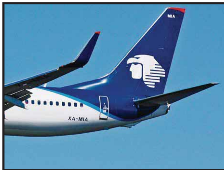
A partir de octubre, una cuarta frecuencia a Guatemala.

Para la Segunda Carrera Mayakoba, realizada el pasado 18 de julio, los Voluntarios OHL como líderes en temas comunitarios entregarán en el mes de agosto lo recaudado a la campaña "Todos Contamos", la cual se enfoca en promover los derechos de las personas con discapacidad y en apoyarlas en su desplazamiento diario por la ciudad. La carrera tuvo una asistencia total de 360 personas y logró recaudar 26 mil 500 pesos, que serán destinados a recuperar las zonas diseñadas para personas con capacidades diferentes, tales como: banquetas, señalamientos y rampas a lo largo de la ciudad.