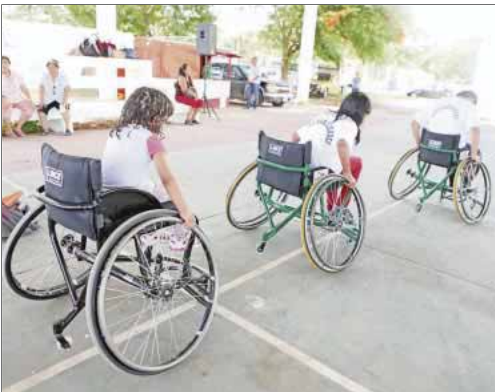
Las instalaciones fueron acondicionadas para que los jóvenes con discapacidad disfruten días de recreación.