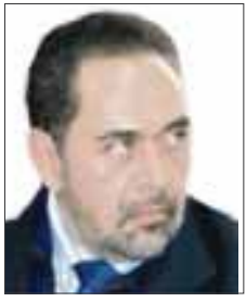
POR FRANCISCO RODRÍGUEZ