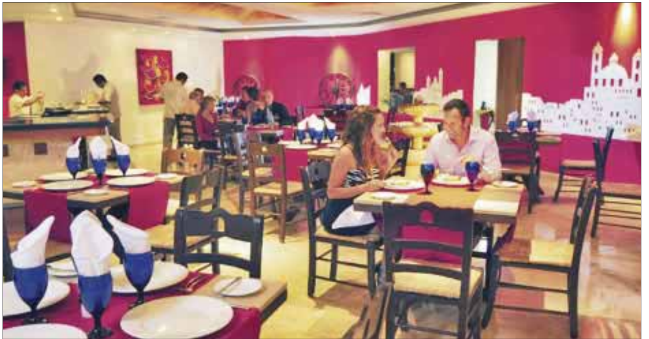
La Canirac aseguró que no se cumplieron las expectativas de su sector respecto al incremento de comensales en la pasada temporada vacacional de verano.

Si bien se logró un buen número de visitantes y una buena temporada de verano, algunos sectores no lograron sus metas, como es el caso de las fonas aunque hay algunas que sí les fue bien, aunque en lo general no se reflejó en los bolsillos. Mencionó, que hay promociones para tratar de mantenerse vigentes con precios atractivos, en particular para el próximo mes patrio, más para repuntar en sus actividades, que debió ser en el verano.