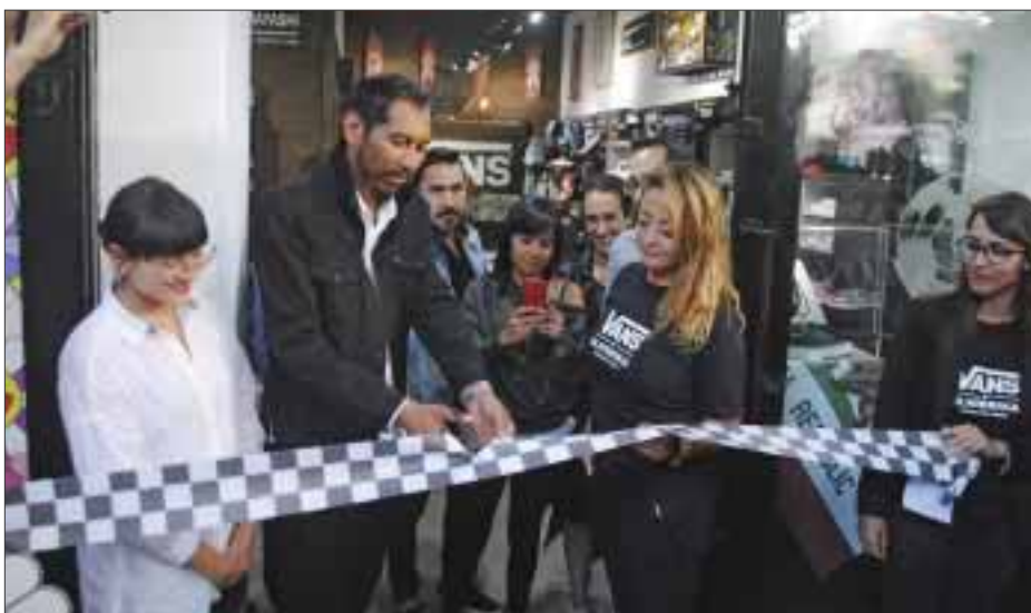
El corte de listón se llevó a cabo con la presencia de influencers, medios y fans

pendientes seguidores tanto de Anahí como de Wisin, se expresaron en internet, dando los mejores comentarios y lo más importante descargando masivamente el tema de iTunes y con esto colocando a sus artistas en el primer sitio de descargas de dichas plataformas en apenas unas horas de su lanzamiento.