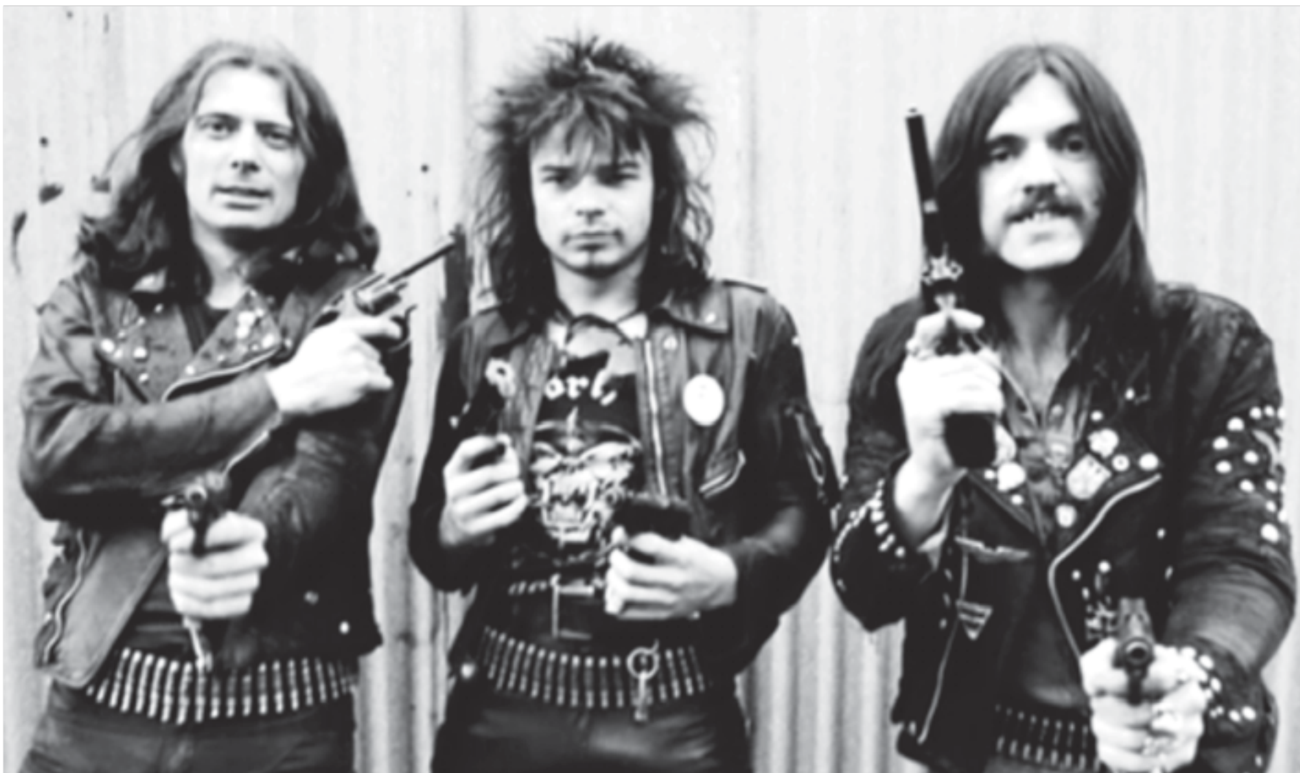
Así lucía la banda Motörhead con su alineación original