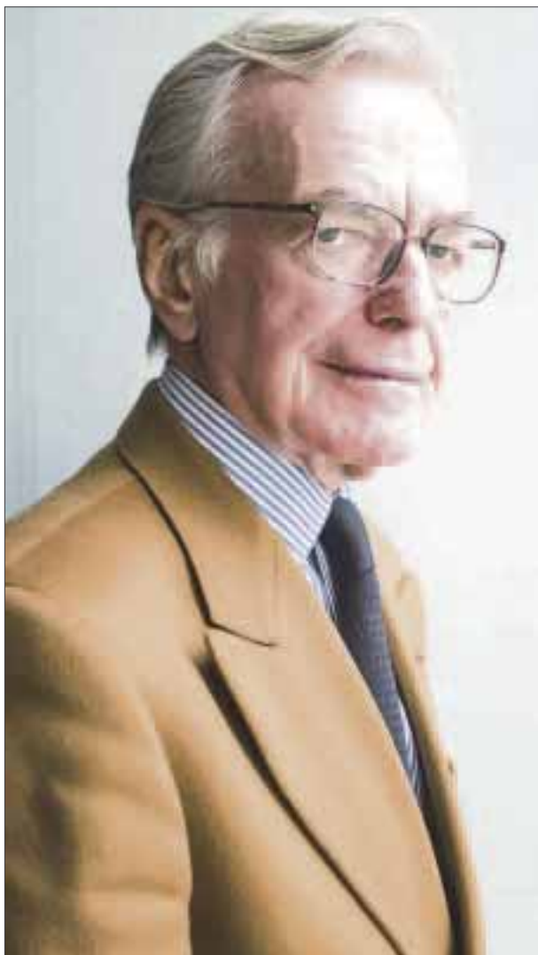
Jacobo Zabłudovsky, periodista mexicano falleció el pasado 2 de julio víctima de un derrame cerebral

Lemmy Kilmister, líder de Motörhead, ahora se suma a esa gran constelación de inmortales leyendas del Rock que permanecerán siempre en los corazones rockeros, en ca-