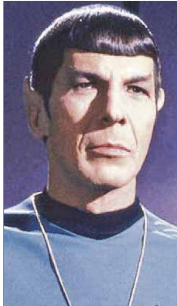
Los fanáticos de Star Trek sufrieron dos pérdidas este año, una de ellas la de Leonard Nimoy, legendario Spock