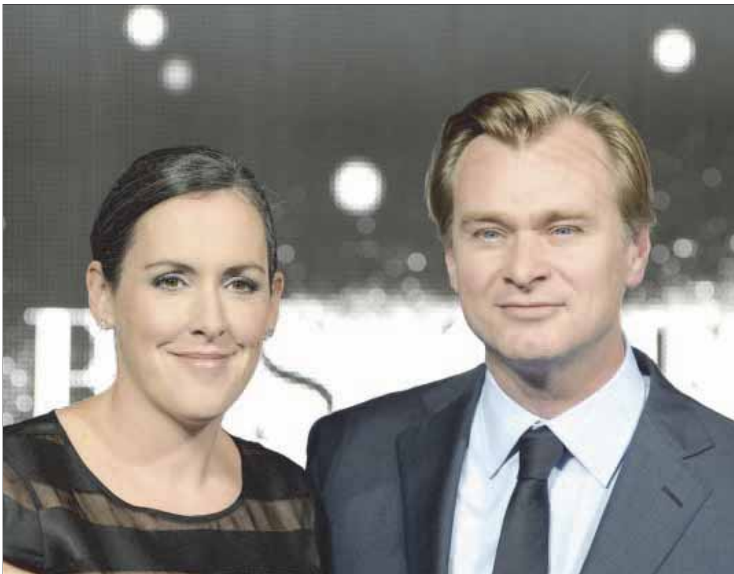
Nolan produciría la película, junto a su esposa, Emma Thomas.

***La cinta será un thriller de acción bélica ambientado en la Segunda Guerra Mundial