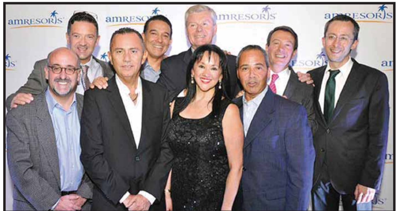
El equipo de AmResorts.

Asimismo, indicó “estamos en una coyuntura muy importante. Nos encontramos con el reto de abrir el hotel número 11 en sólo cuatro meses. Para lo que resta del año, buscamos alcanzar 50