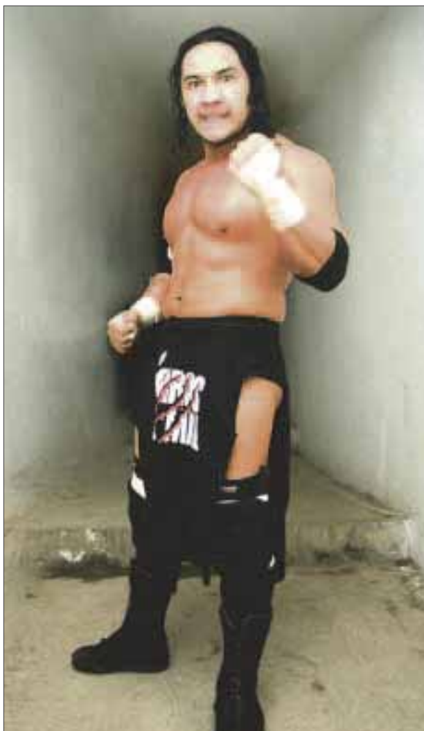
La muerte del Perro Aguayo Jr. por un golpe accidental de parte de Rey Misterio, causó gran polémica el 21 de marzo.