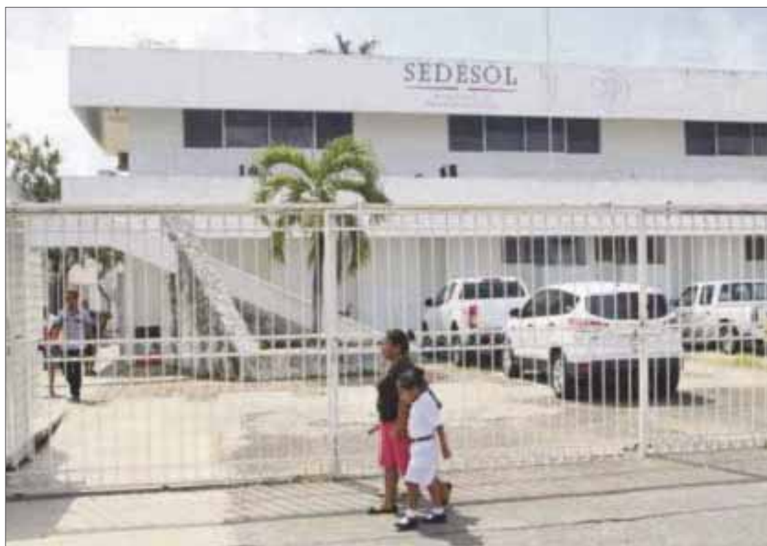
La dependencia dejó de dar viviendas desde el año 2012

Trataba de convencer a la gente con casas que iban a ser construidas en un área que asigne el ejido, y que iban a tener una me-