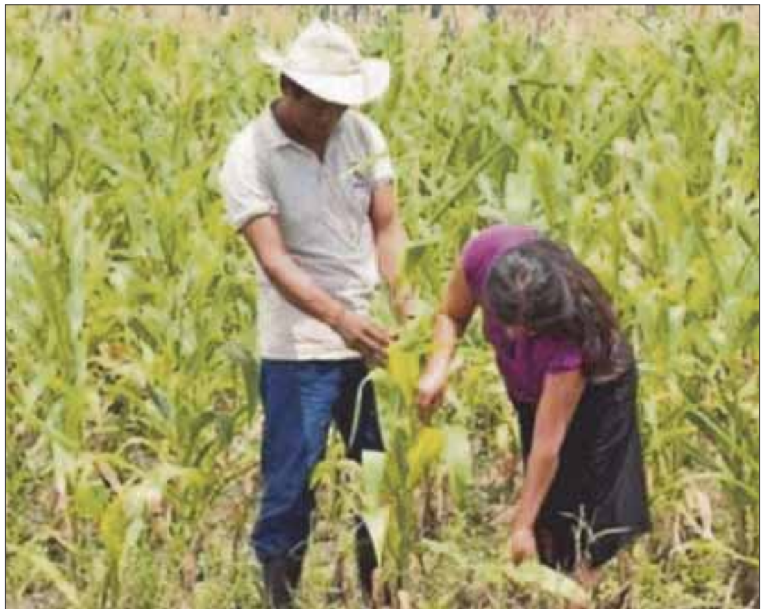
Es fundamental la información directa a los campesinos con respecto a la posible legalización de la producción de esta hierba.

Mencionó que actualmente en el campo se habla de autorizar la siembra y eso podría permitir que los grupos delincuenciales lo aprovechen para engañarlos u obligarlos al cultivo de la cannabis, por ello es fundamental la información directa a los campesinos.