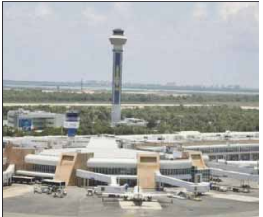
La salvadoreña pretendía viajar de Cancún a Reynosa, Tamaulipas, de donde pasaría por la garita de esa ciudad hacia los Estados Unidos con documentación falsa

La mujer como los menores fueron puestos a disposición del agente del ministerio público del fuero común, en razón de que se trata de actos constitutivos de delitos, sobre todo la documentación apócrifa que presentaron