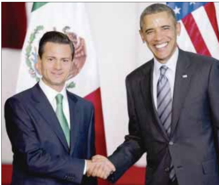
Enrique Peña Nieto y Barack Obama revisarán avances de 2014 y fijarán compromisos para el nuevo año.