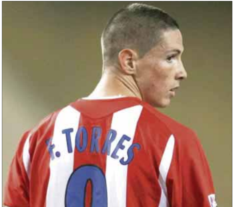
Fernando Torres , quien hace siete años dejó al Atlético de Madrid, fue presentado ayer en un abarrotado estadio Vicente Calderón.

“Estaba yo en un proceso en que me faltaba algo que me ilusionase, algo que sólo podía tener aquí, y el Atlético necesitaba un refuerzo en el ataque. Siempre he estado en contacto con el club, todos luchamos en la misma dirección”, comentó sobre su fichaje en días recientes.