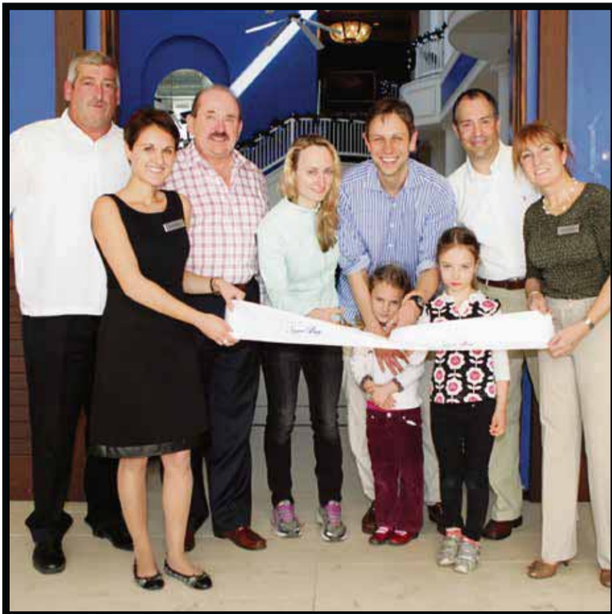
En la apertura del hotel en St. Thomas.