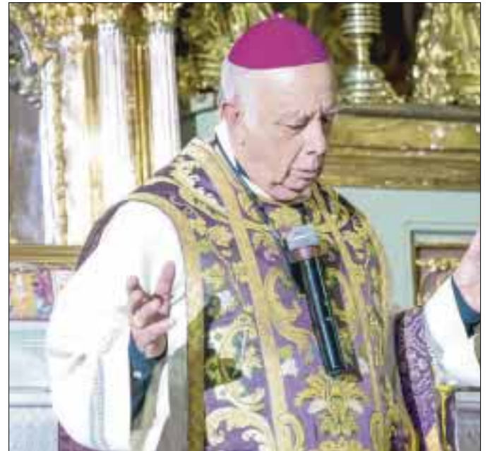
El obispo de Morelia, Alberto Suárez Inda, es nuevo integrante de la lista de Príncipes de la Iglesia.

Sorpresa en lista de Príncipes de la Iglesia