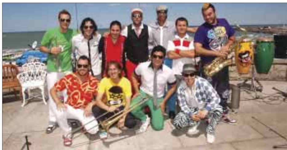
La agrupación ofrecerá como regalo de Reyes su disco "Circologia".