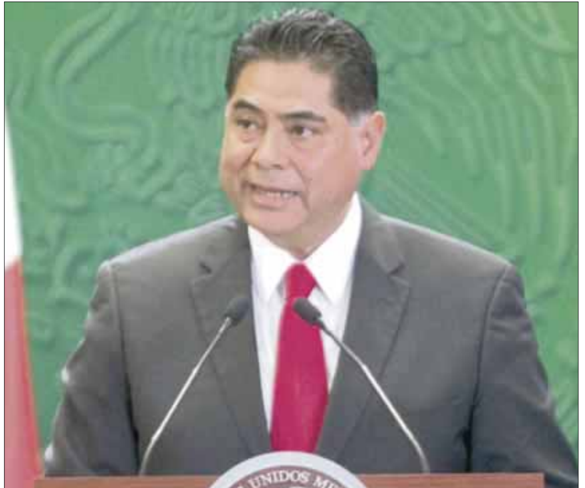
El gobernador Jorge Herrera Caldera se sumó al llamado del Ejecutivo federal para lograr que este 2015 sea un año de unidad.

Además, con la reforma de telecomunicaciones por primera vez las llamadas nacionales de larga distancia se cobrarán como si fueran locales, lo que significará importantes ahorros y mayor acercamiento entre las familias y sus seres queridos