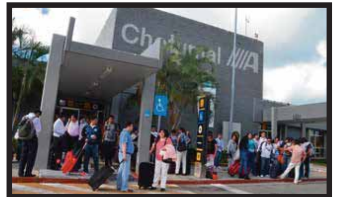
AUMENTA LA LLEGADA DE TURISTAS al estado con una mejor conectividad aérea.

estado ha logrado negociaciones con aerolíneas para la llegada de más vuelos de compañías como Cónдор, en la ruta Munich-Cancún, con un vuelo semanal en equipo B767-300, a partir de la temporada... >5