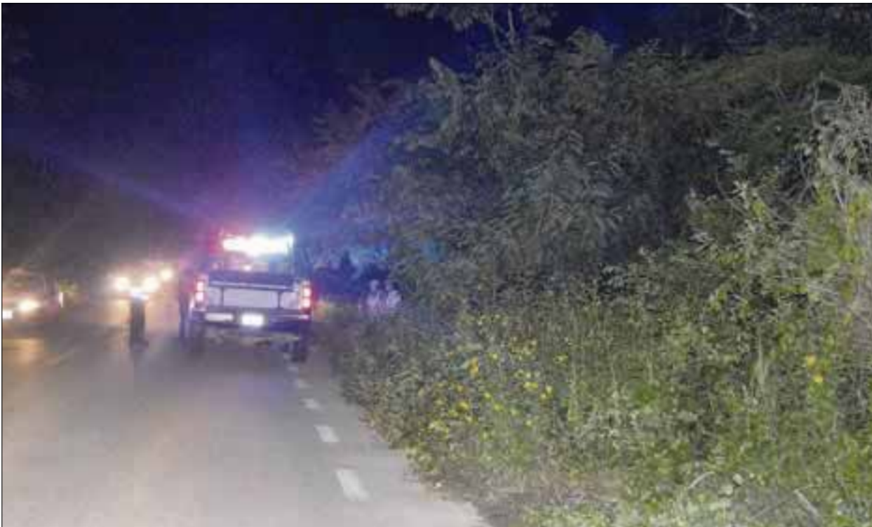
Tapado del rostro y atado de pies y manos fue encontrado el cadáver en la zona maya.