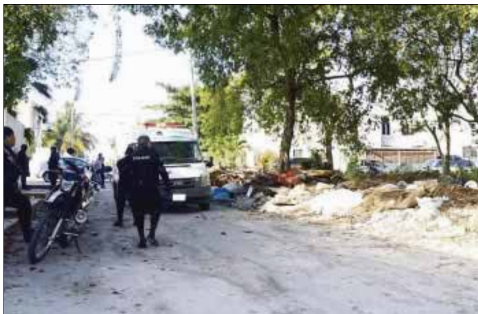
La policía busca en hospitales a alguna mujer que pudiera haber ingresado por aborto las últimas horas.