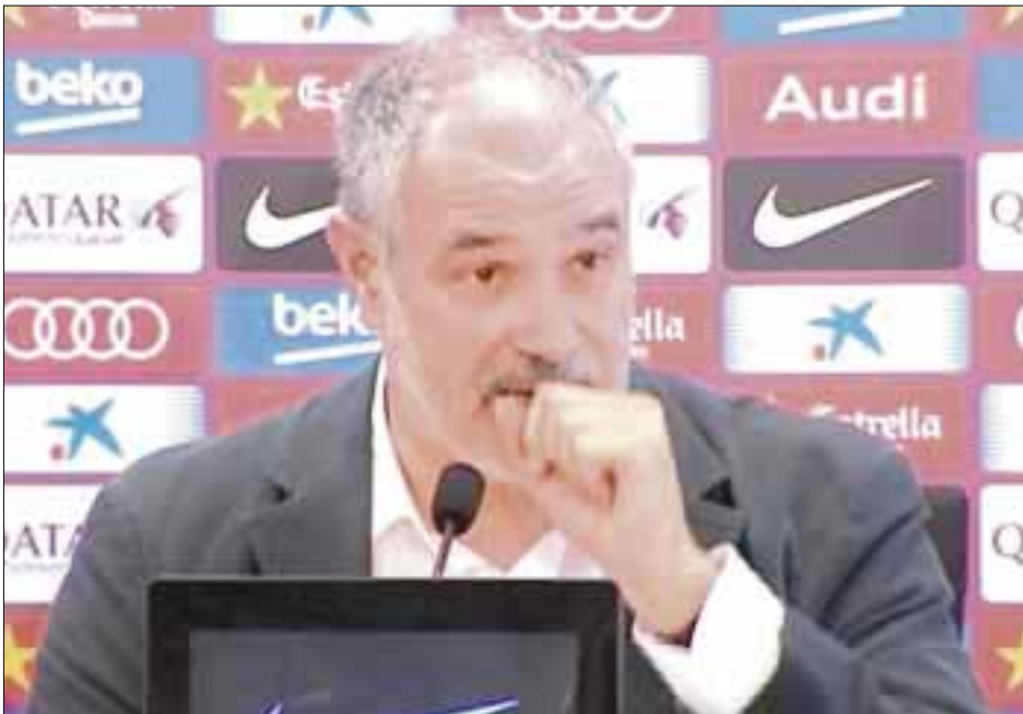
Andoni Zubizarreta dejó de ser director deportivo del club Barcelona.