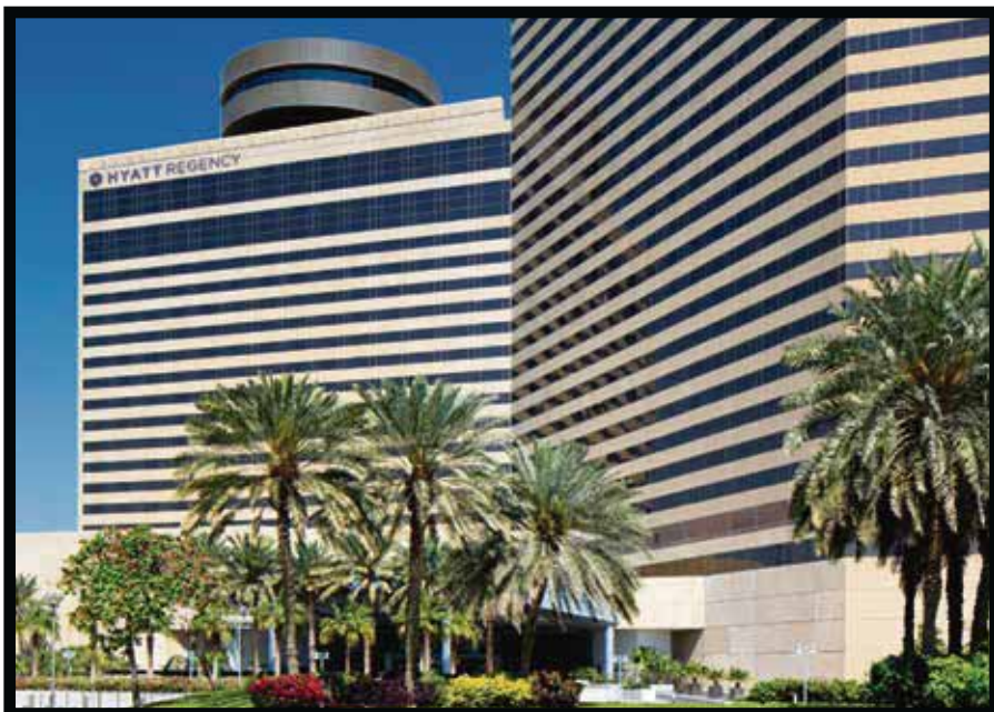
Hyatt, en Dubai.

☆☆☆☆☆ Algunas cadenas hoteleras se están convenciendo de la importancia que hoy por hoy tiene la conectividad y, Hyatt Hotels Corporation anunció sus planes para ofrecer Wi-Fi gratuito en