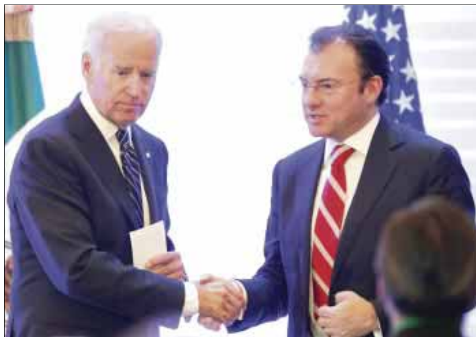
Luis Videgaray y Joe Biden participaron en la segunda reunión del Diálogo Económico de Alto Nivel.

tario de Biden sobre el papel de las burocracias, Videgaray señaló que la situación en México no es más fácil que en Estados Unidos y destacó por ello la importancia de que haya liderazgo al más alto nivel para concretar los proyectos.