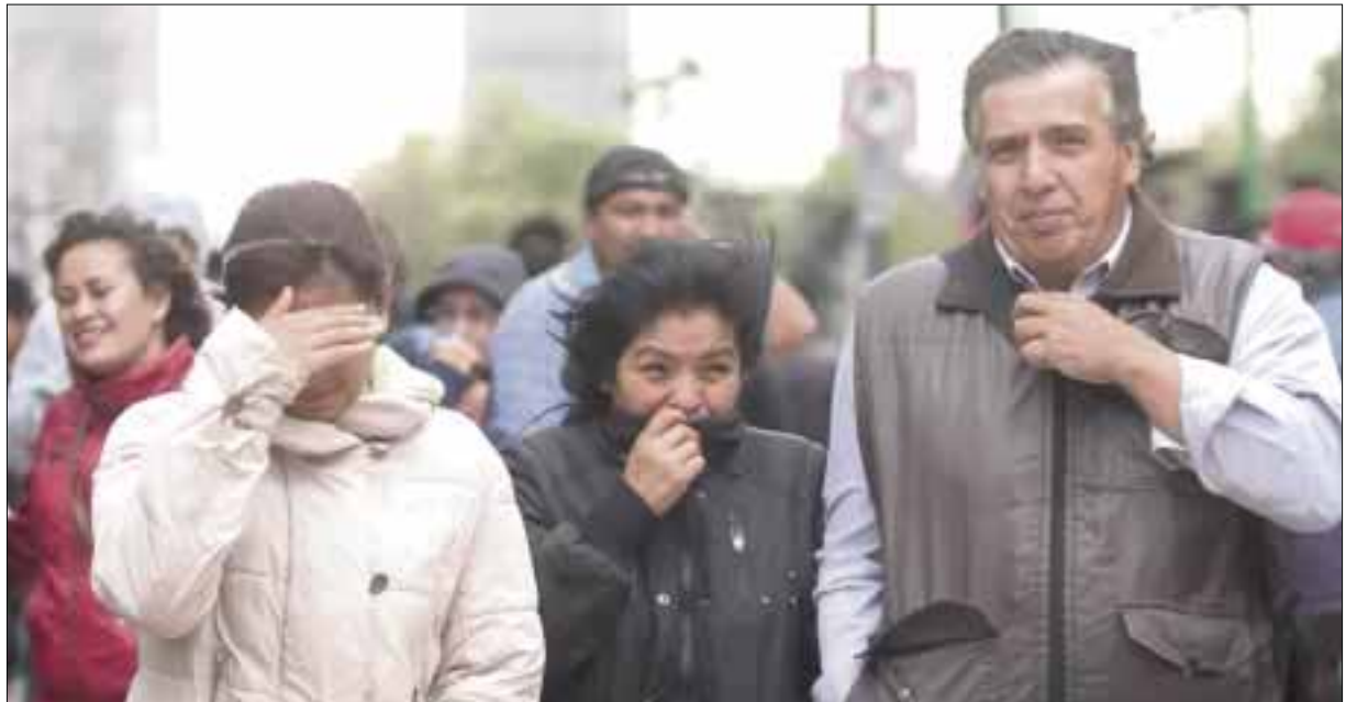
Hay que ponerse ropa abrigadora, pues continuará el clima gélido.

Su madre difundió la imagen de la joven con sus características, y comenzó a circular rápidamente en las redes sociales.