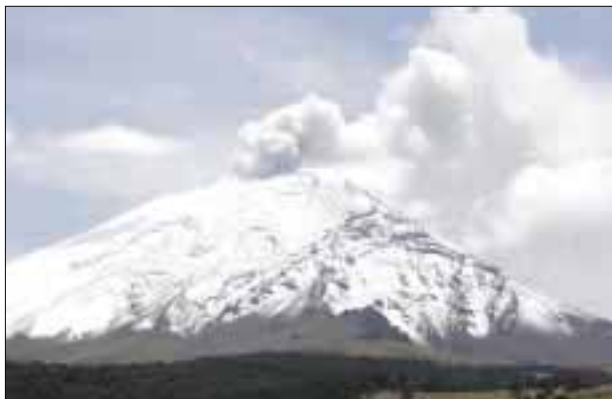
El volcán Popocatepetl emitió ayer 43 exhalaciones acompañadas de vapor de agua, gas y ceniza.

de lodo de corto alcance. El organismo dependiente de la Secretaría de Gobernación (Segob) reiteró que continúa el tránsito controlado entre Santiago Xalitzintla y San Pedro Nexapa, vía Paso de Cortés, así como la restricción del radio de seguridad de 12 kilómetros.