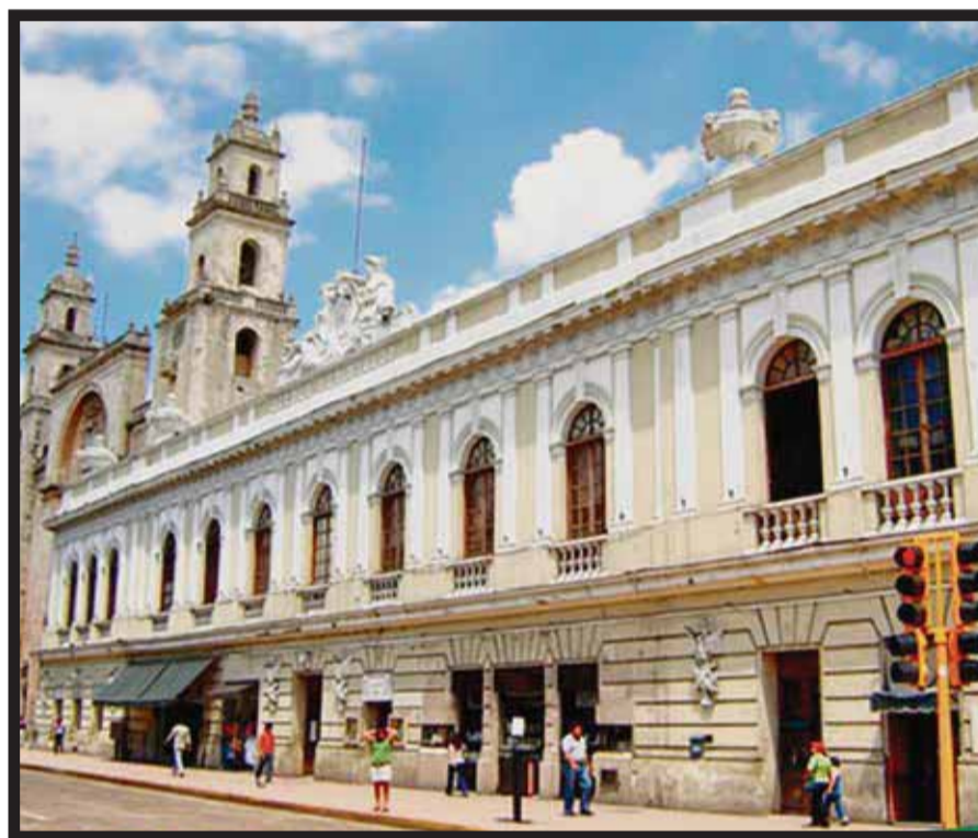
Mérida, Yucatán, sede del Simposio sobre Patrimonio Cultural.

"Estamos construyendo nuestro proyecto de la primera terminal internacional para brindar a los ciudadanos y visitantes de Houston, así como a nuestros clientes en vuelos de conexión, un valor excepcional y nuestro legendario Servicio al Cliente en mercados interna-