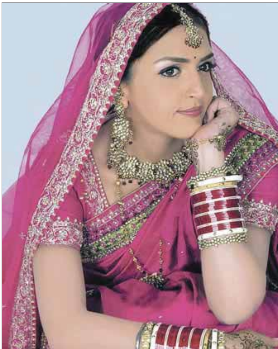
La actriz Esha Deol embelleció la conferencia de prensa, donde se dio a conocer la Bollywood Week Cancún.