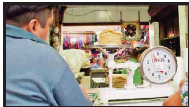
LOS INDUSTRIALES DE LA TORTILLA afirman que no subirán precios por el momento.

tos registrados este inicio de año los tendrán que absorber los dueños de las tortillerías. Expresó que lamentablemente iniciaron un año difícil con la "cuesta de enero" que... >5