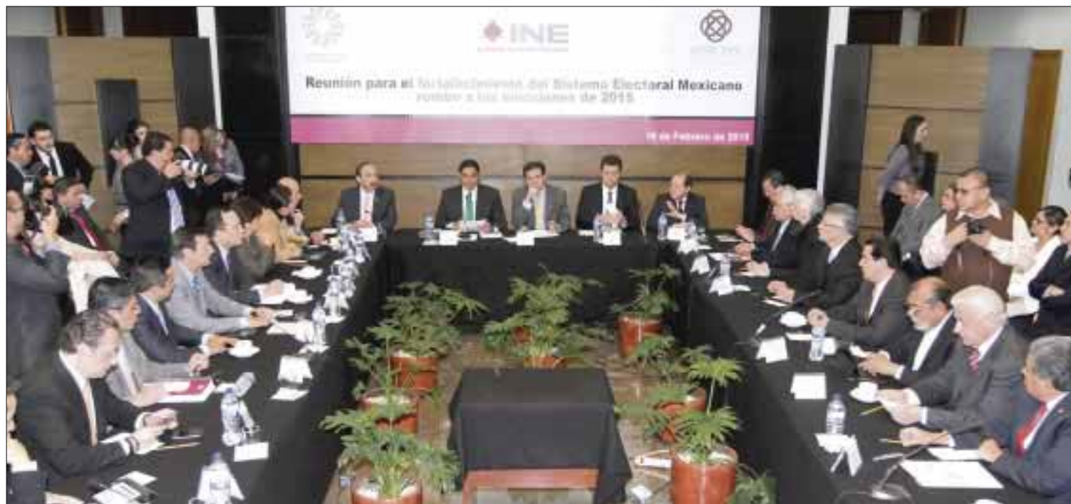
Jorge Herrera Caldera , presidente de la Conago, llam  a las fuerzas pol ticas y a los mexicanos a “que asumamos nuestro papel y que dirimamos las diferencias por la v a institucional”.

Sobre la intervenci n de los gobernadores en el proceso electoral, el presidente de la Conago afirm  que con las nuevas reglas del INE se garantiza equidad y transparencia, “y que se lleven cabo las elecciones en paz y tranquilidad”.