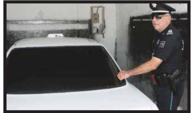
INICIÓ EL RETIRO DE VIDRIOS POLARIZADOS de los cristales de taxis, en beneficio de usuarios.

Valdepeña; se acordó una sanción económica para operadores y propietarios de taxi que violen a esta disposición, ya que de 7 mil unidades de taxi, un 90 por ciento cuenta con vidrios... >5