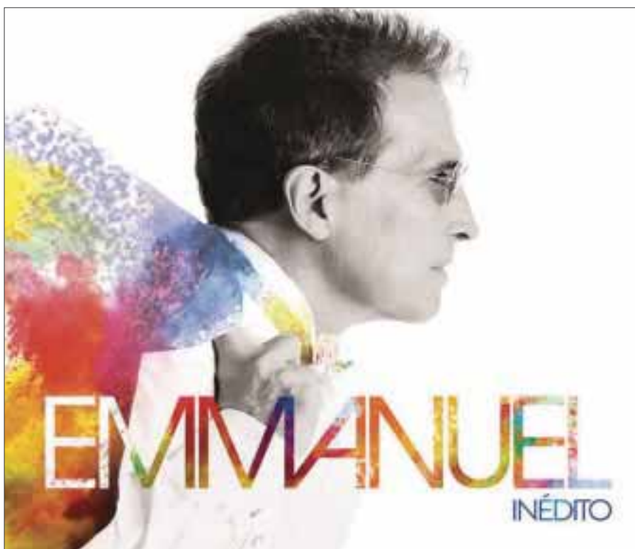
Emmanuel anunció que le gustaría presentarse con su nuevo disco en el Festival de Viña del Mar.