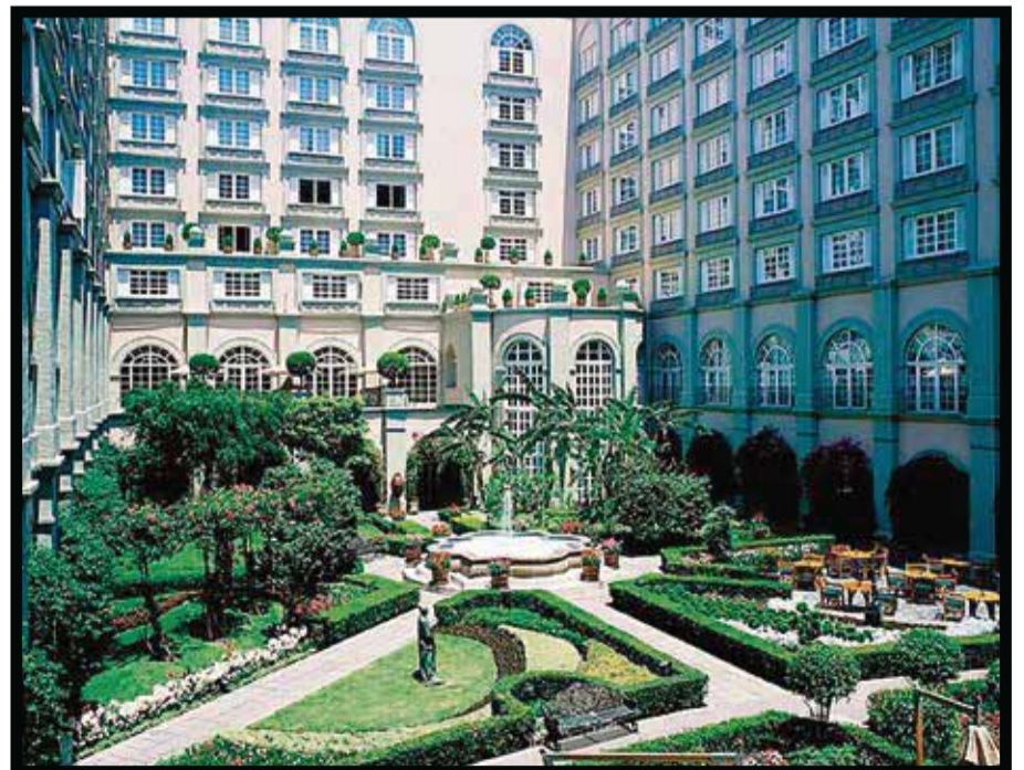
Es el número 16 dentro de los mejores 20 en el mundo.