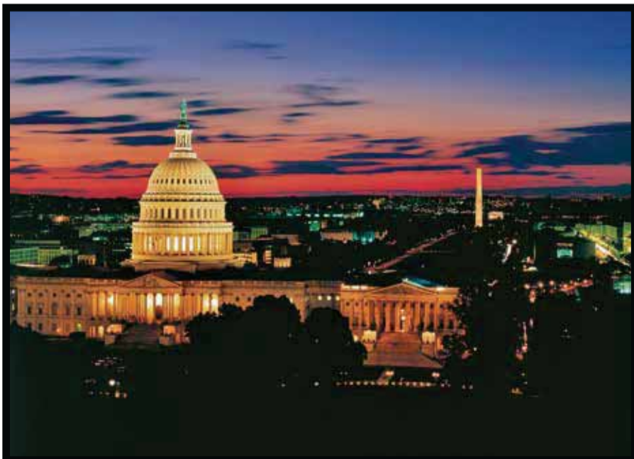
El Capitolio, en Washignton.

El mapa mejorado cuenta con vistas miniatura de imágenes compartidas en Instagram , tanto por los viajeros, como por los socios de Brand USA , mismas