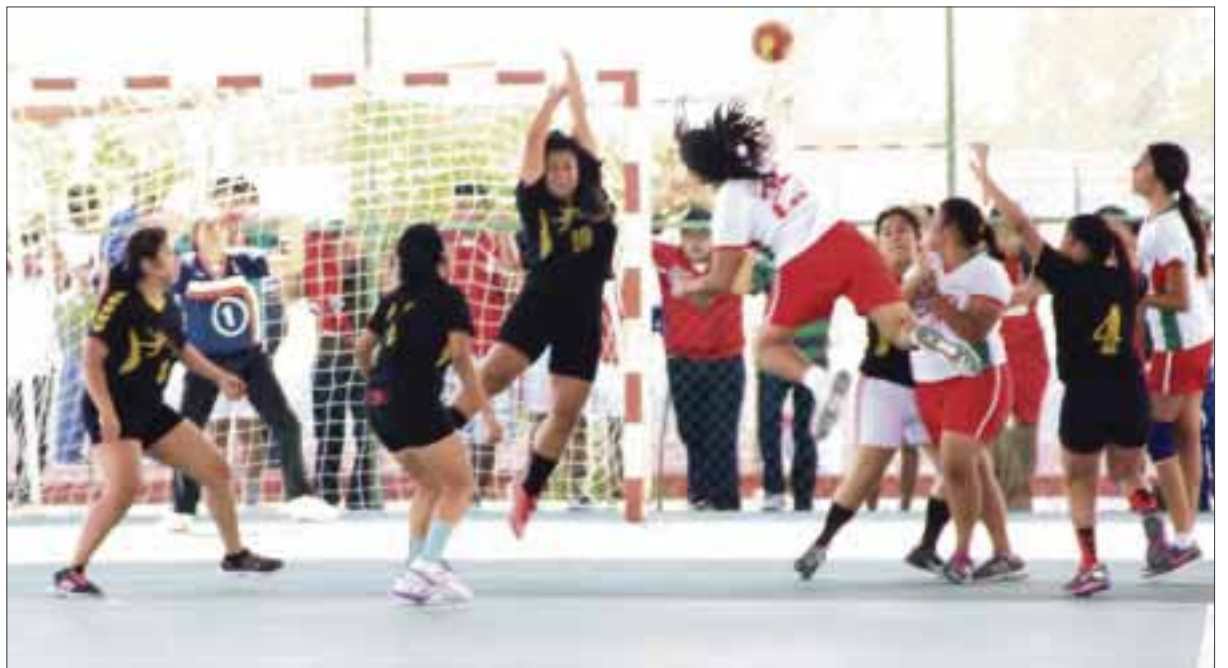
Los duelos fueron de alarido, tanto que en varios se tuvieron que ir a tiempos extras.

po de Isla Mujeres hizo lo propio en los varones. En lo que respecta a la categoría juvenil menor los ganadores del estatal fueron los dos equipos de Isla Mujeres tanto en la femenil como en la varonil, finalmente en la categoría juvenil superior Benito Juárez se llevó los honores en la femenil y el conjunto de Isla Mujeres en la varonil para de esta forma cerrar con 3 campeonatos para Cancún y 5 para Isla Mujeres. Ahora los equipos de handball de Quintana Roo deberán conformarse con los mejores jugadores de la entidad para encarar la justa regional que se realizará en Yucatán del 20 al 22 de febrero.