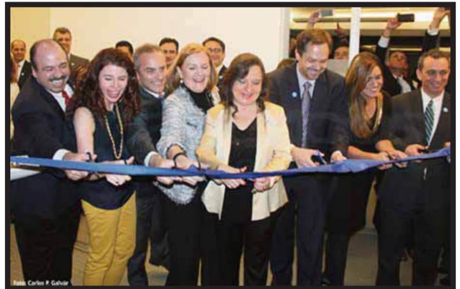
En la inauguración de las oficinas de United.

De acuerdo con estimaciones de la Secretaría de Turismo, México podría rebasar los 30 mil turistas este año. Si bien el Aeropuerto Internacional de Cancún permite conectar con 23 destinos nacio-