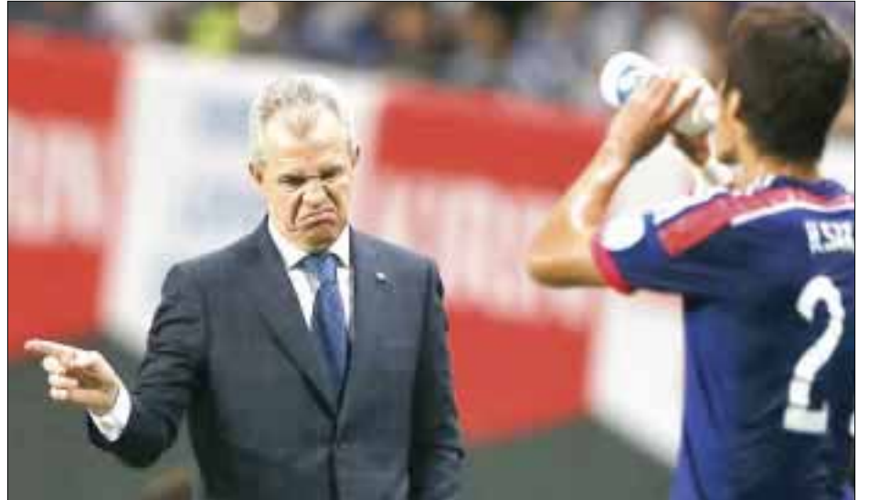
Javier Aguirre se encuentra inmerso en otro escándalo en España, ahora se le relaciona en un segundo caso de amaño.

“Son ciertas las salidas de dinero que pueden no estar demasiado bien justificadas, un millón y medio de euros salieron de forma extraña en dinero contante y sonante, pero no podemos hablar de compra de partidos.”