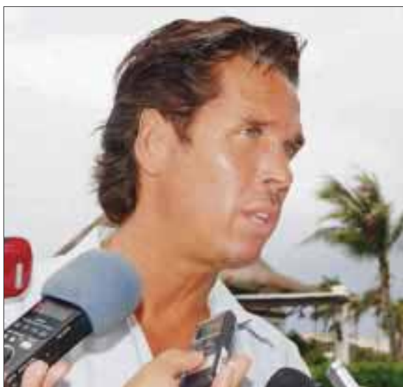
Roberto Palazuelos Badeaux