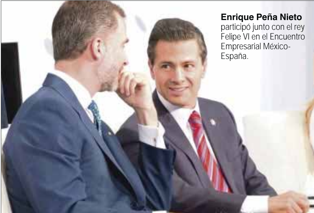
Enrique Peña Nieto participó junto con el rey Felipe VI en el Encuentro Empresarial México-España.

Destaca la alianza estratégica entre México y España