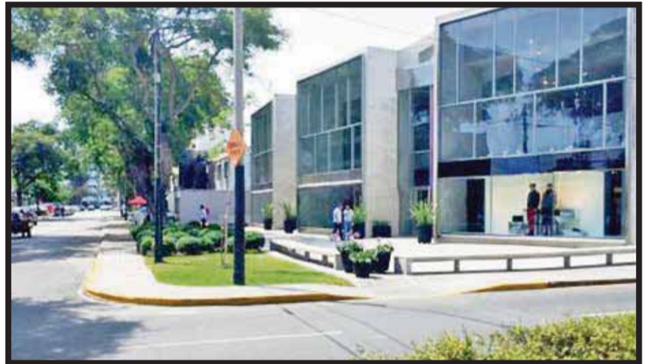
La Avenida El Bosque se convertirá en la primera calle de lujo en Perú.

“Escuchamos a nuestros clientes y gracias a eso seguimos creciendo y conectando de forma aérea a todo México. Ahora Cancún está co-