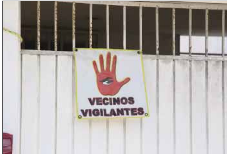
Los vecinos de la región 507 se organizan bajo el lema "vecino vigilante", para evitar más robos en sus casas.

Sin querer entrar en detalles de cómo funciona su sistema de alerta vecinal, Manuel dice que no están copiando ningún modelo de autodefensa de otros estados o municipios, aunque reconoció que se encuentran hartos de tantos robos.