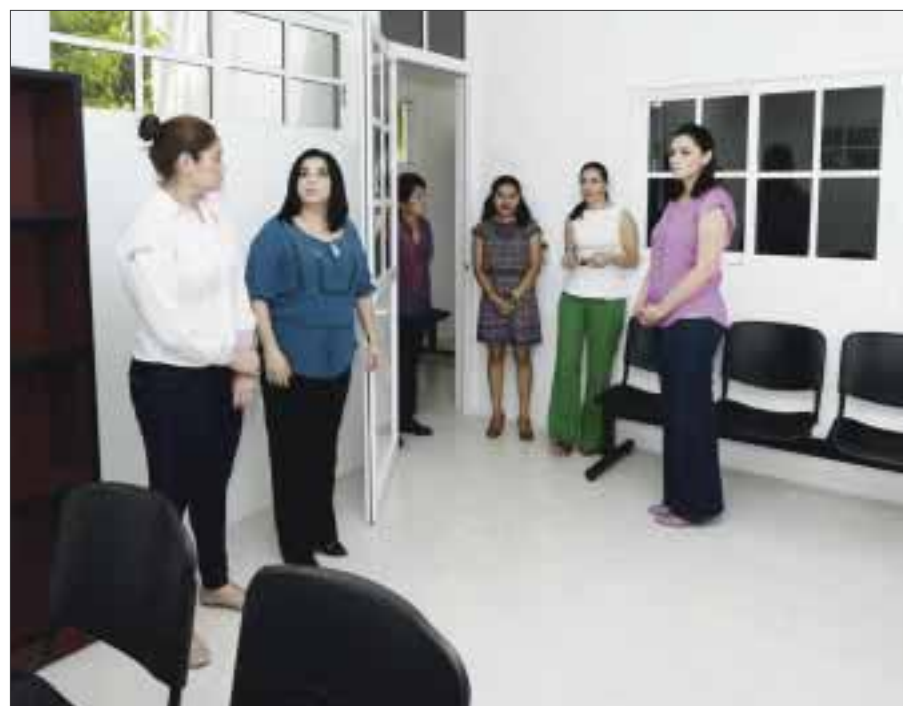
La presidenta del DIF Quintana Roo recorrió las instalaciones y explicó que también se dará atención a niños y adolescentes de los 10 municipios de la entidad.