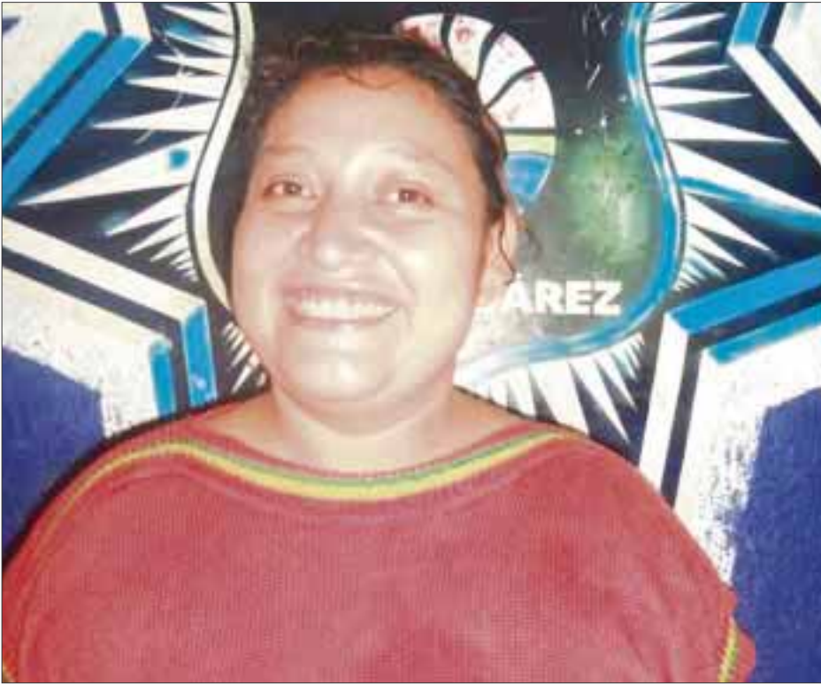
“Madrina” de la Judicial protagoniza escándalo en la López Portillo y agrade a policías preventivos.