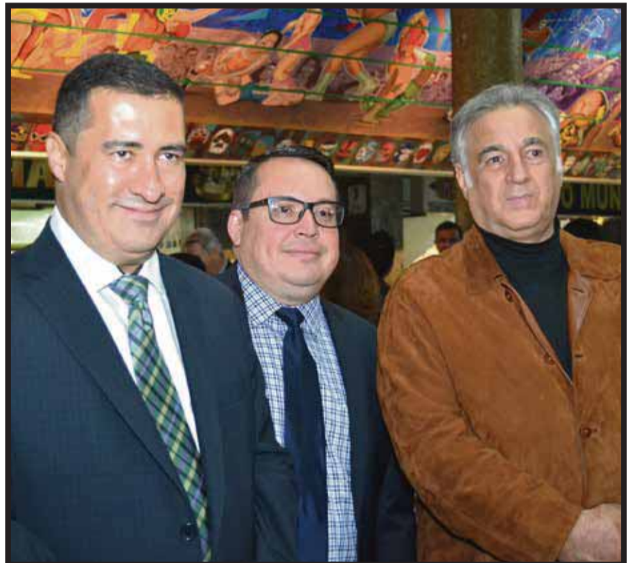
Durante la celebración de XV años del Turibús.

☆☆☆☆☆ Con el programa El Encanto de Tailandia, en el que se presentarán danzas de la Corte Real se celebrará el 40 Aniversario de Relaciones Diplomáticas entre México y Tailandia.