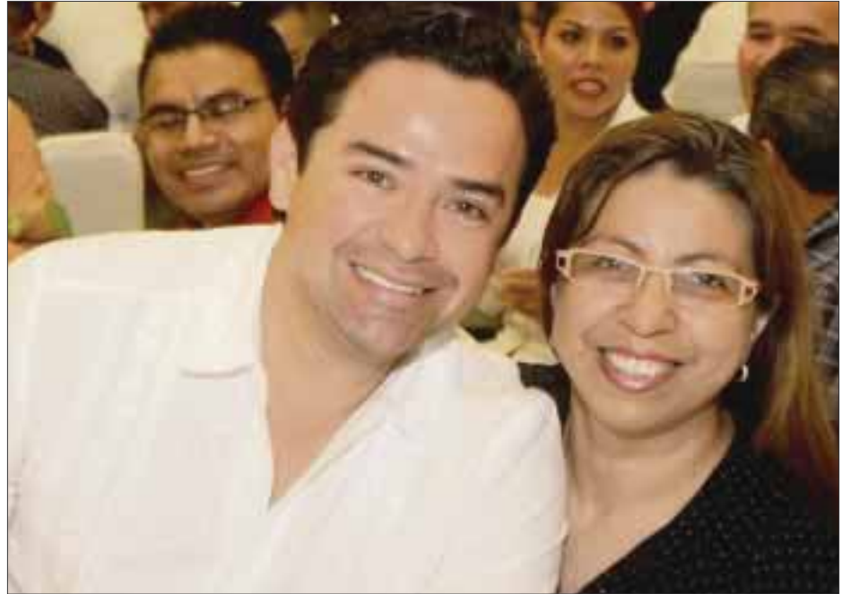
La promoción turística ha llevado a Quintana Roo a ser el líder nacional en la industria sin chimeneas.