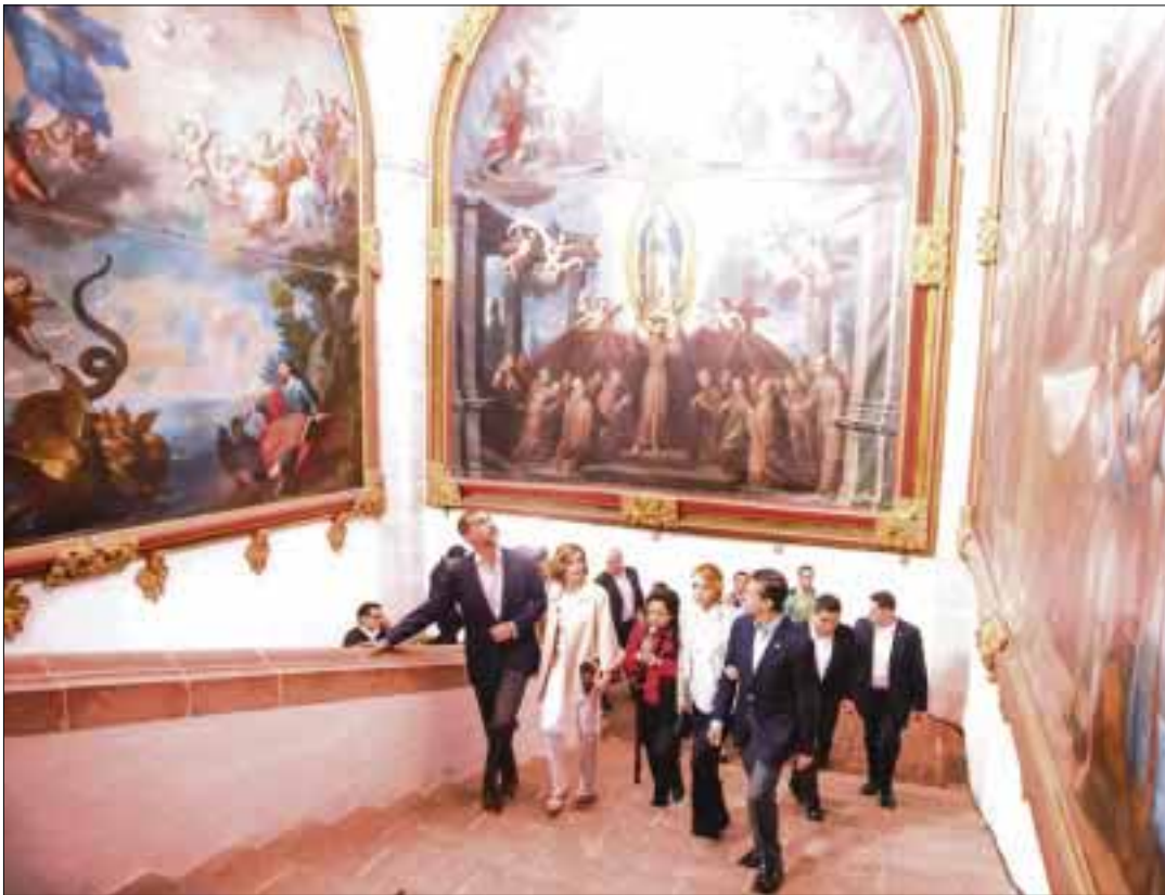
Los reyes de España, acompañados del presidente Enrique Peña Nieto y su esposa, recorrieron el Museo Virreinal, en Guadalupe, Zacatecas.