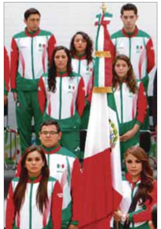
El secretario de Educación, Emilio Chuayffet, abanderó a la delegación mexicana que participará en los Juegos Panamericanos Toronto 2015.

“Un atleta de alto rendimiento es una persona que vive prácticamente al 100 por ciento de su tiempo por el deporte, es un deportista que representa a su nación y, en este caso, ustedes lo harán por México”.