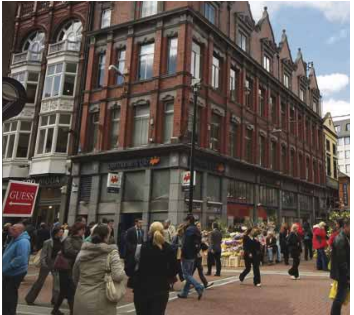
Los turistas irlandeses ahora cuentan con paquetes de bodas en las playas de Quintana Roo, que son el nuevo atractivo.

Borge Angulo dijo que en los últimos 10 años se ha tenido un incremento de 145 por ciento en el número de irlandeses que viajan a México y este vuelo podría aumentar más el número.