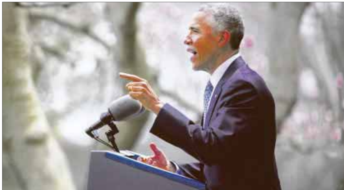
Barack Obama pidió además al Congreso “escuchar a los estadounidenses” y levantar el embargo comercial sobre Cuba.

Aunque el mandatario no aludió fechas en su breve anuncio, ambos gobiernos establecieron este próximo 20 de julio para estas reaperturas en las car-