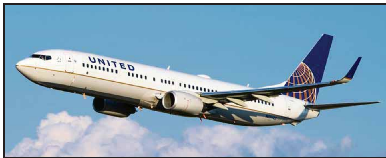
United y Azul se unen e integran alianza estratégica.

Permitirá a ambas aerolíneas agilizar el proceso de transbordo en el aeropuerto Guarulhos, a fin de que pasajeros y equipaje hagan conexiones más expeditas. Las líneas aéreas anunciaron que sus planes contem-