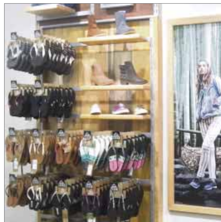
También disponible para mujeres.