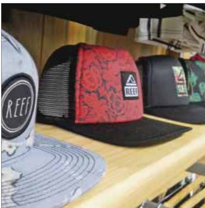
Además de sandalias, ofrecen diferentes productos.