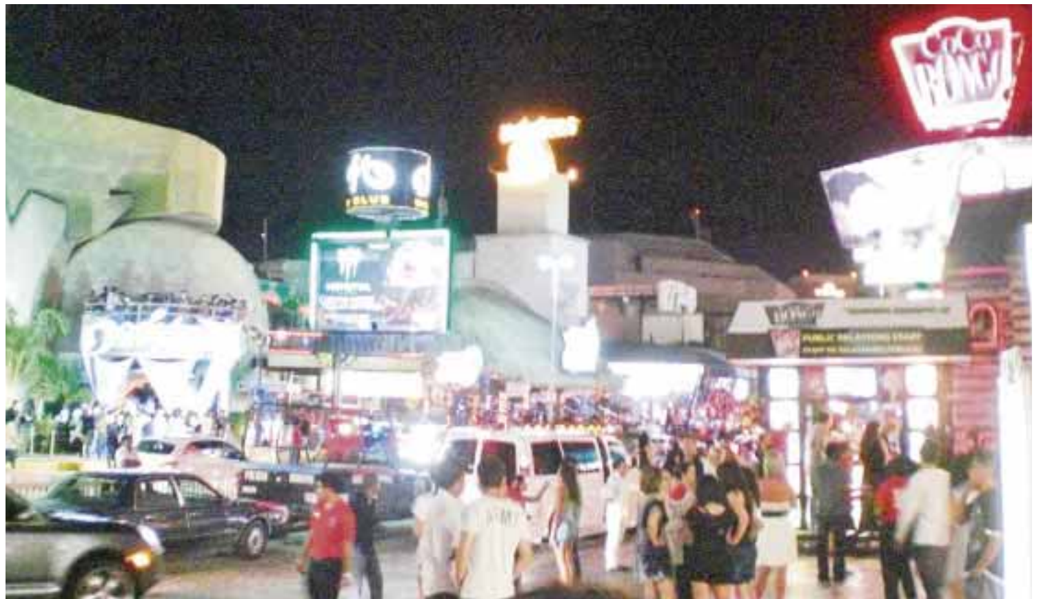
Bares del primer cuadro de la ciudad son los más frecuentados por jóvenes que no van a la zona hotelera en estas fechas.

Asimismo, se expuso que personal de apoyo de la secretaría participó en revisiones a personas con mochilas, canguros y bolsas de mano "sin encontrar alguna novedad".