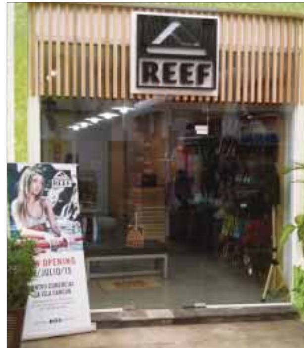
El nuevo local de la isla.