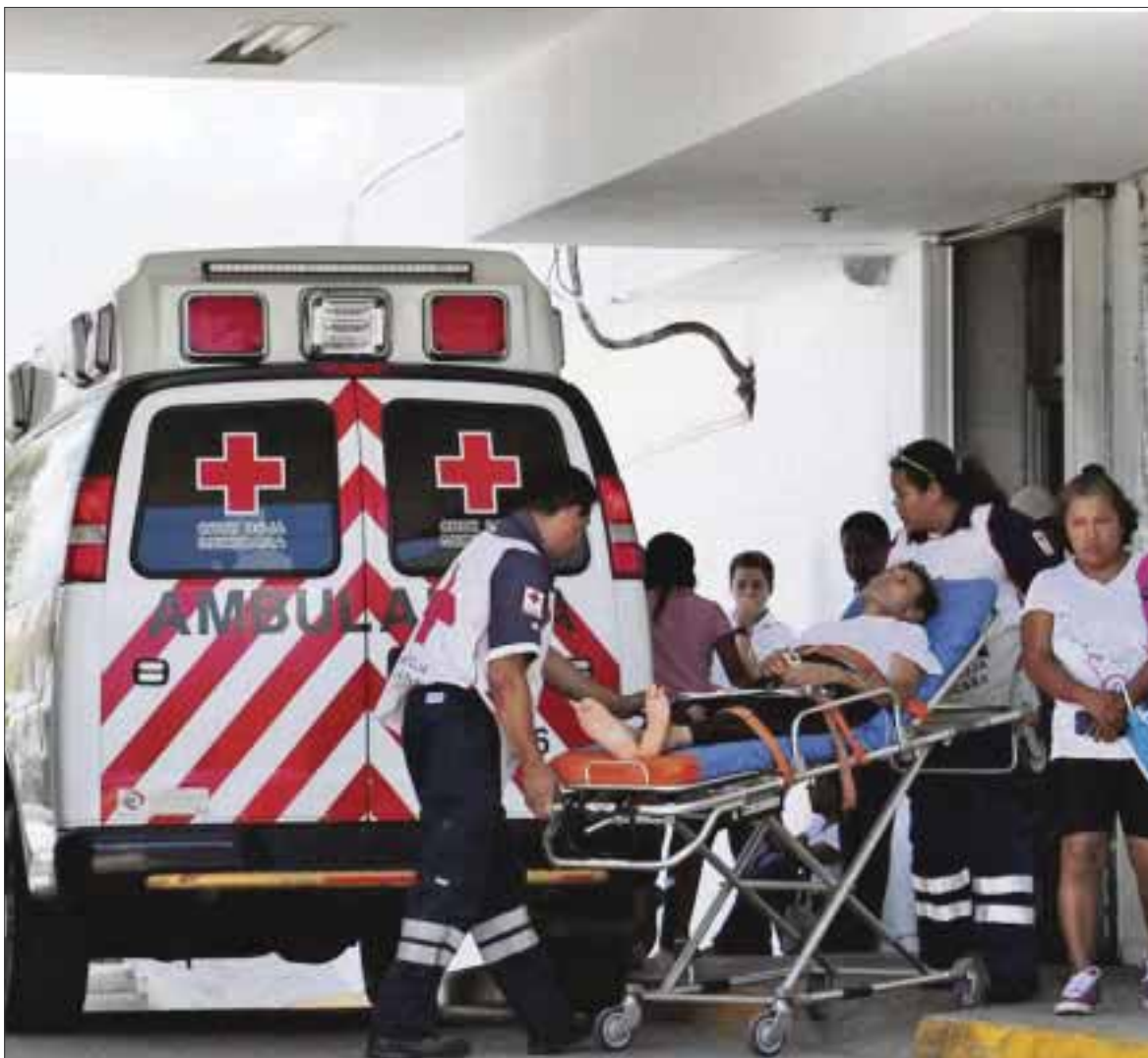
Siguió a su ex pareja para tomarle fotos cuando degustaba con unos amigos.

Los agentes recogieron 2 casquillos calibre 45 en el lugar, por lo que en un principio se pensó que podría tratarse de un asunto relacionado con la venta de enervantes en la zona de bares; sin embargo, con la declaración del lesionado, aquella línea de investigación queda descartada.