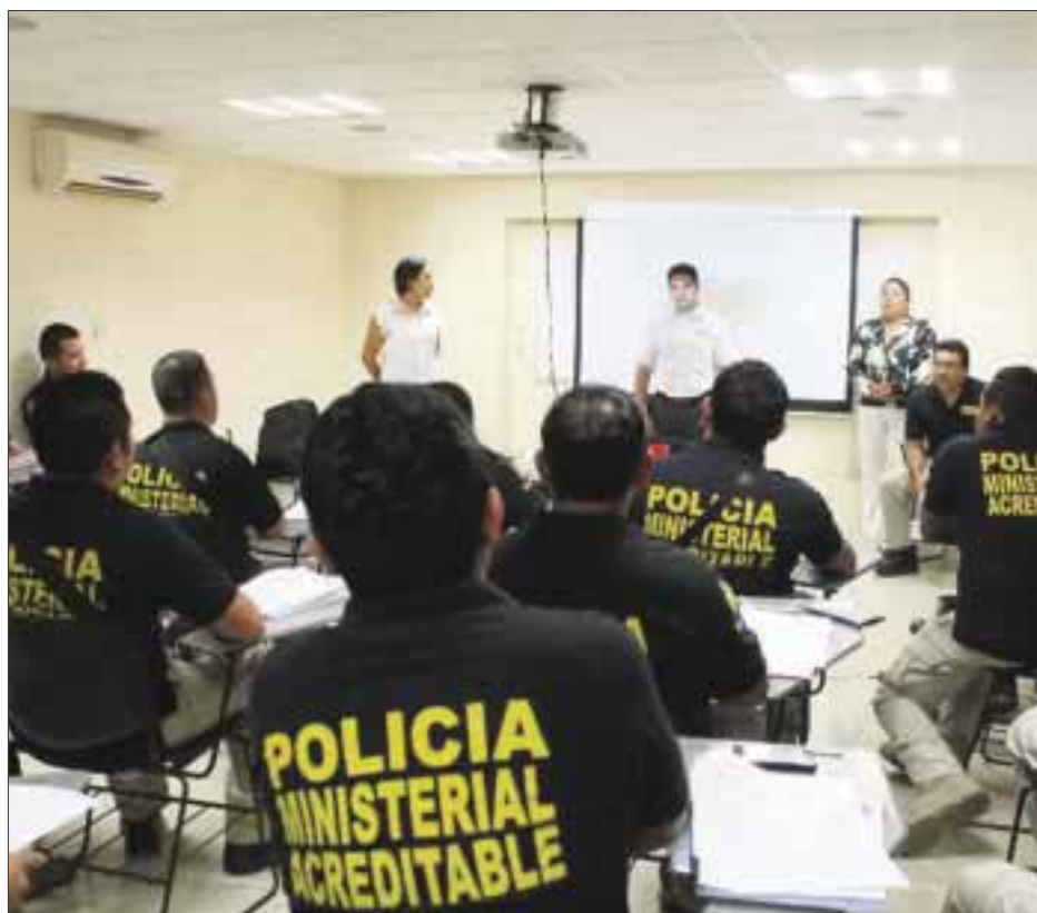
El taller inició el 8 de junio y finalizó el 4 de julio y se llevó a cabo en las instalaciones centrales de la Procuraduría General de Justicia en la capital del estado.

El lesionado refirió que al descubrir a la fémina, quien al parecer también estaba degustando con otros sujetos, él la empezó a seguir para tomarle una foto con el celular