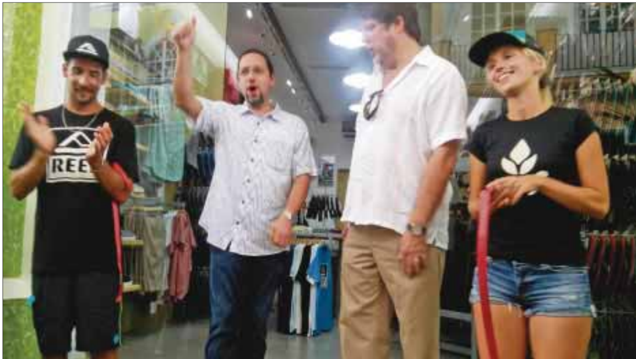
Directivos hacen la apertura.

La promoción de eventos deportivos playeros también es importante para la marca, ya que además de ser patrocinador espera crear empleos para los quintanarroenses.