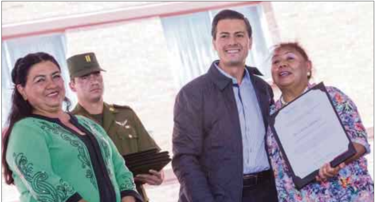
El presidente Enrique Peña Nieto entregó obras de rehabilitación y mantenimiento en 10 unidades habitacionales del Distrito Federal.

Otro dato de Coneval que destacó el primer mandatario es que en este mismo periodo un millón 740 mil personas más cuentan con seguridad social, con lo que tienen ac-