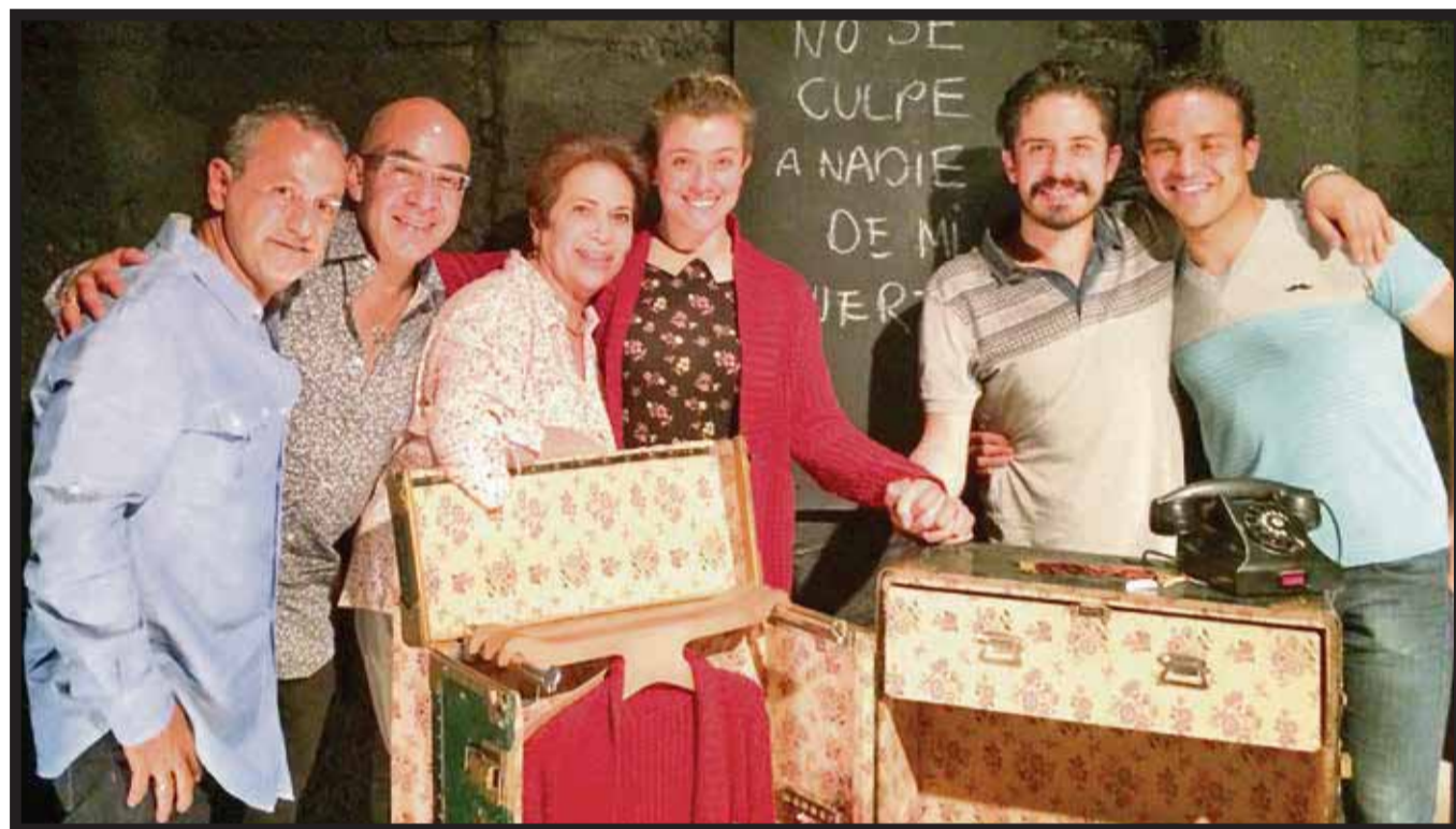
Al finalizar la temporada de "Que no se culpe a nadie de mi muerte".

Al empezar su actuación aparece en escena con un teléfono de aquellos que tenían una esfera con agujeros para que al colocar el dedo se pudie-