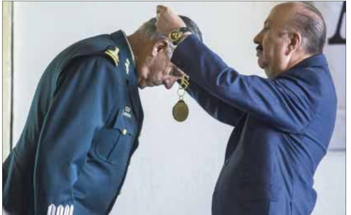
El general Salvador Cienfuegos Zepeda fue condecorado por la gran orden de la Reforma en grado de collar por parte de la Academia Nacional.

con las fuerzas armadas para enfrentar los grandes retos de México, entre ellos el crimen organizado y los intereses de quienes quieren destruir a México.