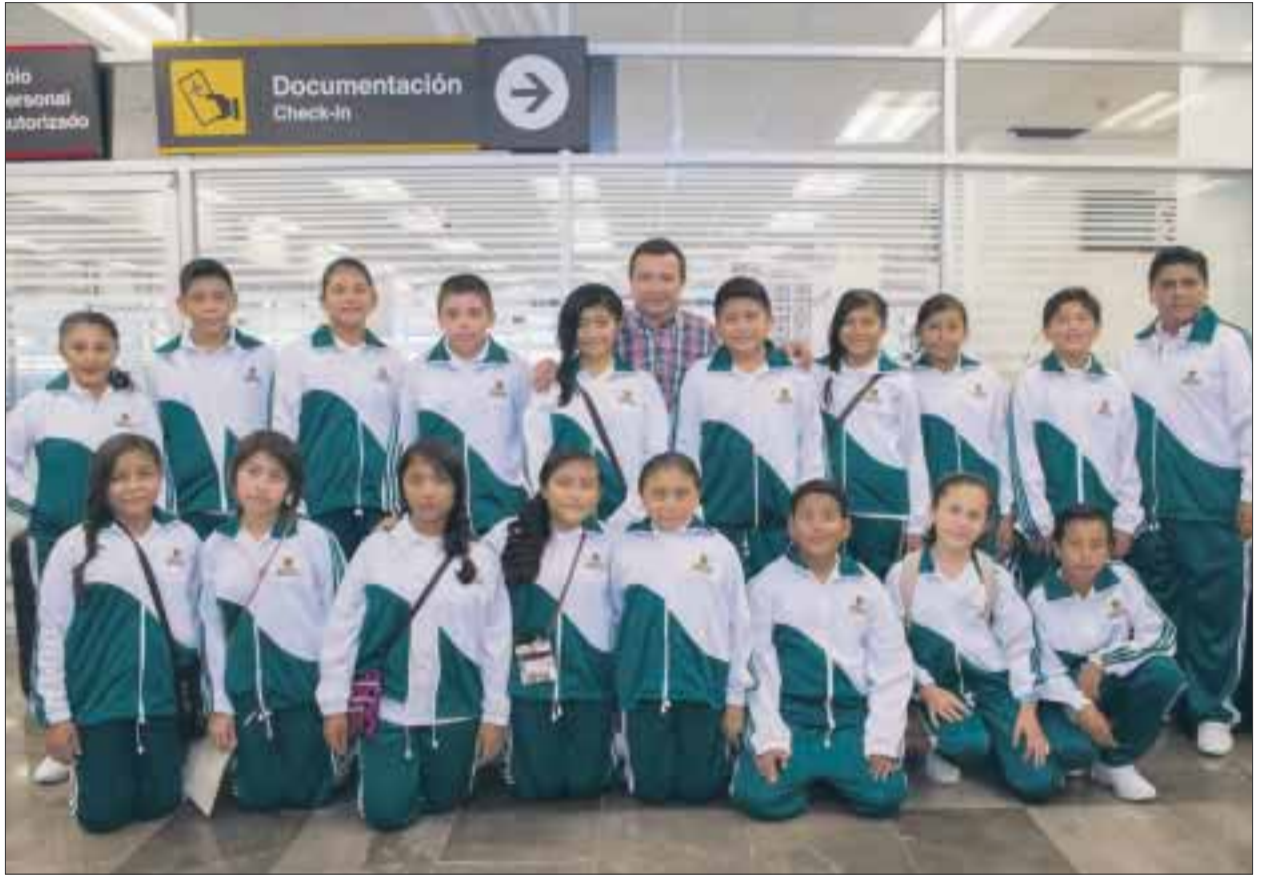
Los mejores 16 estudiantes del estado disfrutaron de la ciudad de México.

El miércoles participarán en un evento de la Fundación BBVA-Bancomer en la Sala Nezahualcóyotl, posteriormente, en la sede que les corresponde disfrutarán de la proyección de una pe-