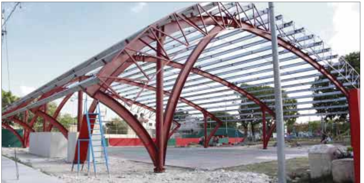
El Parque de los Gigantes, ahora podría llamarse “el parque de los ladrones”, ya que por la falta de luz, se registran constantes robos a transeúntes.

Referente a los robos dijo que las personas que se aventuran a pasar por en medio del parque a una hora de la noche, saben que pueden encontrarse con algún maleante.