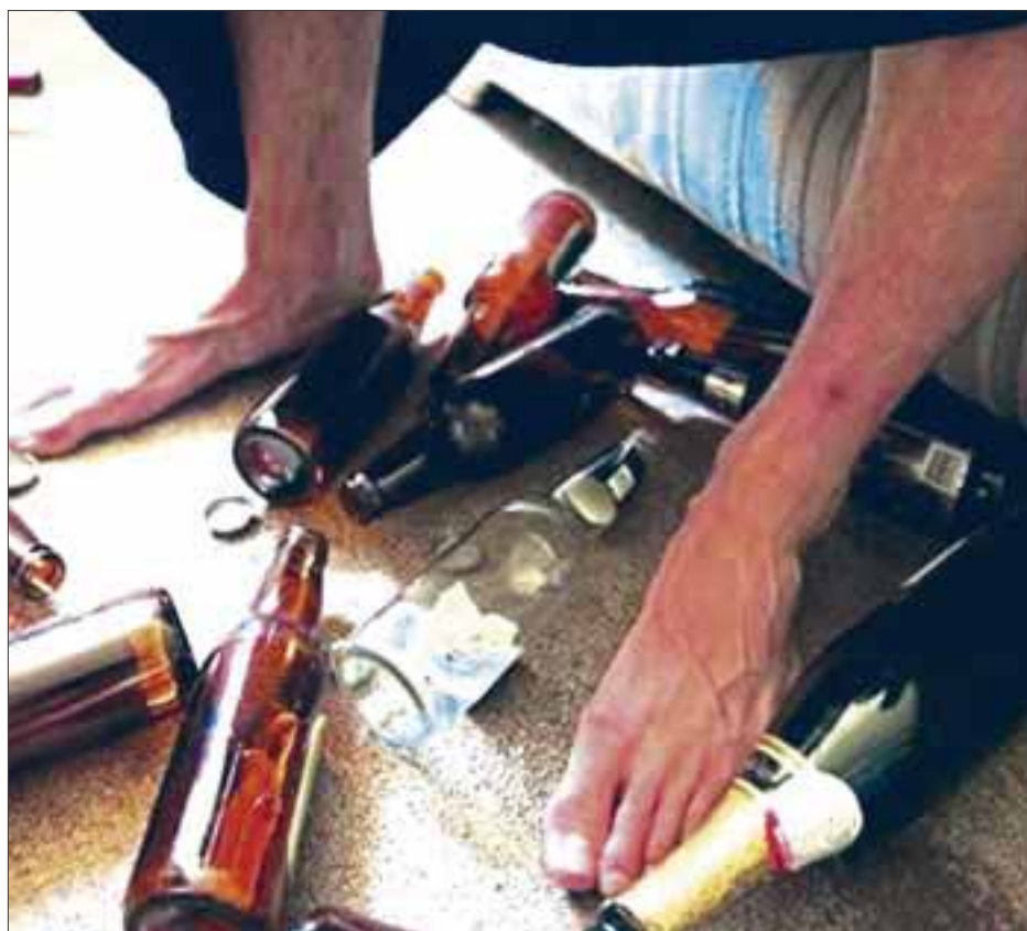
En Benito Juárez mil 300 personas acuden a recibir atención psicológica, el ocho por ciento de los pacientes presentan adicción a drogas y al alcohol.