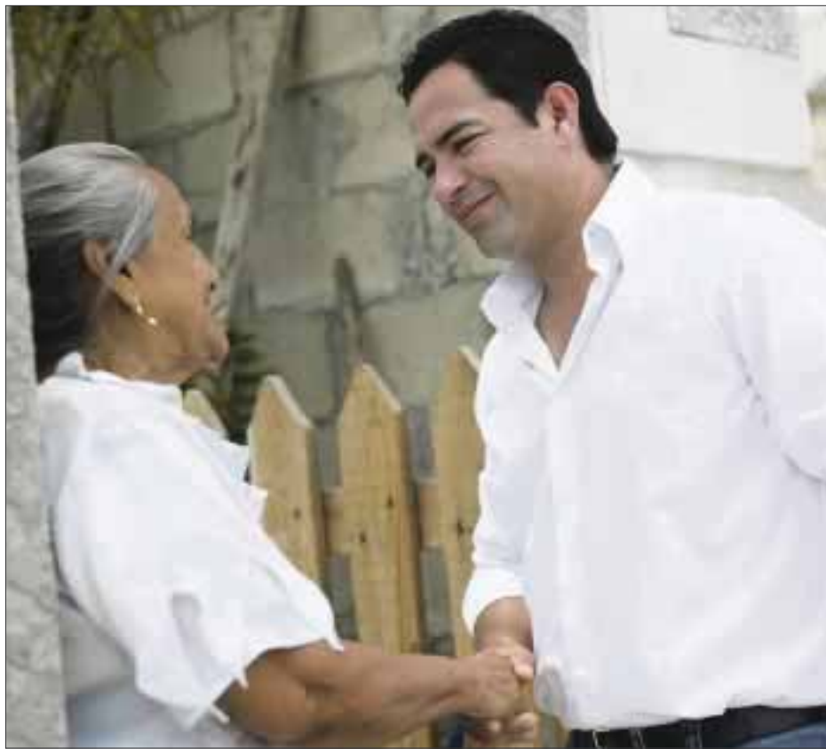
Hoy celebra su aniversario el segundo municipio en importancia económica del estado.

“Gobiernos y legisladores continuaremos trabajando juntos para que Solidaridad siga siendo uno de los fuertes motores de Quintana Roo. Debemos trazar el rumbo de los próximos años, nos toca consolidar en unidad una ruta que garantice la calidad de vida para quienes estamos hoy y quienes habitarán el día de mañana”, concluyó.