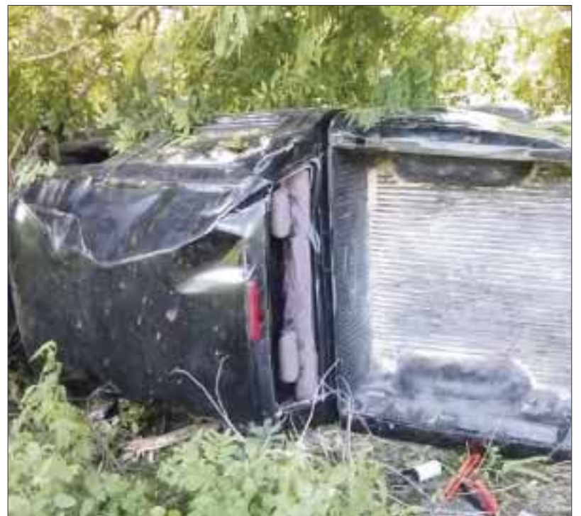
La camioneta Ranger quedó volcada y las pérdidas materiales son cuantiosas.

rebasó golpeándolo levemente y por el exceso de velocidad a la que iba, perdió el control del volante.