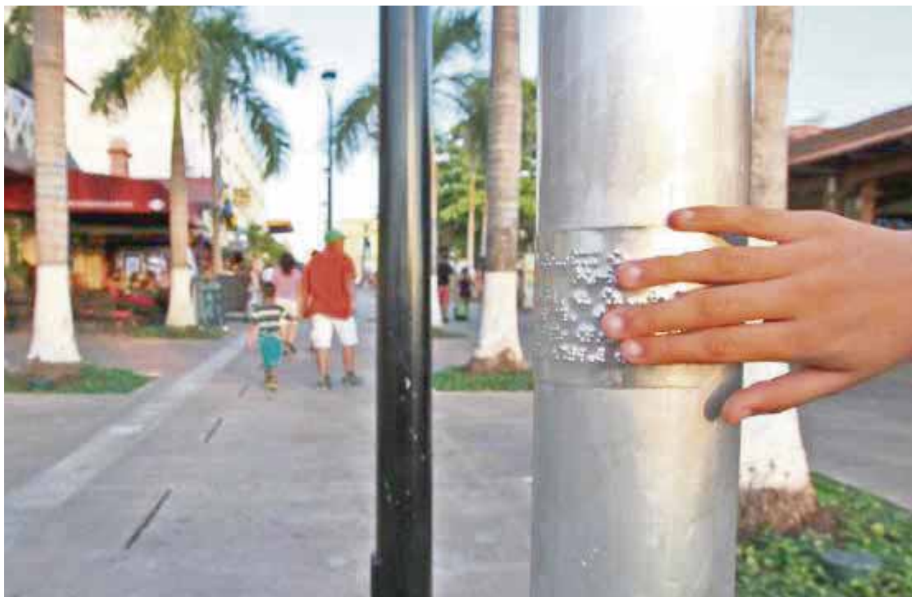
Los postes son de aluminio, mientras que la señal es una película que se encuentra con una placa del mismo material.

Refirió que las señales fueron instaladas en seis puntos que dan acceso al parque "Benito Juárez" y dos más que se ubican en las intersecciones de las calles, Primera con Quinta y en la avenida Juárez con Quinta.