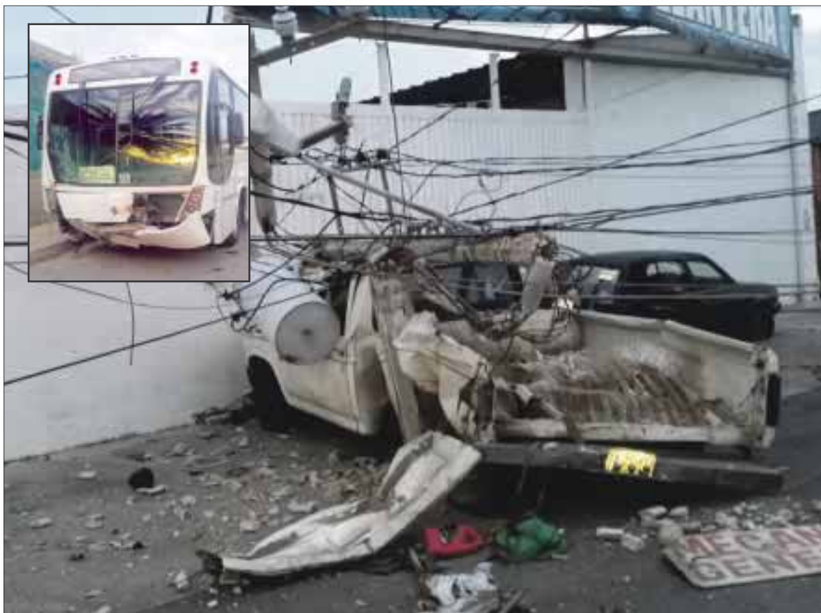
Hotel Royal Resort intenta evadir su responsabilidad , al negarse a proporcionar el nombre del chofer asesino, así como aplicar el seguro de daños a terceros.

El autobús responsable fue encontrado en la región 231, pues el chofer se dio a la fuga.