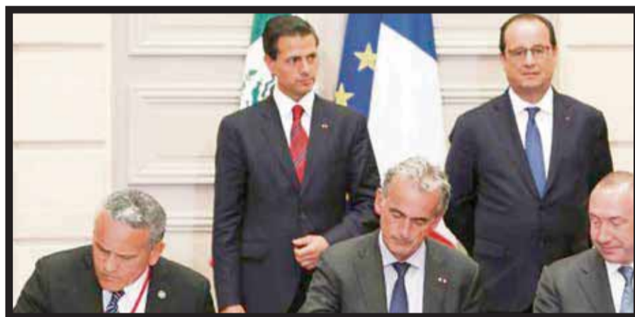
Los presidentes de México y Francia, testigos de la firma del Memorándum de Entendimiento.

El Grupo Air France-KLM ofrece hasta 23 vuelos hacia la ciudad de México desde París-Charles de Gaulle y desde Ámsterdam-Schiphol, siete de ellos en código compartido