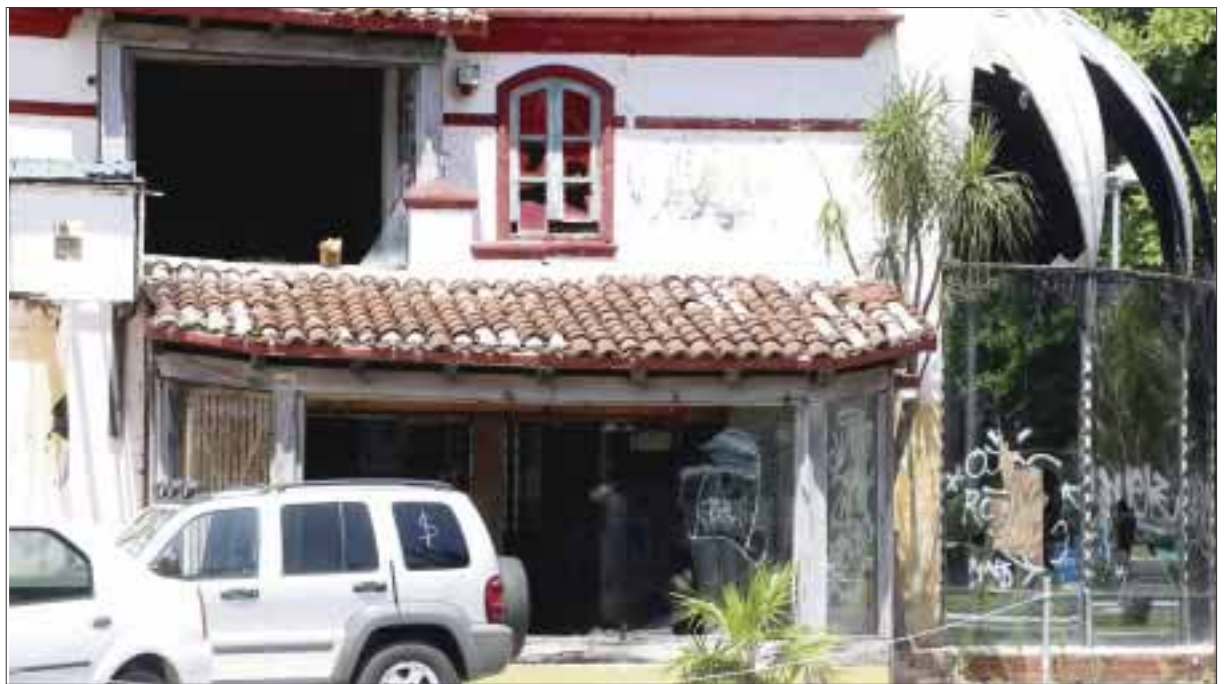
Estos locales llevan 15 años abandonados, ahora son el albergue de maleantes que aparentemente consumen droga, según denunciaron vecinos.

“Este es un problema porque antes tenían unas mallas que impedían el paso a las personas, pero ahora ya no las tienen porque el municipio las mandó a quitar, y los drogadictos las han tomado como su zona de reunión” dijo uno de los vecinos.