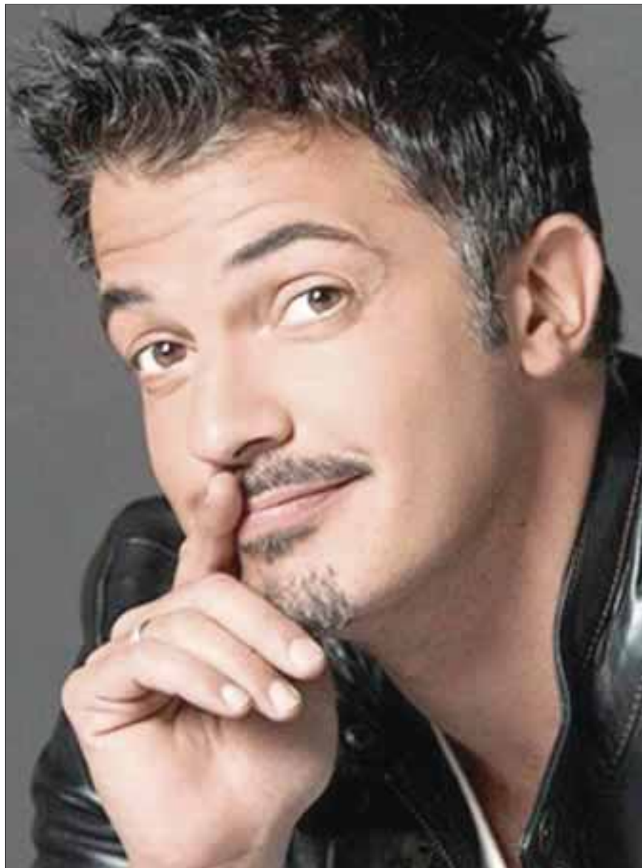
Fernando del Solar tiene tres años luchando contra el cáncer de pulmón.

Asimismo, es importante destacar que la conductora ha sido blanco de severas críticas por parte de los usuarios de las redes sociales quienes le han hecho todo tipo de calificativos, los cuales ella rechaza en totalidad y afirma son producto de la desinformación, aunque ante todo la conductora se ha mostrado fuerte ante esta situación, misma en la que los usuarios de redes incluso convocaron a unir fuerzas para pedir que la conductora fuera despedida de su actual empleo.