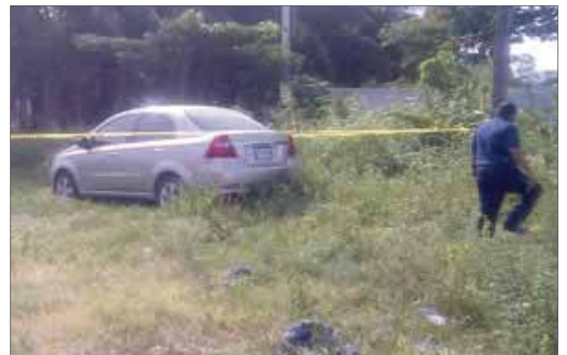
Agentes ministeriales recabaron huellas dactilares del vehículo que utilizaron los asaltantes.