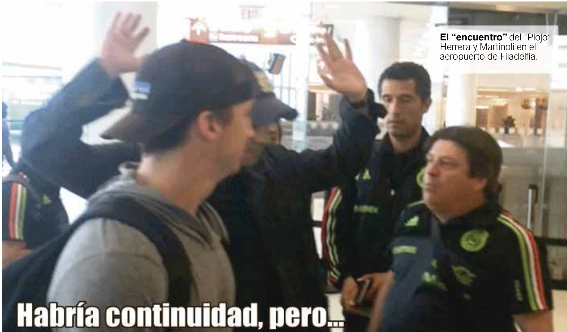
El “encuentro” del “Piojo” Herrera y Martinoli en el aeropuerto de Filadelfia.