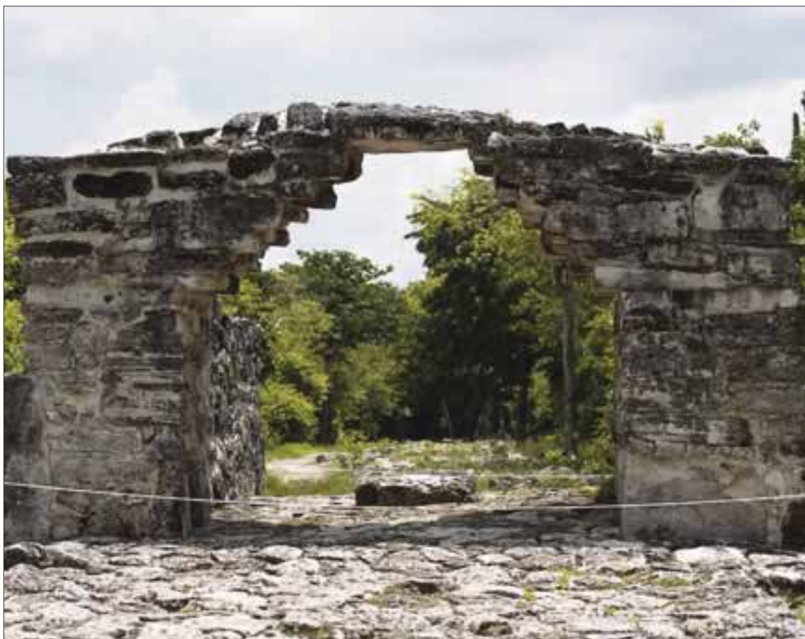
Zona arqueológica de San Gervasio, donde hay más vestigios mayas.

A la fecha se han recolectado unos 700 metros cuadrados de sargazo tan sólo en Playa Gaviotas, uno de los lugares con mayor afectación, según la Zofemat.