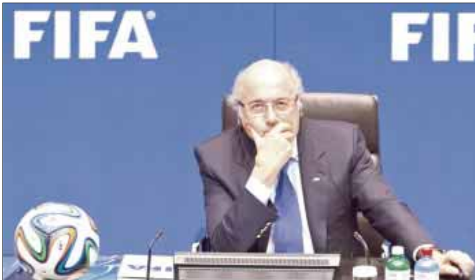
Joseph Blatter renuncia a la FIFA, tras estar en el cargo durante 17 años.

Lionel Messi podría convertirse en el primer jugador en marcar en tres finales de la UEFA Champions League, cuando el Barcelona se mida a la Juventus.