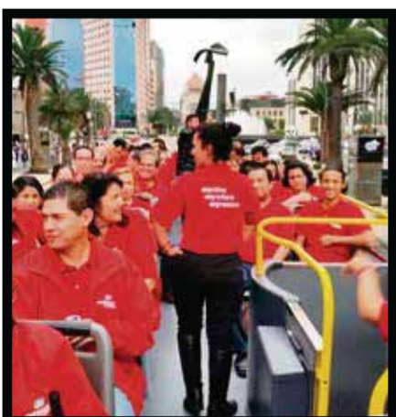
Assist Card México cobra fuerza.

El concurso Fan&Fun tiene una vigencia del 1 de mayo de 2015 al 31 de agosto del 2015. Participan todas las agencias de viajes que estén dadas de alta en la base de Assist Card o aquellas que se den de alta durante este periodo. Por