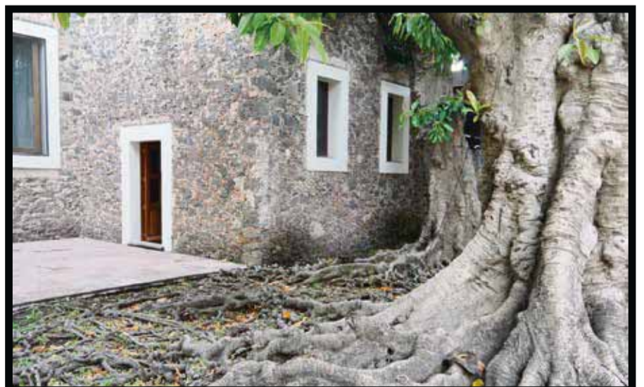
Jurica, "Lugar de Salud", en purépecha.