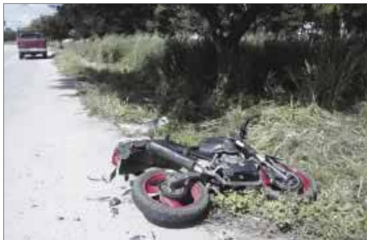
Ante el elevado número de fallecimientos de motociclistas, en Mérida piden impulsar un programa de cultura vial.

Por esa razón, la demanda de "Tribu sin Ley" a las autoridades estatales y municipales de atender el problema, y darle mayor impulso a la cultura vial en Yucatán.