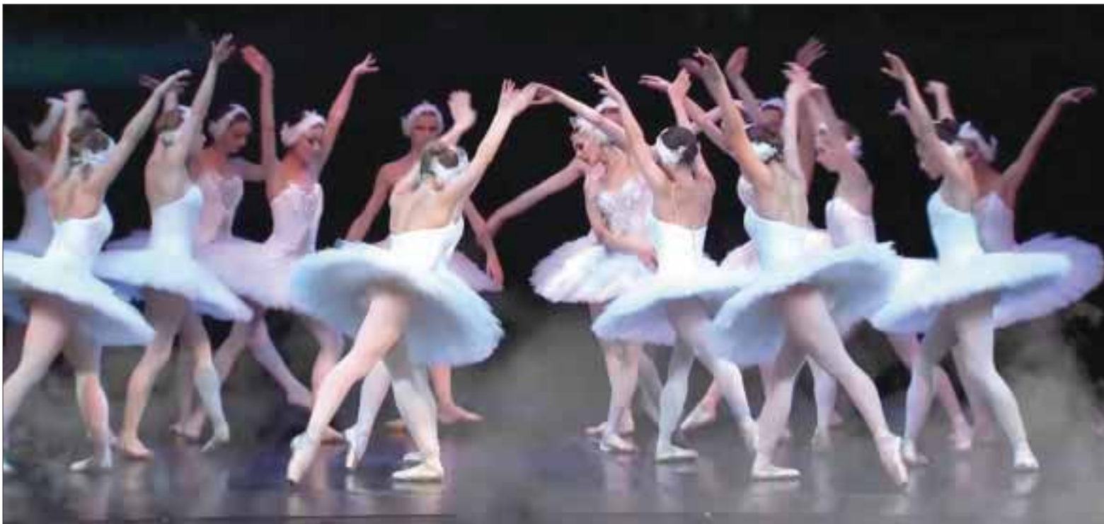
“El lago de los cisnes experiencia 3D”, único en su tipo. La producción es totalmente nueva, aunque ya fue presentada en escenarios de Rusia, China e Israel.

*** La escenografía 3D presenta paisajes que parecen salidos de un cuento de hadas, como lagos encantados, castillos medievales, pintorescos palacios y bosques que sirven de fondo para ambientar las coreografías interpretadas por 32 bailarines profesionales