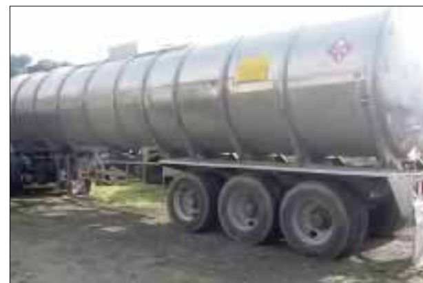
El vehículo de carga circulaba por la carretera Xalapa-Tamarindos.

De esta acción tuvo conocimiento el agente del Ministerio Público de la Federación en Dos Ríos, Veracruz.