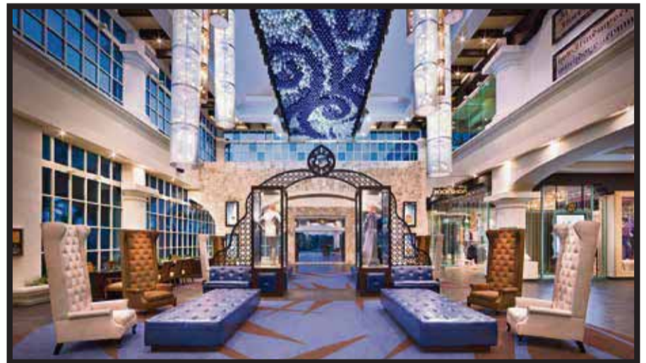
Para quienes gustan del lujo.