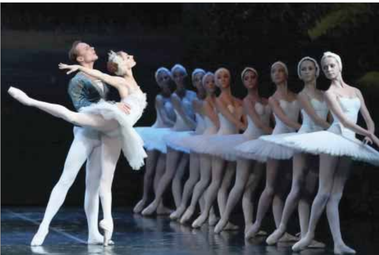
“El lago de los cisnes experiencia 3D” se trata de una combinación de ballet clásico y nuevas técnicas, por lo que es un proyecto costoso, no sólo por el vestuario y los bailarines de indiscutible calidad, sino por la tecnología.

lacios pintorescos del pasado. Tener coreografía combinada y las soluciones de gráficos por ordenador en las actuaciones causa que el público se siente hipnotizado por la fantasmagoría de los personajes en el escenario.