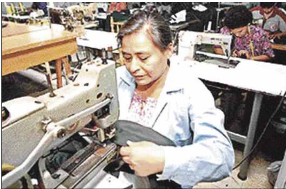
En este sexenio se ha colocado a más de 3 millones 500 mil personas en un empleo formal, a través del Servicio Nacional de Empleo.

Expuso que la Red Nacional de Vinculación Laboral de la Secretaría del Trabajo conjunta los esfuerzos de instituciones públicas, privadas y sociales para promover, difundir y facilitar la inclusión laboral de las personas con discapacidad y adultos mayores.