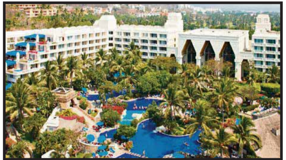
Barceló Karmina Palace Deluxe.