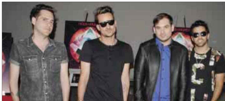
Tan Biónica continuará haciendo presentaciones en nuestro país con frecuencia, no obstante después de esto volverán a Argentina para cumplir con más compromisos.

LA SALA, recinto de espectáculos en la colonia Roma, de la ciudad de México. De este disco, Chano dijo "captura muchos momentos de nuestras vidas y es 'Hola mundo' no sólo porque es cuando lo estamos lanzando, sino todo lo que tuvo que pasar antes, componer,