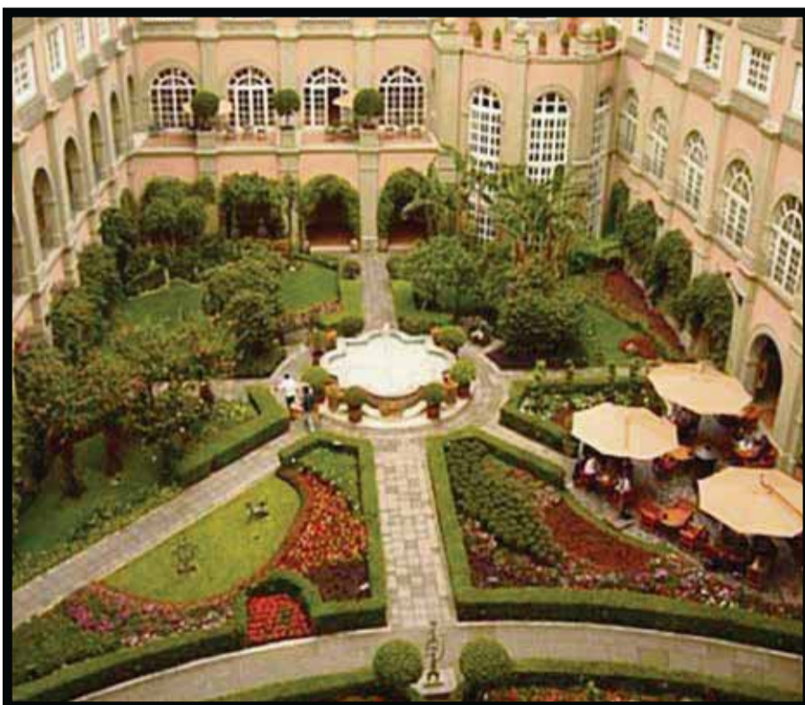
Para celebrar a papá.

Localizado a lo largo de la Playa Monumentos, una majestuosa ubicación para practicar surf entre las ciudades de San José del Cabo y Cabo San Lucas, el inmueble cuenta con 161 habitaciones con impresionantes vistas al Mar de Cortés y al Arco de Los Cabos, mismas que se unifican perfectamente con el sello estético de lujo urbano, característico de Baja California Sur.