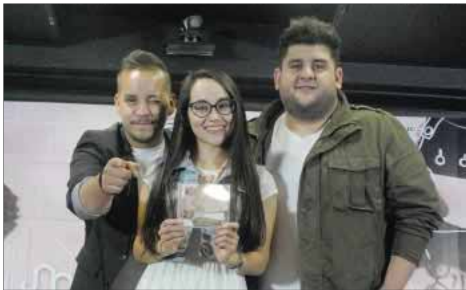
En conferencia de prensa y showcase simultáneo, los chicos de Matisse ofrecieron los detalles de su disco debut "Sube".