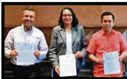
Formalizan convenios de infraestructura turística Jiquilpan y Pátzcuaro.