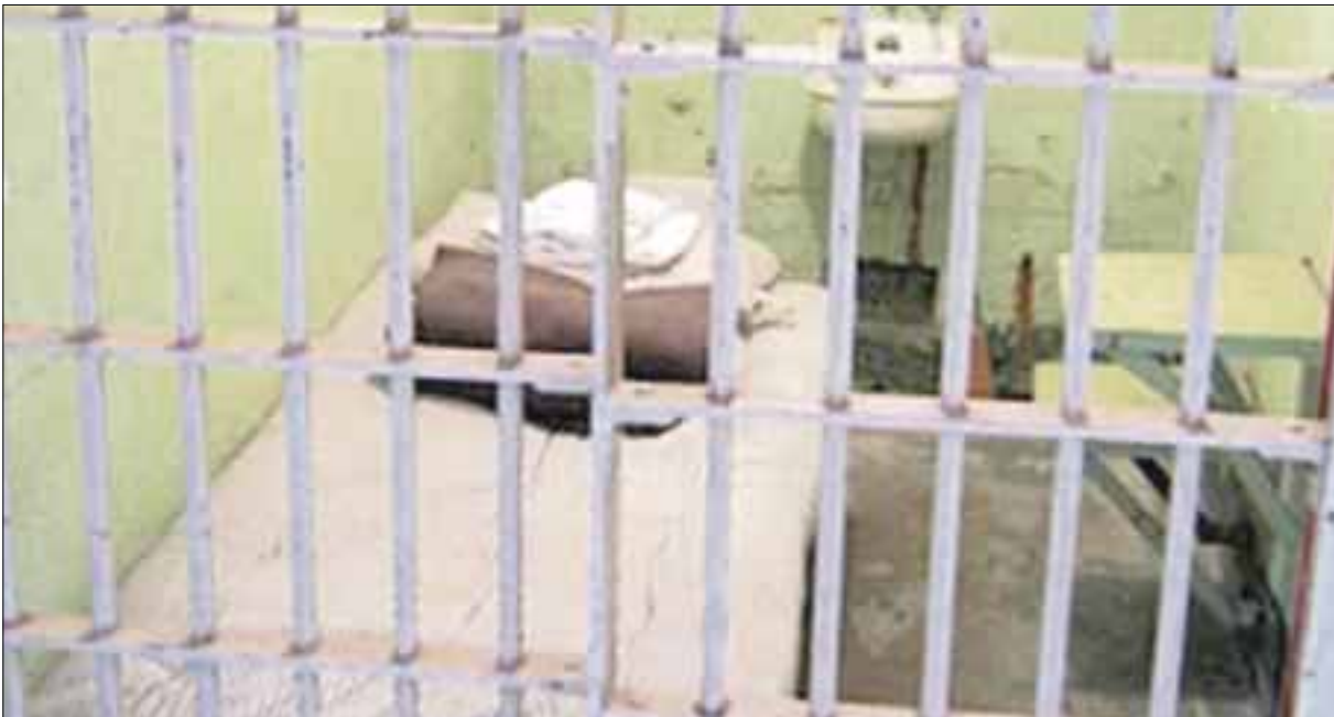
La secuestradora sentenciada se encuentra internada en el Centro de Ejecuciones de Sanciones de Matamoros, Tamaulipas.