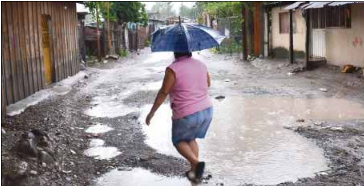
Se mantiene en alerta amarilla las zonas Frailesca, Sierra Mariscal, Istmo-Costa y Soconusco, con probabilidad de lluvias intensas.