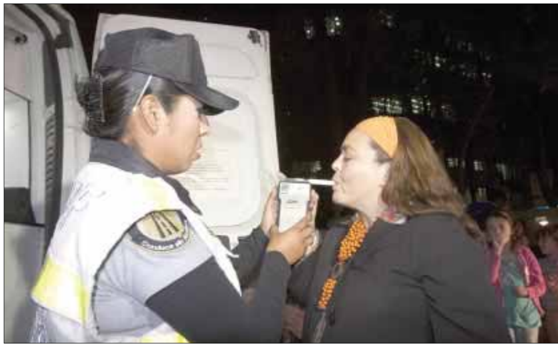
El programa Conduce Sin Alcohol ha contribuido a reducir en 30% el índice de accidentes fatales asociados con el consumo de bebidas embriagantes en el DF.

Esta percepción es avalada por la Secretaría de Seguridad Pública del Distrito Federal (SSPDF), ya que la institución reportó en 2012 que el programa ha contribuido a reducir en 30 por ciento el índice de accidentes fatales asociados con el consumo de alcohol y a disminuir en 70 por ciento las muertes por conducir en estado de ebriedad.