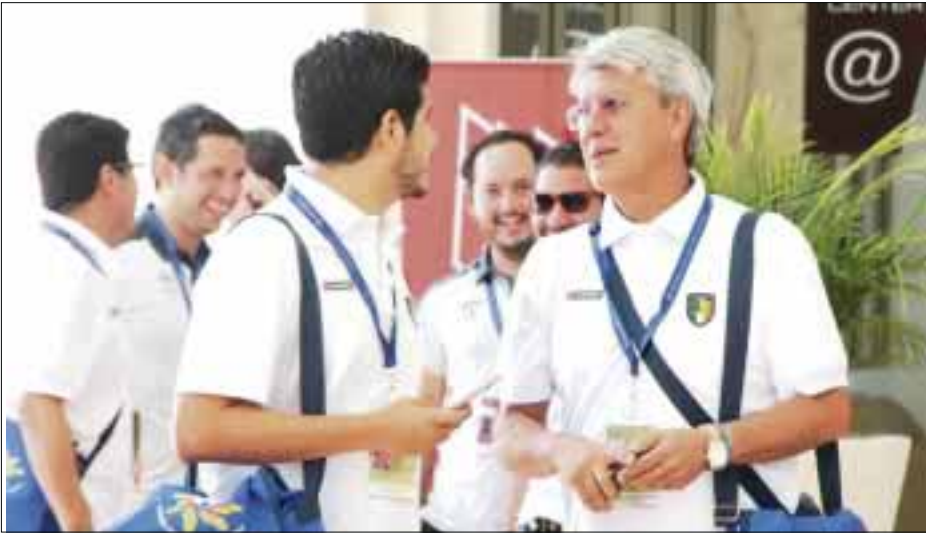
Cerca de 400 jugadores del balompié mexicano, han sido puestos en el aparador del draft en Cancún.