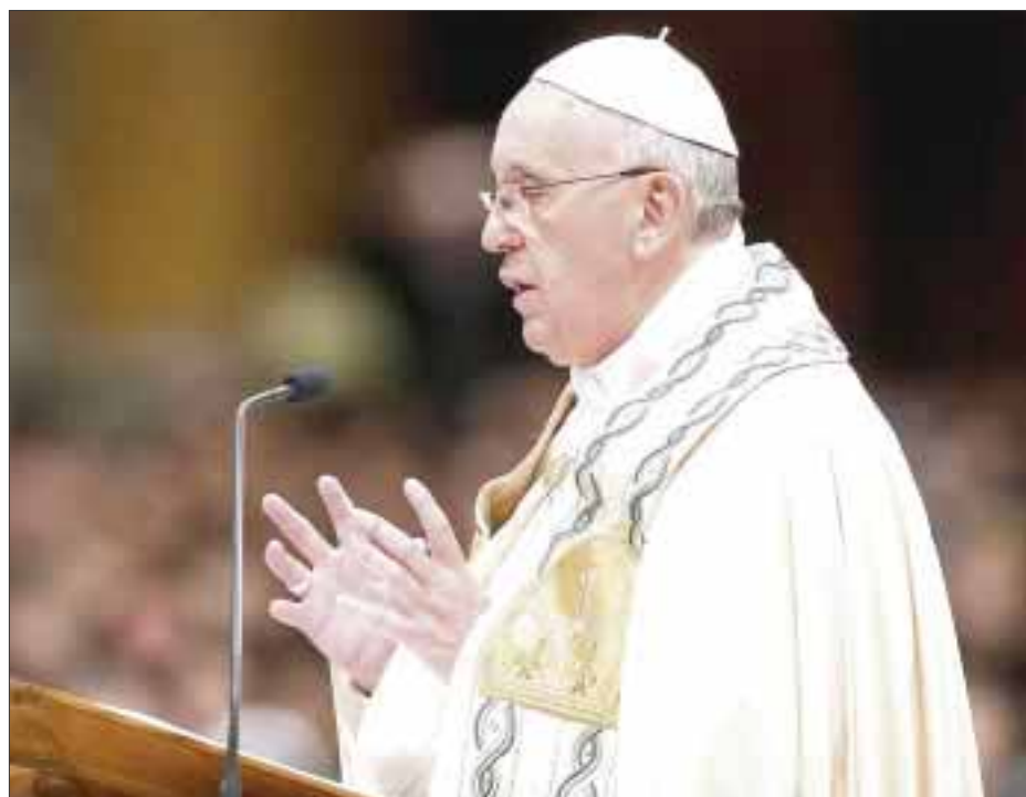
El Papa Francisco aprobó nuevo tribunal eclesiástico que se encargará de juzgar por negligencia a los obispos católicos que encubran casos de abusos sexuales contra menores.

Es la primera vez que el Vaticano tendrá un tribunal especial contra la negligencia de los obispos, hasta el momento los casos de mala gestión (no sólo de los casos de abuso, sino también de otras situaciones escandalosas) eran tratados por la Congregación para los Obispos.