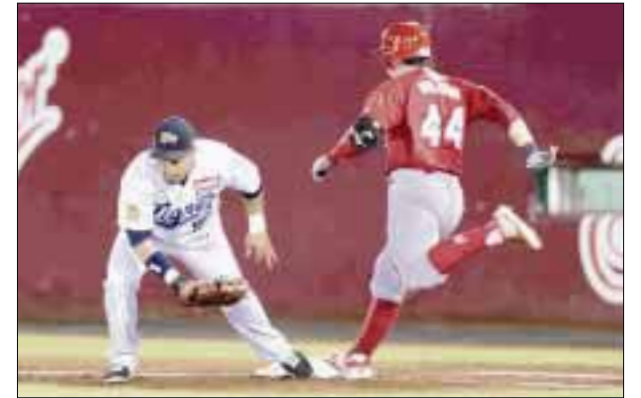
Los Diablos Rojos del México impusieron condiciones a los Tigres en su propia casa, al derrotarlos en el primero de la serie.