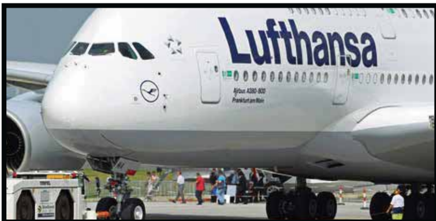
Nueva app para estar al tanto de todo.