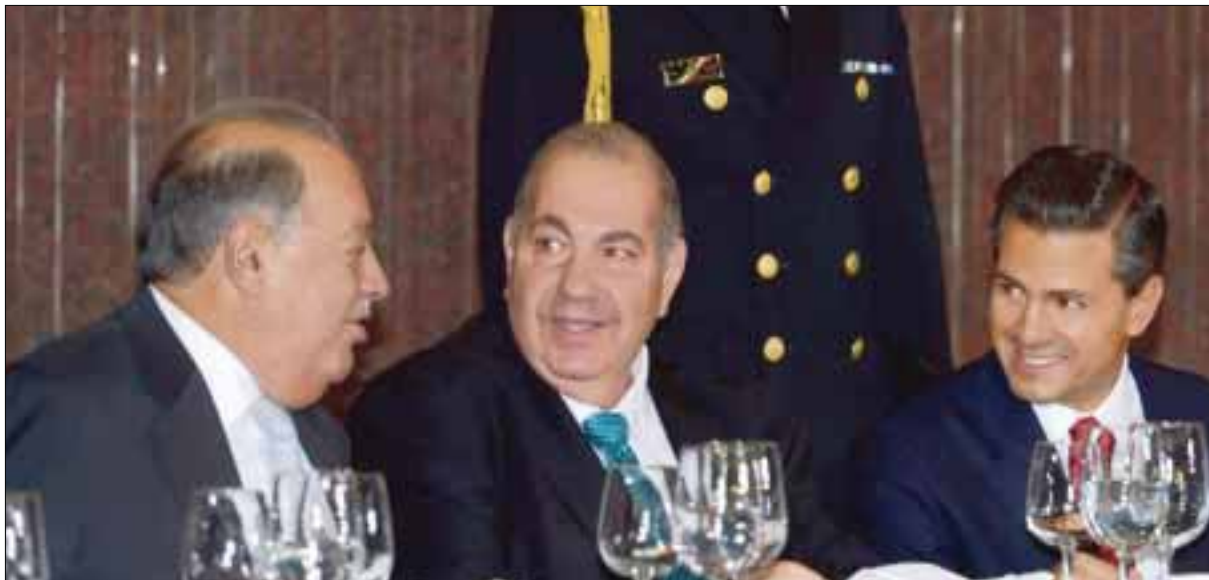
Enrique Peña Nieto destacó ante la comunidad libanesa en México, que la inversión extranjera directa en el primer trimestre de 2015 es histórica, con 7 mil millones de dólares.

Agregó que las partes convinieron que a más tardar el lunes 22 del presente mes, la AGP publicará su propuesta de conformación de la Comisión Organizadora del Congreso Nacional Politécnico. El ofrecimiento de la Dirección General del IPN define la cantidad de estudiantes, docentes, trabajadores de apoyo y autoridades que conformarían la Comisión.