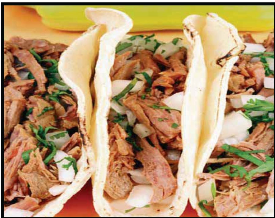
En el Festival de las Botanas.

☆☆☆☆☆ El Tercer Festival de Botanas se realiza desde el pasado 12 de junio y concluirá el 12 de agosto en los hoteles