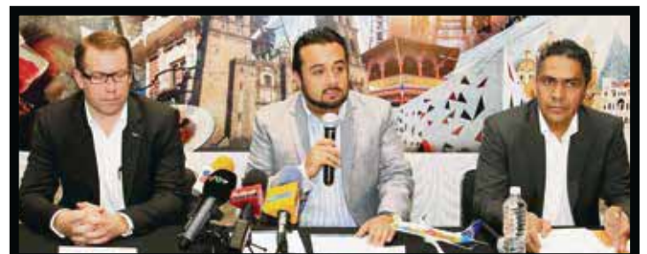
Durante la presentación del nuevo vuelo en Puebla.