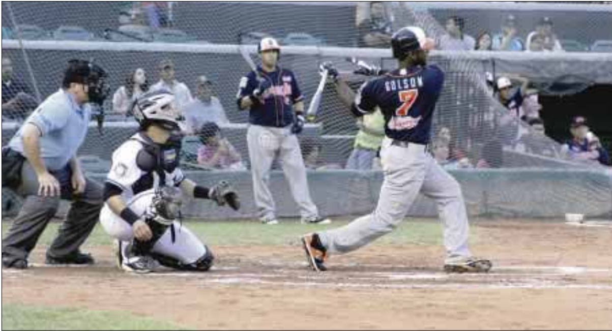
Tigres de Quintana Roo juega ya por orgullo, pues cada vez se aleja de lo que serían los equipos punteros de la tabla.