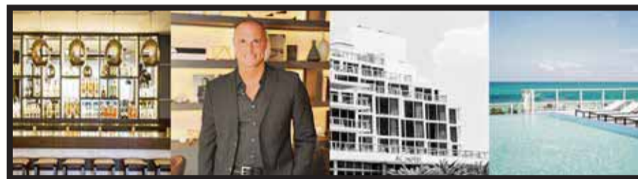
Un nuevo concepto de hotel en Miami Beach.

El hotel está diseñado para espíritus creativos, cosmopolitas y emprendedores que están en constante movimiento y que aprecian el oasis de un hotel bien diseñado que les permita momentos de tranquilidad, estar atentos y conectarse con otros. Todo se crea intencionalmente. Elimina lo innecesario para ofrecer a los huéspedes momentos cuidadosamente diseñados de elegancia que realzan su estancia. El estilo de la marca cuenta con