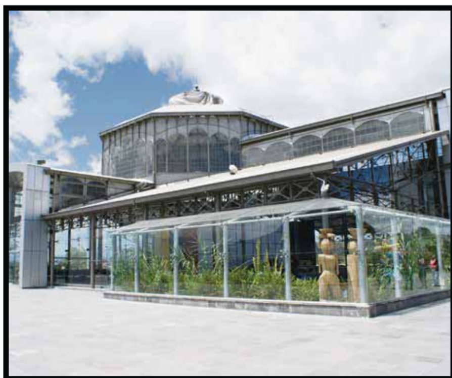
Centro Cultural Itchimbía, en Quito, Ecuador.

El encuentro está organizado por el Ministerio junto con la Sociedad Internacional de Ecoturismo ( The International Ecotourism Society, TIES ), como uno de los encuentros que se enmarca en la Estrategia de Excelencia Turística de esta Cartera de Estado, pues brinda una oportunidad única para exhibir al país anfitrión sus bondades para el desarrollo del turismo de naturaleza y ecoturismo