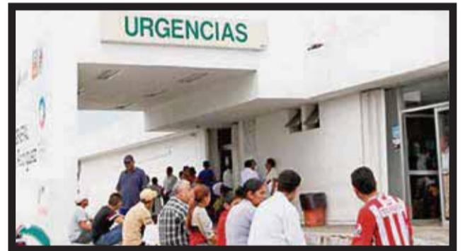
EL MENOR PRESENTA DERRAME CEREBRAL que le fue diagnosticado en el Hospital General.