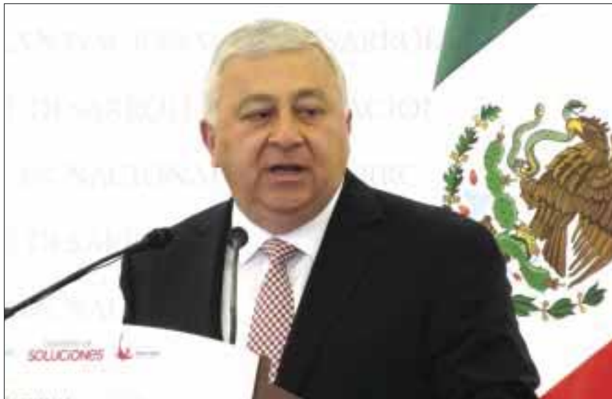
Emilio Chuayffet Chemor , secretario de Educación, presentó su informe en la Biblioteca de México sobre los avances de la reforma educativa.