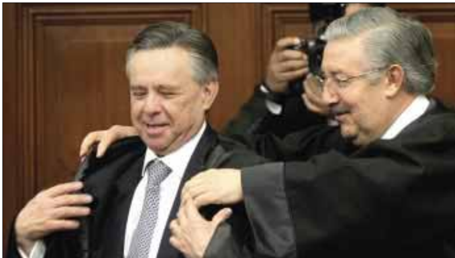
Eduardo Medina Mora Icaza será ministro de la Suprema Corte de Justicia por los próximos 15 años.

"Los mexicanos necesitamos tener la confianza de que nuestros derechos, sobre todo los derechos humanos,