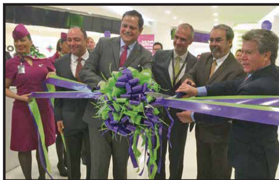
En la inauguración de los mostradores interactivos.

De igual forma, dijo que la compañía cada vez tiene más interés en atraer a quienes utilizan el autobús como medio de transporte y prefieran volar en trayectos que lo ameriten. Queremos que todo mundo vuele a precios accesibles y que salgan del convencionalismo de creer que utilizar avión es elitista.