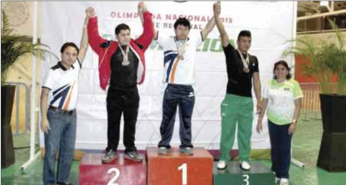
Con 167 medallas, 74 de oro, los plusmarquistas de Quintana Roo se encuentran listos para la Olimpiada Nacional.