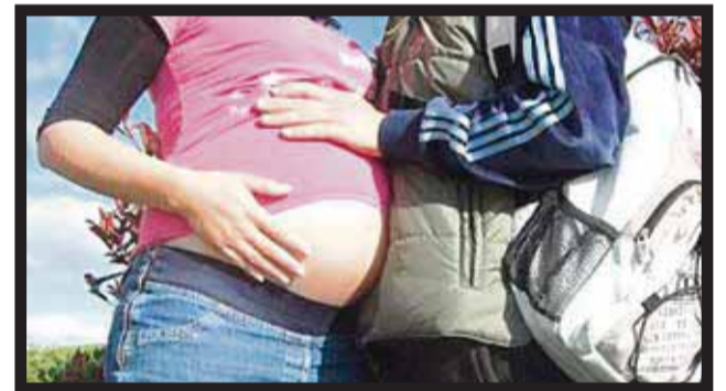
LA POBLACIÓN FLOTANTE CONTRIBUYE a que aumenten embarazos no deseados.