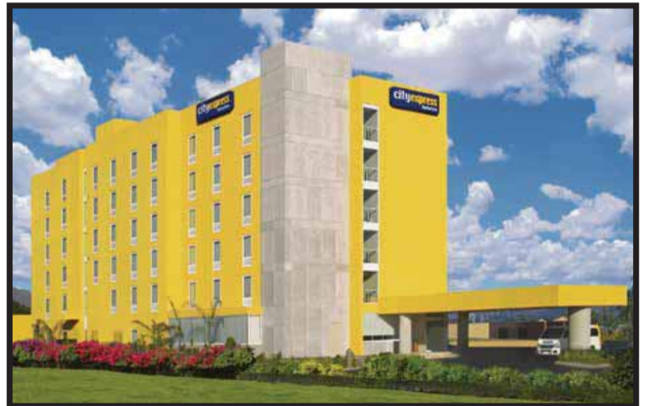
La cadena hotelera te da tips para disfrutar vacaciones.

☆☆☆☆☆ Lizard Island es el resort de lujo seleccionado en el 2013 por los lectores de la revista Travel+Leisure , una de las publicaciones más importantes del mundo en temas turísticos, como uno de los 10 mejores hoteles de lujo del mundo y el mejor resort de Australia, Nueva Zelanda y Oceanía. Este reabrirá nuevamente sus puertas a los turistas el