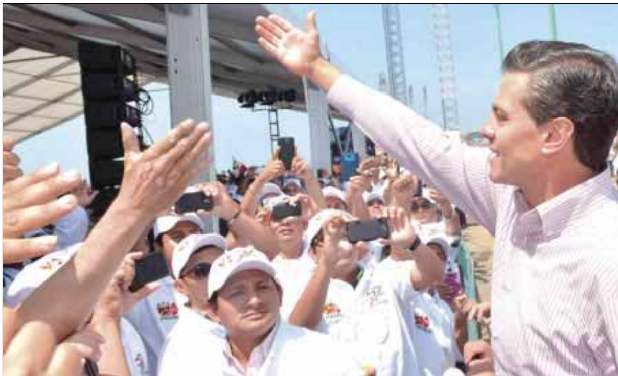
Enrique Peña Nieto encabezó en la Terminal Marítima de Dos Bocas el festejo por el 77 Aniversario de la Expropiación Petrolera.