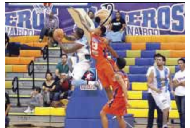
Los emplumados esperan hacer sudar a Pioneros, quienes traen una racha perdedora desde Brasil.

Luego de estos dos juegos, las hostilidades se trasladarán a la ciudad de Xalapa para reanudar la serie los días 23 y 24 de marzo y en caso de ser necesario los juegos restantes serán el 25 de marzo en Xalapa, 28 y 29 de marzo en el Caribe mexicano.