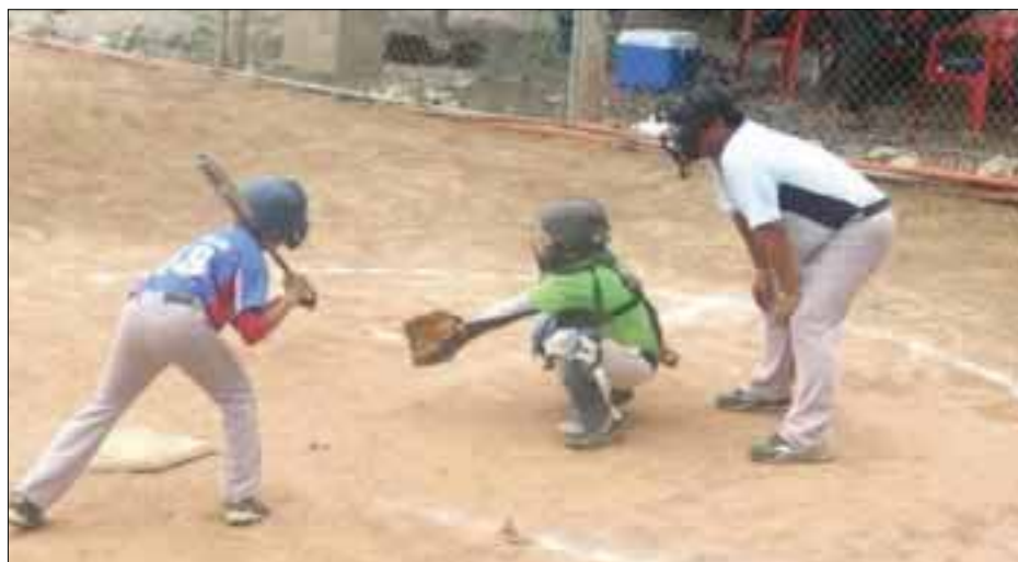
El cielo se vistió de júbilo al ganar por holgada pizarra los Ángeles de la 510 sobre Colonia Yucatán.