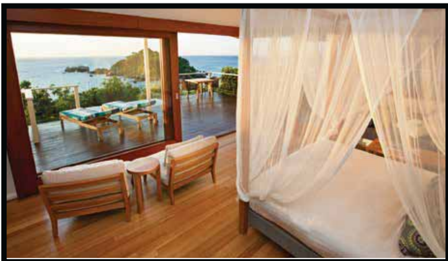
Un resort de lujo en Australia.

Con un portafolio de cerca de 90 hoteles alrededor del mundo, The Luxury Collection ofrece a las exploradoras sagaces el acceso a las ciudades más fas-