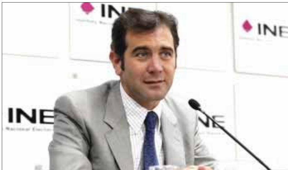
El consejero presidente del INE, Lorenzo Córdoba, aclaró que hasta ahora no han recibido petición de seguridad para candidatos.