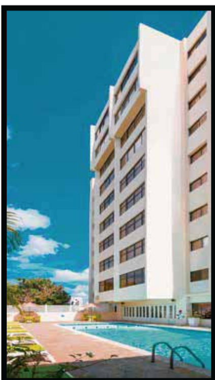
El hotel en Santo Domingo.

☆☆☆☆☆ El secretario de Turismo en Sinaloa, Francisco Manuel Córdova Celaya , anunció un incremento en los itinerarios de arribos de cruceros para los años 2016 y 2017, que superarán aún