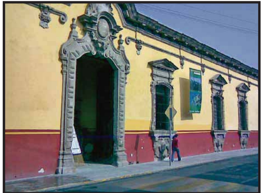
Celaya, una de las ciudades preferidas.

La operación "Teoría de los seis amigos" que fue concebida por la Agencia W tenía como objetivo seleccionar a un candidato, en algún lugar del mundo y llevarlo/a a conocer a un originario de la