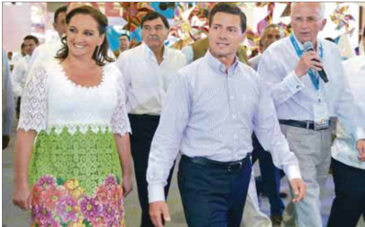
El presidente Enrique Peña Nieto anunció durante la inauguración del Tianguis Turístico 2015, que el gobierno federal pondrá en marcha una estrategia de turismo social.