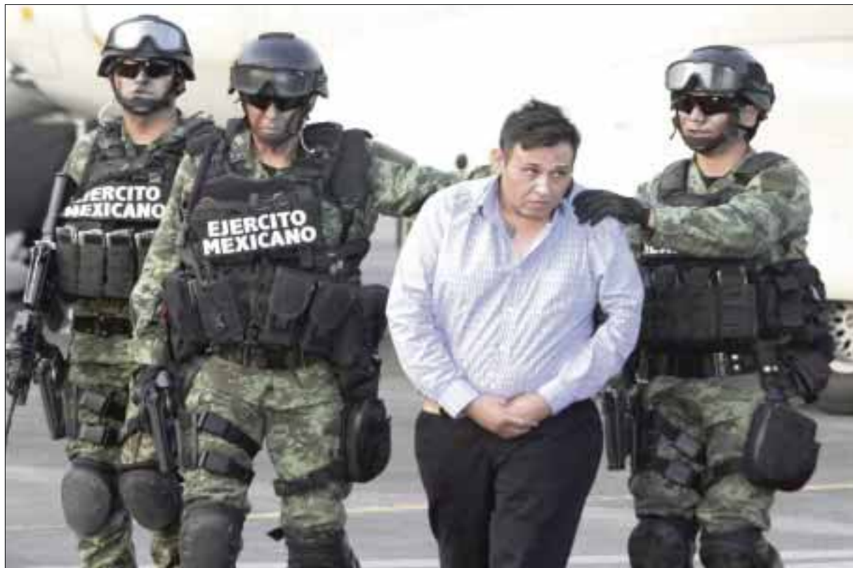
Óscar Omar Treviño Morales, El Z-42 ya suma dos procesos iniciados por delitos graves.