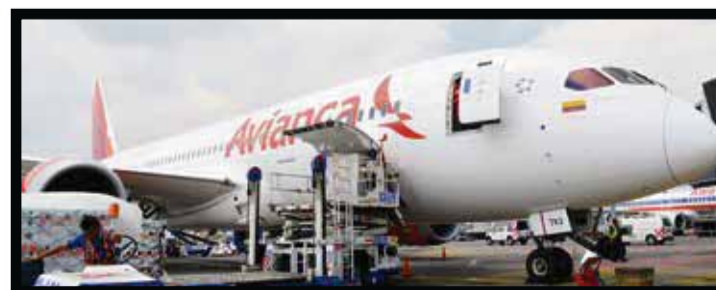
Además de pasajeros, el avión llegó con un importante cargamento de flores.