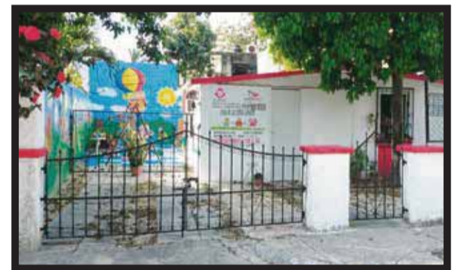
EN EL INTERIOR DE LA CASA DE LOS NIÑOS varios menores fueron víctimas de abuso sexual.

quien resulte responsable, para iniciar la investiga- ción de los hechos en la guardería contra el presun- to violador que ya se dio a la fuga. La coordinación del CAIC en la Zona Norte, a cargo de... >2