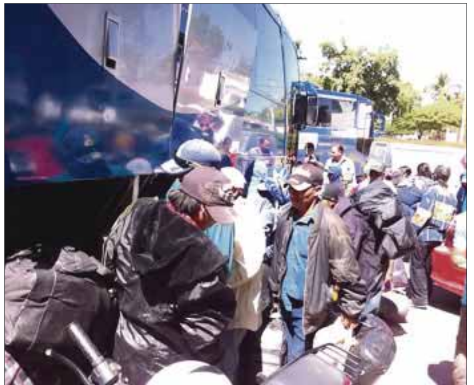
Los 200 jornaleros tarahumaras rescatados la semana pasada en Comondú, ya están en Chihuahua.

puesto más de 140 millones 240 mil pesos en multas y afirmó que el operativo "México con Trabajo Digno", es una clara advertencia para que los empleadores mejoren las condiciones humanas y laborales de los trabajadores.