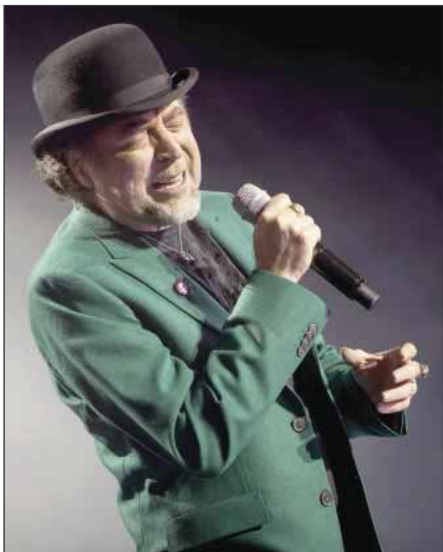
Suma cinco conciertos con las fechas del 1, 2 y 4 de mayo.

Como resultado de su paso por tierra rioplatense, Sabina lanzó recientemente el doble CD-DVD, que recoge íntegro el puñado de conciertos que dio en el Luna Park de Buenos Aires.