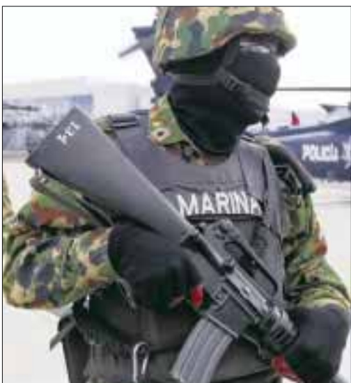
El Ejército Mexicano cosechó trabajos de inteligencia en la frontera.

Con el propósito de mejorar los resultados en su control y abatimiento, se implementaron acciones para fortalecer la estrategia institucional contra la tuberculosis.