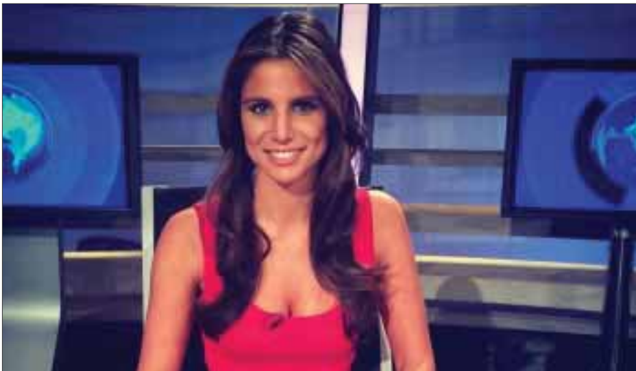
El delantero mexicano del Real Madrid, Javier ‘Chicharito’ Hernández, se encuentra feliz porque está estrenando novia. La pareja aparece en la portada de la revista ¡Hola!