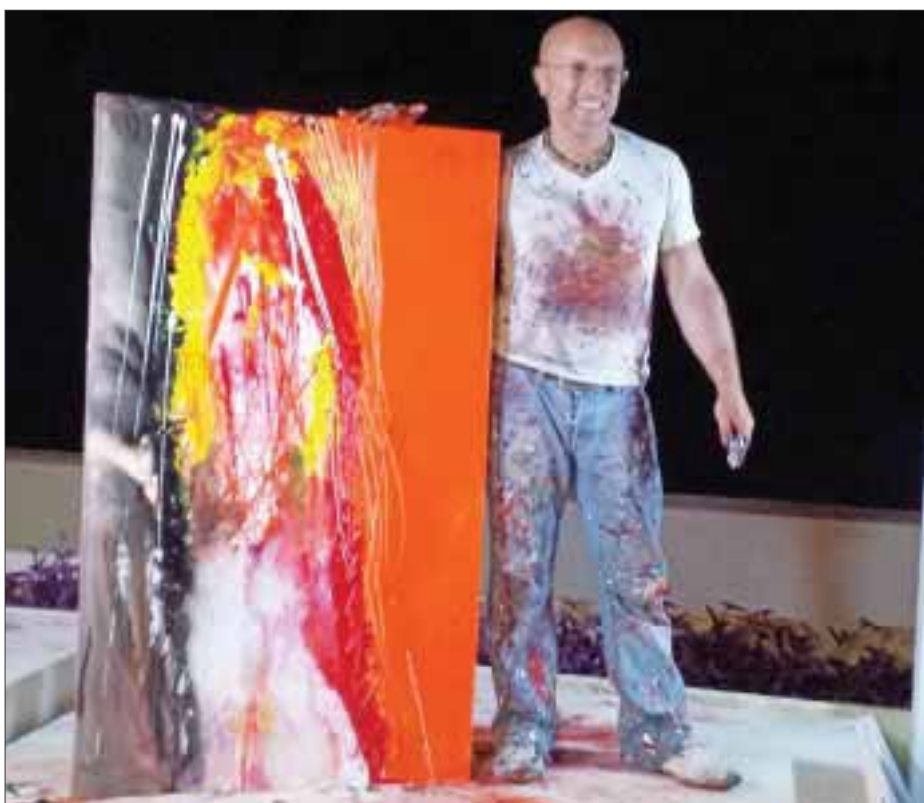
Los cuadros que pintó durante su estancia en este polo turístico serán subastados y los fondos se donarán a una fundación.

“Más allá de la imaginación” se presentará el próximo domingo 29 de marzo en punto de las 12:30 horas en el Foro Luces de Bohemia, ubicado en Orizaba 193, colonia Roma. El costo del boleto es de 120 pesos, adultos mayores y menores con credencial 100 pesos.