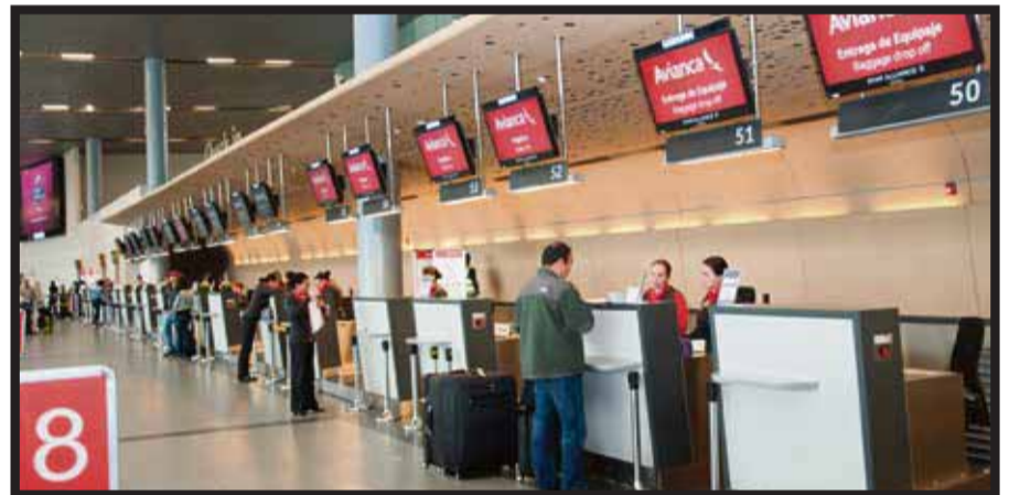
En Semana Santa incrementa sus rutas.

Detalló que a Irapuato están llegando nuevos hoteles que superan una inversión por más de 500 millones de pesos; por ejemplo, en la pasada administración el promedio anual de inversión privada en todo el estado fue aproximadamente entre los 500 y 600 millones de pesos. “Y sólo está llegando a Irapuato, lo que hace seis u ocho años era toda la inversión en el estado en materia turística. Por