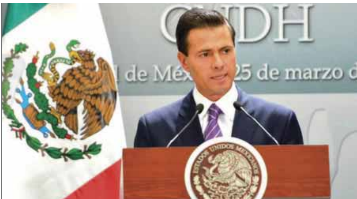
El presidente Enrique Peña Nieto aseguró, en la presentación de Informe de Labores de la CNDH, que los derechos humanos deben ser respetados por todos.

El diputado tamaulipeco, Enrique Cárdenas del Avellano, dijo que son temas que no pueden esperar y que deben ser atendidos a la mayor brevedad debido al alto índice de casos anuales que registra esta población.