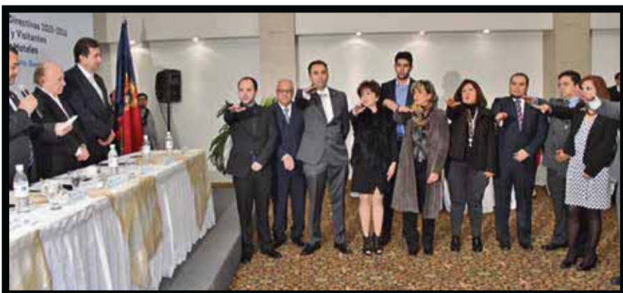
En la toma de protesta.

En este sentido, la Secretaría de Turismo trabaja proyectos conjuntos de impulso a los municipios del estado, y en el caso de Irapuato están los circuitos de recorridos, como el de la fresa, o los eventos de promoción como “Mis