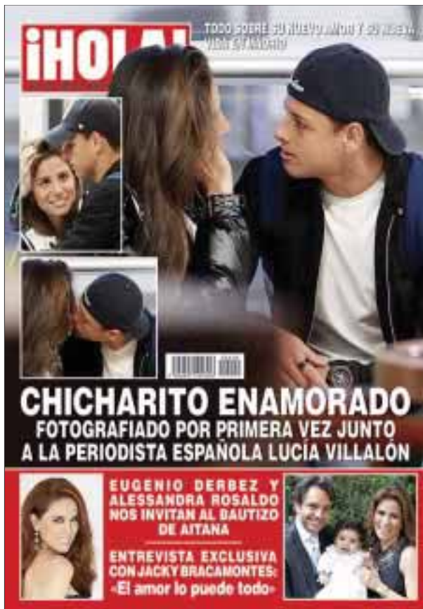
El delantero mexicano del Real Madrid, Javier ‘Chicharito’ Hernández, se encuentra feliz porque está estrenando novia. La pareja aparece en la portada de la revista ¡Hola!