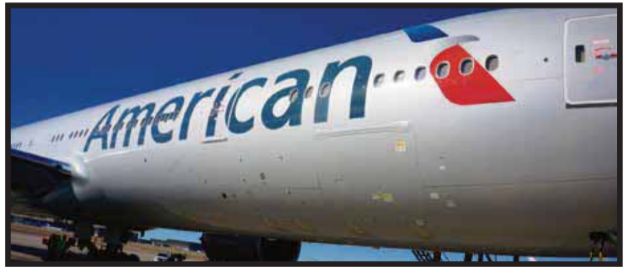
Celebra 10 años de volar entre San Luis Potosí y Dallas/FortWorth.

☆☆☆☆☆ Guanajuato está listo para ser por tercer año consecutivo la sede de KULTUR 2015, foro de gran importan-