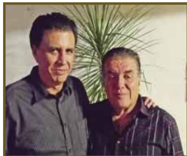
El festejado, en compañía de su hermano.

Una noche de karaoke, en compañía de familiares y amigos