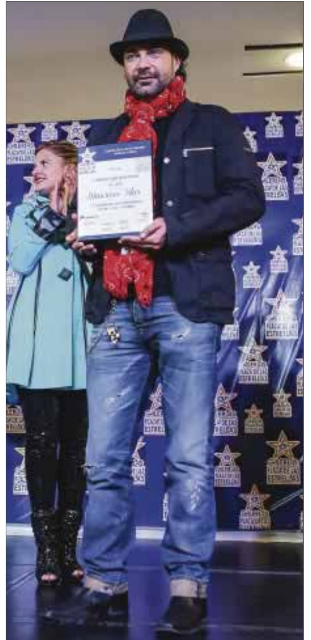
EL TALENTOSO MAURICIO ISLAS , padrino de lujo de DIARIOIMAGEN .