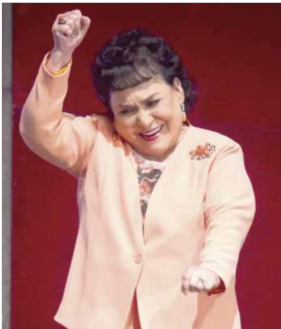
La actriz Carmen Salinas sí participará por una candidatura a una diputación plurinominal por el Partido Revolucionario Institucional (PRI).

Es así como la actriz Carmen Salinas sí participará por una candidatura a una diputación plurinominal por el Partido Revolucionario Institucional (PRI), así como la hija del diputado Manlio Fabio Beltrones.