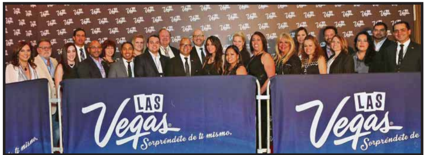
La delegación procedente de Las Vegas y los representantes en México.

"Estamos muy satisfechos con el nuevo récord que se obtuvo en 2014 con la llegada de 41.1 millones de visitantes. México sigue ocupando el segundo lugar como principal mercado emisor internacional, gracias al trabajo estratégico que realizamos en conjunto con tour opera-