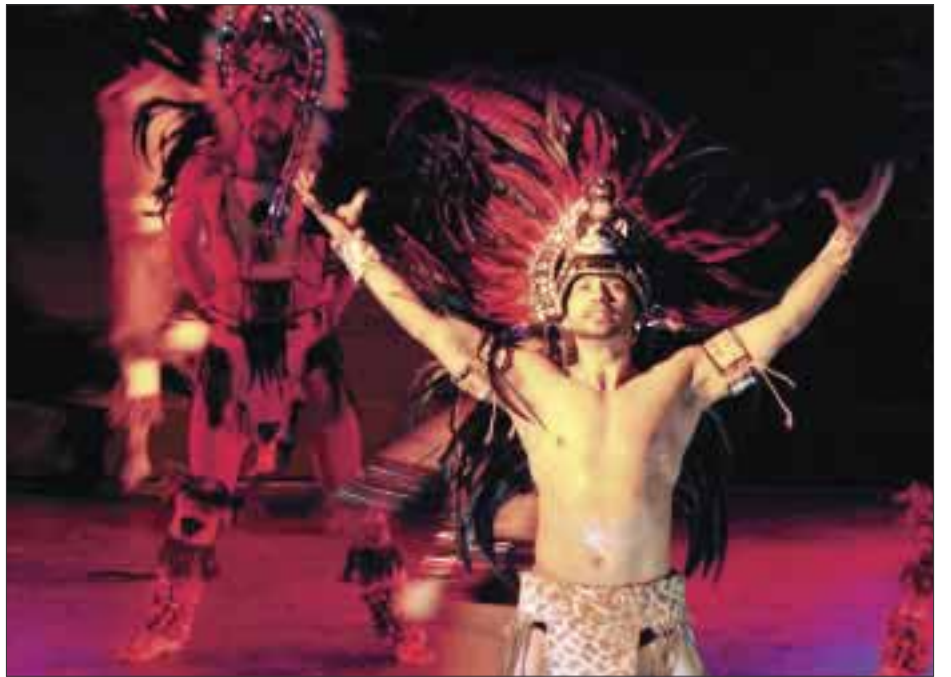
El público ovacionó el espectáculo “¡Viva Veracruz!”.

***El espectáculo de danza logra la emoción, el asombro, el amor y el orgullo por ser mexicano