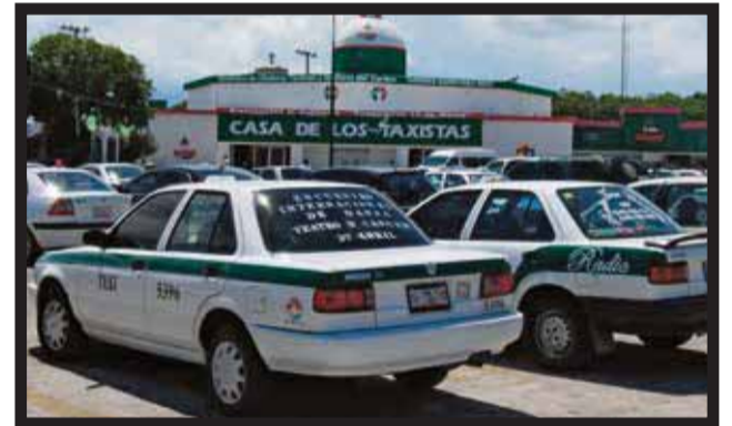
LOS USUARIOS DE TAXIS TIENEN QUE PAGAR hasta 5 pesos más por dejada.

taxistas efectuada el 24 de enero, se determinó que el incremento se aplazaría un mes más. A los operadores también les aumentaron el monto que le cobran el patrón por liquidación, ya que hasta el... >5