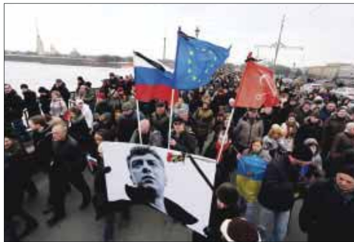
El líder opositor ruso Boris Nemtsov, asesinado la noche del viernes cerca del Kremlin.

Nemtsov, ejecutado a tiros el viernes pasado en un puente cercano al Kremlin, debía encabezar ayer domingo una manifestación contra