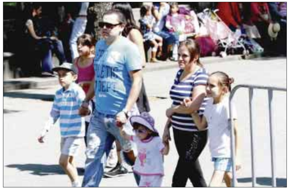
Cada primer domingo de marzo se conmemora el Día de la Familia para fomentar la convivencia entre sus integrantes.

mos capaces de ver las diferencias familiares que hay y mucho menos entenderlas; como nos cerramos, nos volvemos inflexibles y hasta juzgadores, cuando todas estas diferencias nos pueden dejar algo positivo”.