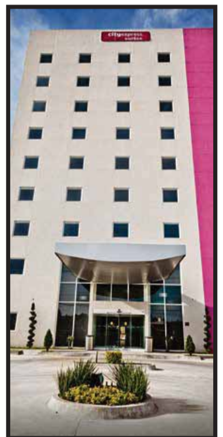
La cadena tiene una app mejorada.

☆☆☆☆☆ Aerolíneas Ejecutivas (ALE) presentó su flota de seis nuevos jets ejecutivos modelo Learjet 75 con el fabricante canadiense Bombardier . El acto se realizó en los hangares de ALE localizados en el Aeropuerto internacional de Toluca. Las nuevas aeronaves