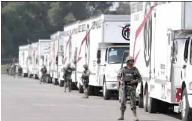
El primer envío partió de la bodega central ubicada en Tepetzotlán a los estados de Baja California, Baja California Sur, Sonora y Sinaloa, en un convoy integrado por 9 tráilers.

Aclaró que en ningún momento y bajo ninguna circunstancia, durante los traslados, ni durante el resguardo, el personal del Ejército y la Marina, que custodiarán el material, tendrá contacto con la documentación ni con los materiales electorales, ya que ésta es una tarea exclusiva de las autoridades electorales.