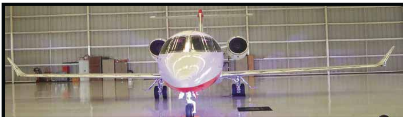
Presentan la nueva flota.

“Realizamos esta importante inversión en un financiamiento a largo plazo para continuar ofreciendo a nuestros clientes la máxima eficiencia y ahorro de tiempo, una gran herramienta de trabajo para las empresas y ejecutivos moder-