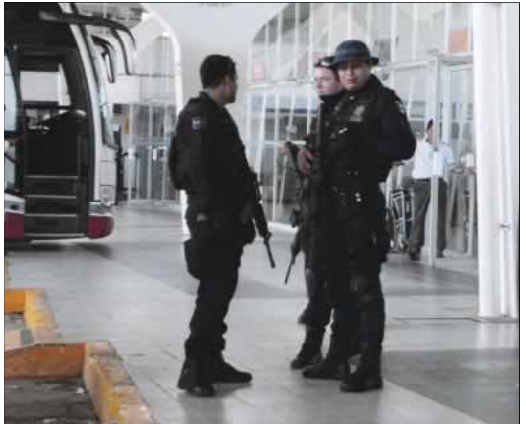
Los cuatro secuestradores que fueron traídos de Guerrero a este centro vacacional, recibieron ayer la orden de aprehensión.

Las cuatro personas, trasladadas desde Iguala Guerrero, fueron notificadas al interior de la cárcel de Cancún, toda vez que fueron reclusas por los delitos de promoción de conductas ilícitas, cohecho y distracción de recursos públicos, bajo la causa penal 181/2015.