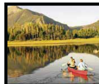
Rocky Mountain National Park.