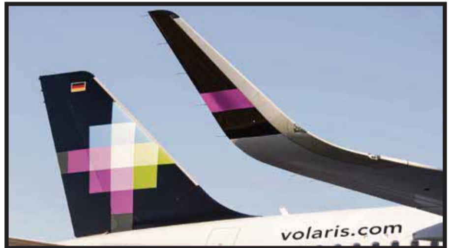
De Cancún a San Juan, Puerto Rico.