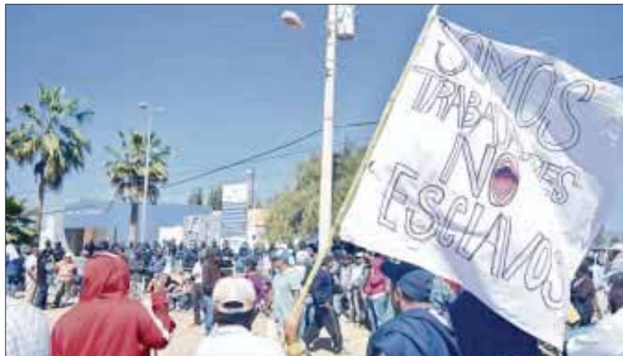
Iniciará de inmediato una campaña de afiliación y credencialización de todos los jornaleros de San Quintín al IMSS.

El sexto precisa que se creará un fideicomiso de inversión con aportaciones de los gobiernos federal, estatal y las empresas para el desarrollo de la zona. Dicho fideicomiso quedará formalizado en un plazo no mayor a sesenta días.