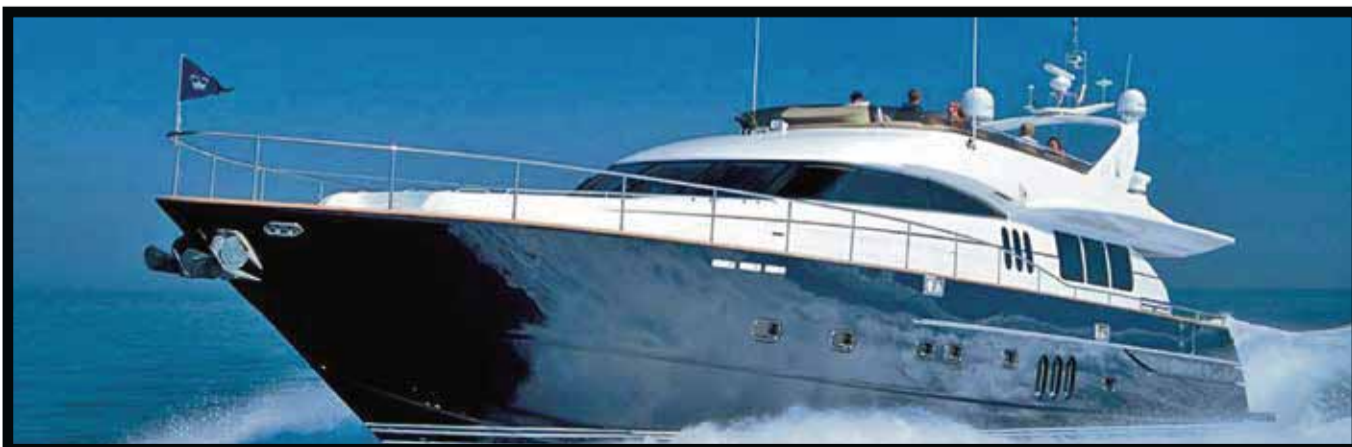
Este año, Princess Yacht celebra su 50 aniversario.