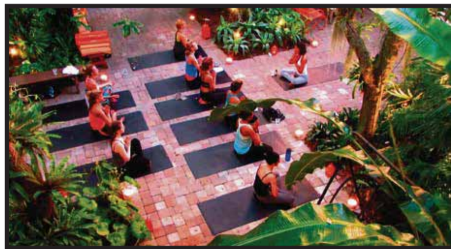
Un retiro de yoga en Circa 39 .

☆☆☆☆☆ Con Holiday Inn Resort, Montego Bay, Jamaica All-Inclusive nace un nuevo concepto en alojamiento exclusivo para los huéspedes más exigentes, mayores de 18 años, que quieran pasar unas vacaciones inolvidables y disfrutar al máximo el romance con su pareja. El Rosehall Club es una nueva sección del hotel que abrió sus puertas a