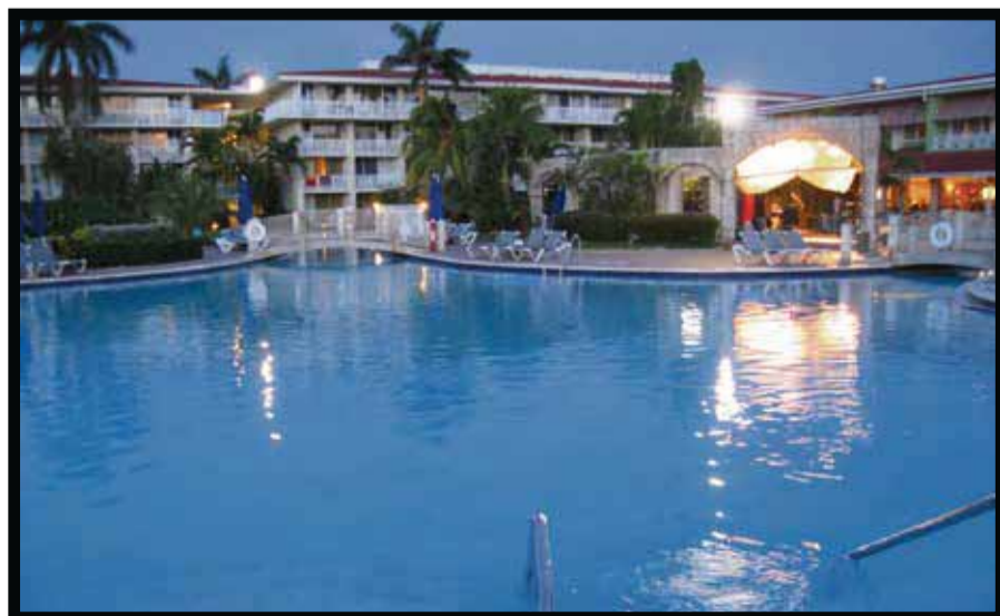
Holiday Inn Resort, Montego Bay.

Durante varios años, la aerolínea se ha asociado con algunos de los mayores eventos regionales relacionados con el Orgullo Gay en todo el mundo. Este 2015,