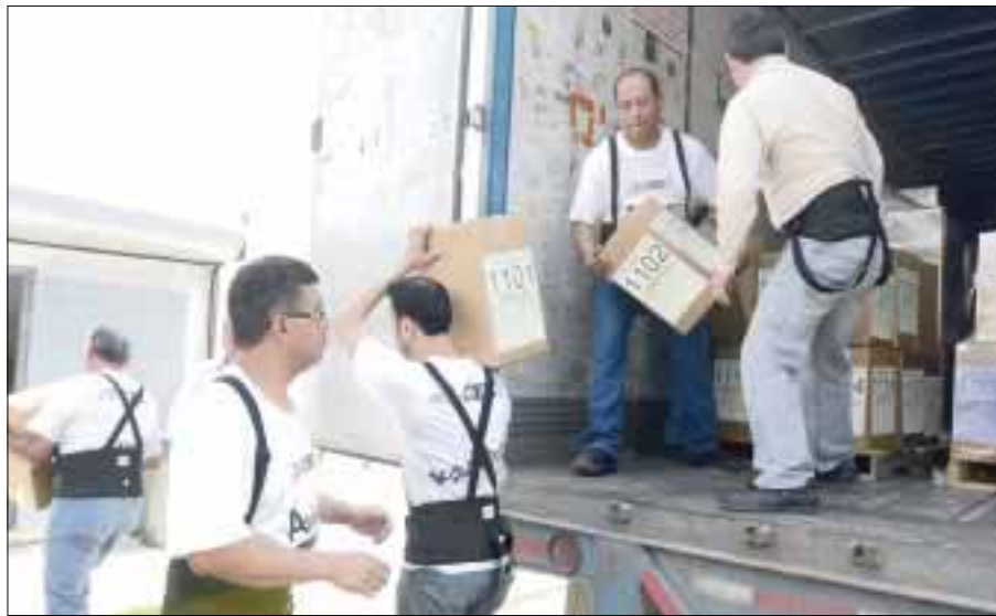
Morelos, Guerrero, Distrito Federal y el Estado de México serán los últimos en donde se entregará la documentación electoral.

El itinerario de cada ruta está trazado para saber con exactitud en dónde realizarán descansos, paradas o recarga de gasolina, además de que los camiones cuentan con rastreo satelital.