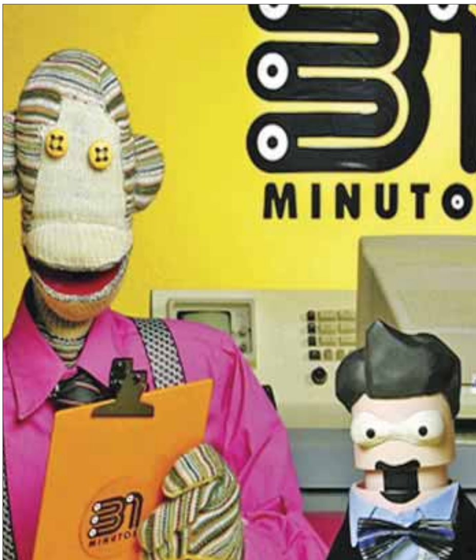
Uno de los espectáculos artísticos más importantes de Chile, 31 Minutos , el noticiero más veraz de la televisión, vuelve a la ciudad de México con su espectáculo Radio Guaripolo , donde el público podrá ser testigo de las ocurrencias de sus principales personajes.

Adelantó que también está por lanzar su libro “El lugar donde habitan tus sueños”, “Me voy a desnudar el alma, porque no soy una persona mentirosa cuando se ríe, no tengo poses, en este momento estoy muy contenta y por eso sonrío, soy muy positiva. Hice el libro que me sirvió como terapia, me enseñó, me sanó, pude notar que siempre he sido muy feliz, he sido chistosa, digo bobadas, meto la pata, me he caído pero me he levantado y he tenido una mano que me levanta, creo en Dios y siempre ha estado conmigo. El libro tiene 250 páginas, entre las que incluyo cartas que me escribo a mí misma, anécdotas, la más difícil narrar la muerte del papá de mi hijo, recordar eso fue muy duro”. El disco estará disponible a partir del 23 de junio, así como el libro tentativamente lo estará para el mes de agosto.