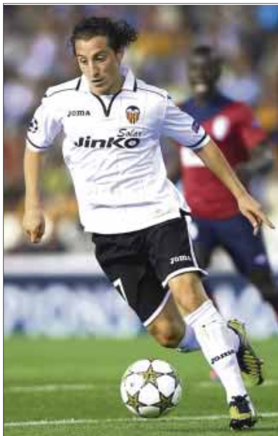
Andrés Guardado fue nombrado el Mejor Jugador de la Temporada 2014-2015 de la Liga Holandesa de Fútbol, por su actuación con el equipo PSV.

Del mismo modo, consideró que fue una de sus temporadas más consistentes, esto gracias a que “estoy en una edad en que ya no confundo si algo sale mal o el equipo no inicia bien”.