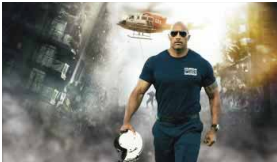
"Terremoto: La falla de San Andrés", que llegará a las salas mexicanas el 29 de mayo.

*** Con una sonrisa en el rostro fue como se pudo apreciar al actor, mejor conocido como "La Roca", durante su llegada a una plaza comercial capitalina, para reunirse con su público minutos antes de la premier de su reciente cinta