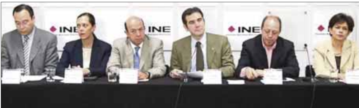
Lorenzo Córdova Vianello llamó a los partidos, los candidatos, los medios de comunicación y la sociedad a motivar una deliberación pública intensa e informada.

Refrendó su compromiso porque las elecciones se lleven a cabo de manera puntual, ordenada y con pleno apego a los principios constitucionales de certeza, legalidad, objetividad, independencia, imparcialidad y máxima publicidad.