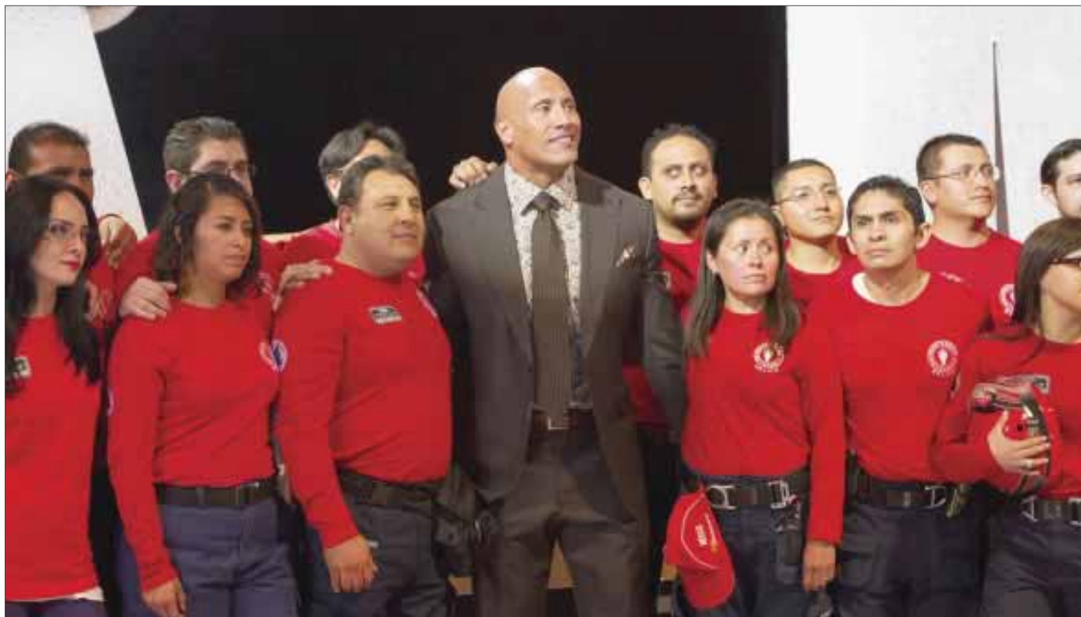
El famoso actor se tomó la foto con elementos de la brigada de rescate "Topos", de quienes exaltó su labor, "son verdaderos héroes anónimos y su trabajo es muy importante y yo los admiro", exclamó.

Así, el actor se dirigió al complejo cinematográfico para presentar su reciente filme "Terremoto: La falla de San Andrés", que llegará a las salas mexicanas el 29 de mayo.