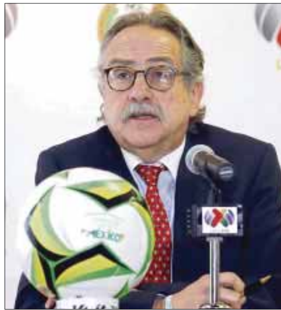
Justino Compeán se despedirá tras nueve años como máximo jerarca de la FMF.

Durante su gestión, pasaron nueve técnicos con el Tri mayor: Hugo Sánchez, el sueco Sven Goran Eriksson y Javier Aguirre, rumbo a Sudáfrica 2010, así como Efraín Flores y Enrique Meza, de manera interina, José Manuel de la Torre, Luis Fernando Tena, Víctor Manuel Vucetich y Miguel Herrera, de cara a Brasil 2014.