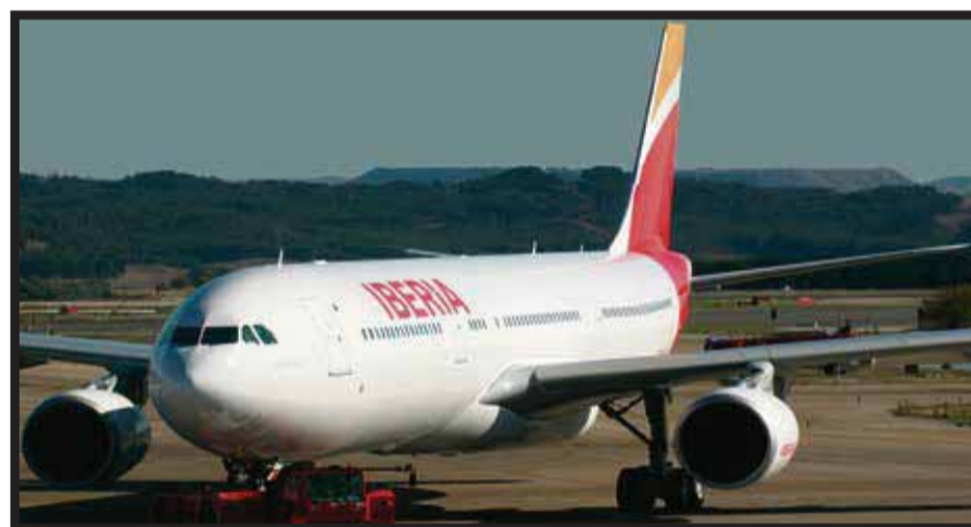
Las mejores opciones para menores viajando solos.

el regreso de la naviera a puertos mexicanos, se ofrecerá una atractiva promoción 2x1. Además, los niños menores de 16 años también viajarán gratis (sólo pagando sus impuestos), la vigencia será hasta el 31 de mayo.