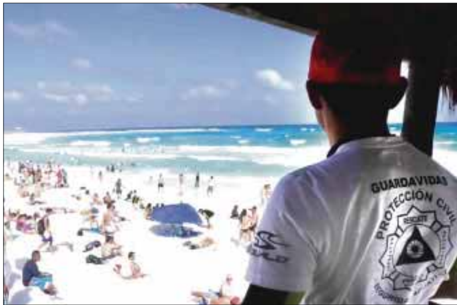
Las entidades que captan el turismo de recreación son Quintana Roo, Guerrero, Oaxaca y Baja California Sur.

son Quintana Roo, Guerrero, Oaxaca y Baja California Sur; el cultural, Distrito Federal, Yucatán, Querétaro, Guanajuato y Jalisco; y los hombres de negocios prefieren Nuevo León, Querétaro, el Distrito Federal, Estado de México, Jalisco y Chihuahua.