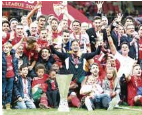
El conjunto de Unai Emery permitió que sus aficionados estallaran de júbilo, tal como ocurrió en 2006, 2007 y 2014.

Pero a pesar de su poderío, esta vez los "rojiblancos" tuvieron que exprimir al máximo su potencial ante el combinado ucraniano que no tenía nada que perder y que más allá de las dificultades extra cancha, le dieron una alegría a sus seguidores con este avance inédito.