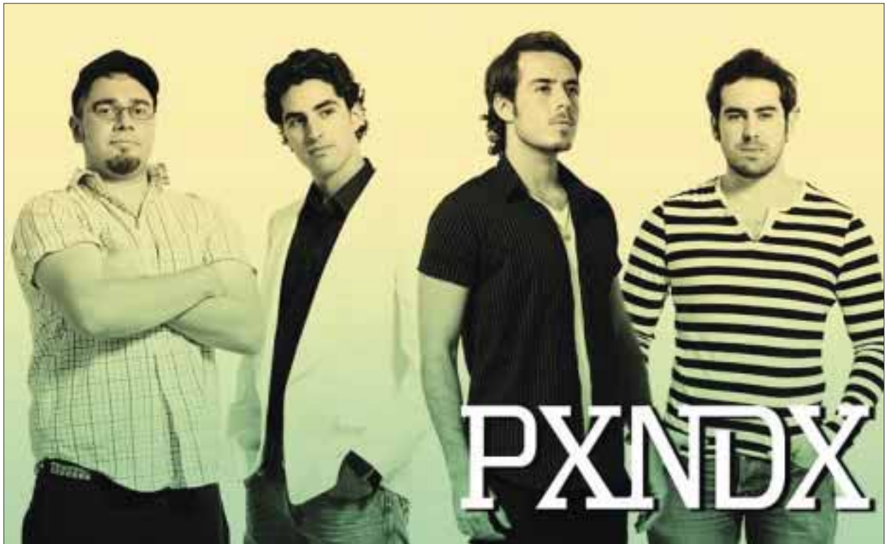
La banda regia PXNDX regresa a México y ofrecerá un concierto en el Palacio de los Deportes, para festejar sus 15 años de hacer bailar su rock ríspido, pero subrayadamente melódico.