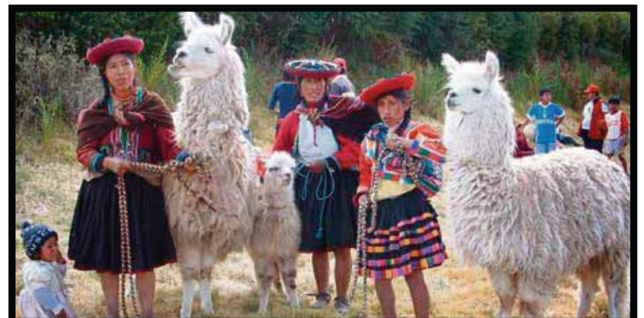
Familia peruana, con alpacas.