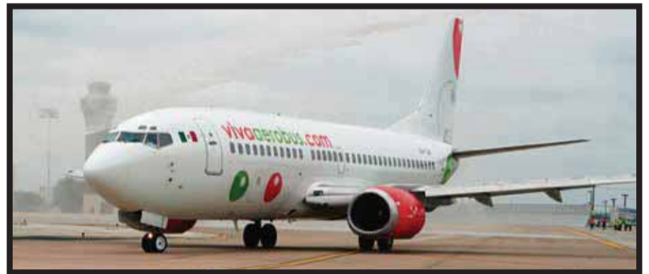
La aerolínea, preparada para el verano.

Más de la mitad de los encuestados (53%) espera que sus rendimientos se incrementen y 45% anticipa una ocupación mayor con respecto al verano de 2014. En contraparte, sólo 10% de