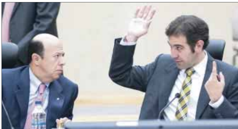
Lorenzo Córdova afirma las próximas elecciones serán unas de las más vigiladas y escrutadas por visitantes extranjeros.

Además, que sólo las personas con credencial para votar con fotografía puedan votar el día de las elecciones, salvo que se exhiba una resolución del Tribunal Electoral Federal que le autorice hacerlo.