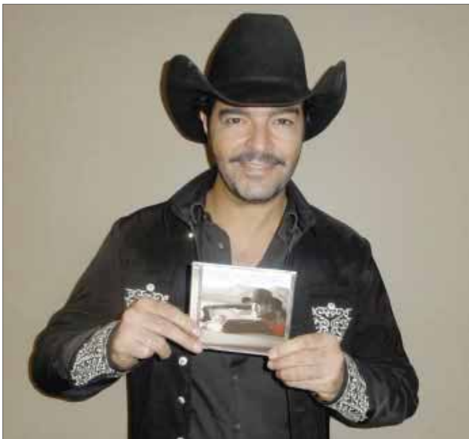
Pablo Montero presenta a DIARIO IMAGEN su nueva producción discográfica "No te quedes con la duda".

"No te quedes con la duda" está disponible en canales digitales, álbum que consta de grandes temas interpretados con el estilo inigualable de Pablo Montero.