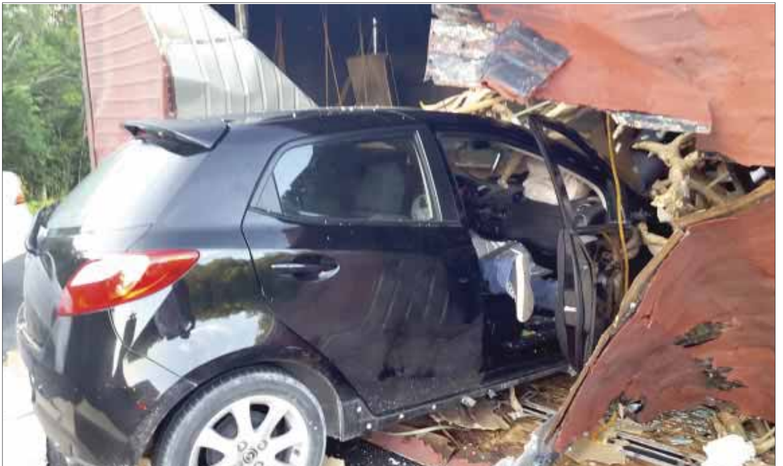
El chofer del auto compacto que resultó lesionado, se introdujo a la caja al no poder evadir el impacto.

En el lugar quedó lesionado el piloto del Mazda, que fue auxiliado por socorristas de Felipe Carrillo Puerto.