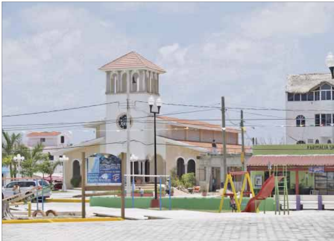
El casco viejo de Puerto Morelos , como es conocido, tiene una capacidad de 600 cuartos que han mantenido en esta temporada baja una ocupación promedio del 90 al 95 por ciento.

Adelantó que dentro de 15 días, se llevará a cabo un campeonato internacional de disco o platillo volador en el campo de Polo del Rey en la zona de los Cenotes entre Puerto Morelos y Leona Vicario que también atraerá a miles de visitantes.