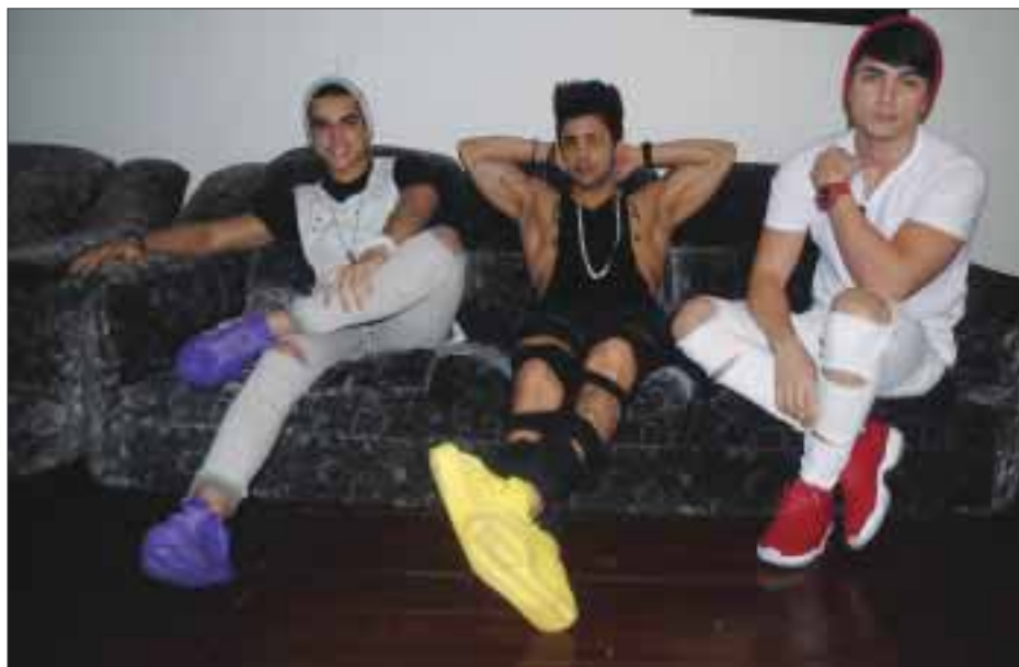
Estos Ángeles galanes visitaron la redacción de DIARIO IMAGEN y con una muy peculiar sencillez y humildad hablaron de su propuesta musical.

Las Jeans se presentarán este próximo 13, 14 y 15 de noviembre en el Teatro Metropolitano, en donde presentarán temas de su nueva producción discográfica, Deja Vú .