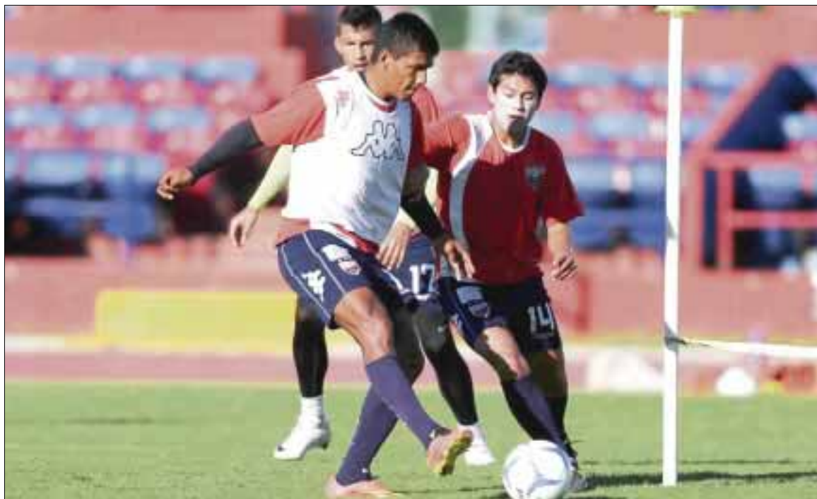
Con incertidumbre, Potros de Atlante partieron ayer a Zacatecas, donde enfrentarán a Mineros.

Cancún.- El entrenamiento de ayer jueves corrió sin contratiempos y el equipo tomó camino rumbo al aeropuerto de Cancún.