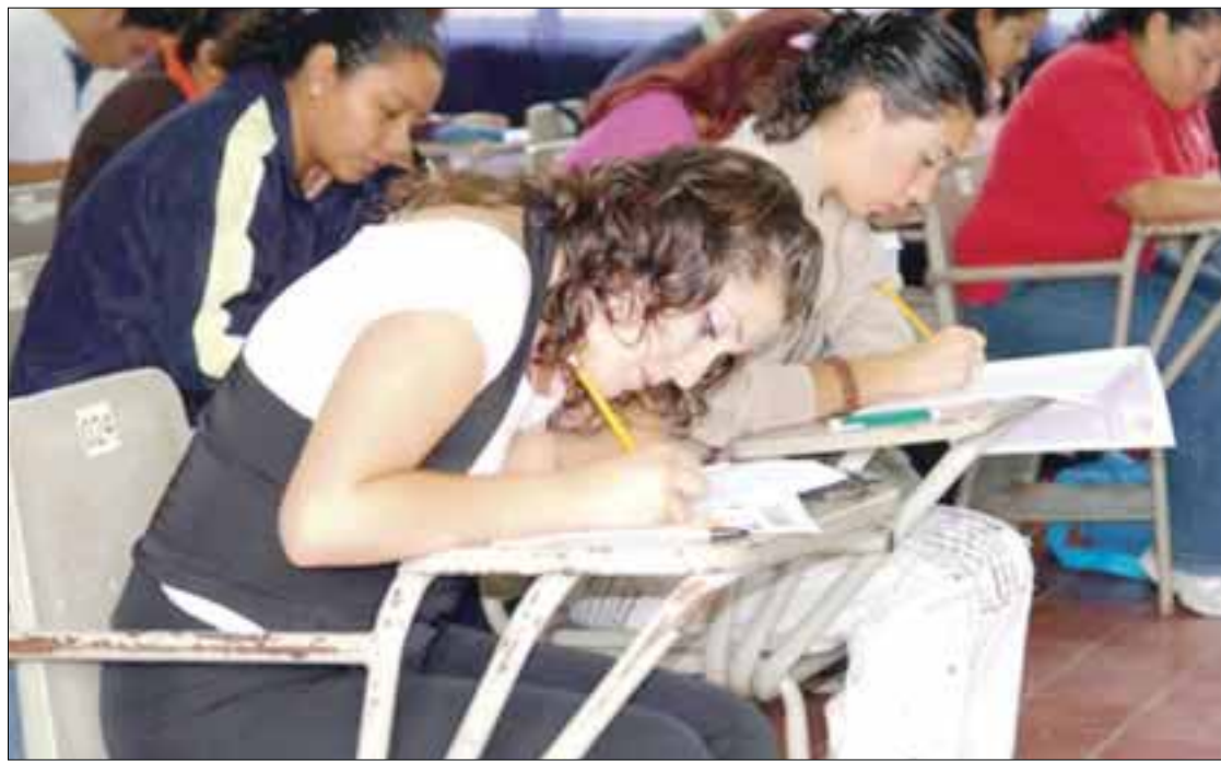
A partir del 14 de noviembre al 13 de diciembre próximos se aplicarán los instrumentos de la evaluación del desempeño para docentes y directores.

El resultado global y de cada uno de los instrumentos de la Evaluación del Desempeño, de conformidad con el Calendario 2015 establecido por el INEE, serán publicados a partir del 15 de febrero de 2016.