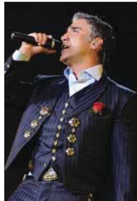
Alejandro Fernández dio a entender en su Twitter que él y Luis Miguel podrían unirse en una gira entre abril y noviembre del próximo año.

y una corbata con las iniciales LMAF (Luis Miguel-Alejandro Fernández), y los meses abril/noviembre.