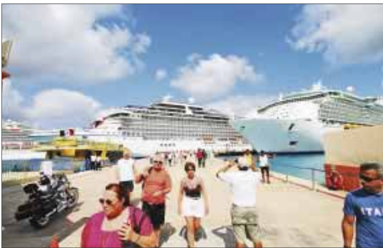
Esta semana llegarán 29 cruceros a Cozumel y cinco a Mahahual, con 81 mil 732 pasajeros a bordo.

Cozumel.- Arribarán a las costas del estado de Quintana Roo esta semana 29 cruceros a Cozumel y cinco a Mahahual, con 81 mil 732 pasajeros a bordo, informó la Administración Portuaria Integral de Quintana Roo (Apiqroo).