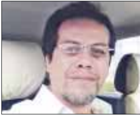
POR MAURICIO CONDE OLIVARES