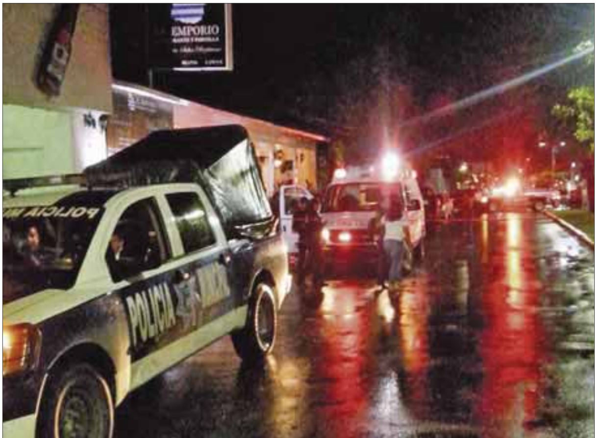
En noviembre del 2005 "El Español" se libró de un secuestro perpetrado por un grupo de "Zetas" que intentaron establecer una célula en el sur del estado.

En la Zona Libre de Belice, "El Español" tenía el negocio "La Casa de las Toallas" que es atendido por su esposa (de la que estaba separado) y su hijo, pero también se le atribuía una gran actividad en el negocio del contrabando de cigarros, licores y otros productos.