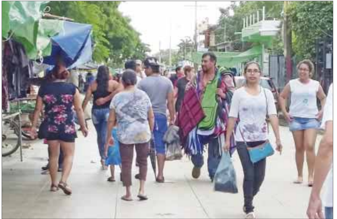
La Secretaría de Desarrollo Económico de Quintana Roo cuenta con una red de seis incubadoras de empresas, que se encuentran en: Benito Juárez (2); Othón P. Blanco (2); Solidaridad (1) y Tulum (1).

El número de asalariados representa el 75% del total de la población ocupada del estado, cinco puntos arriba del 70 por ciento que se registró hace 14 años. El promedio nacional es del 67.8 por ciento