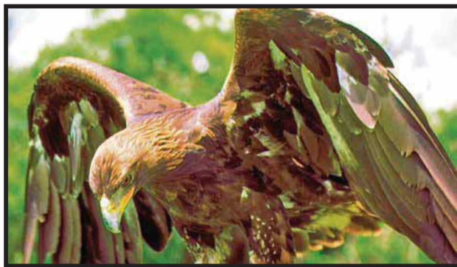
El águila real.

Hace unas semanas, se reunió con más de 100 líderes turísticos de Colombia para presentarles la nueva plataforma de negocios Travelinn y anunciar la construcción de un call center que atenderá la demanda y el interés de los colombianos por viajar al resto