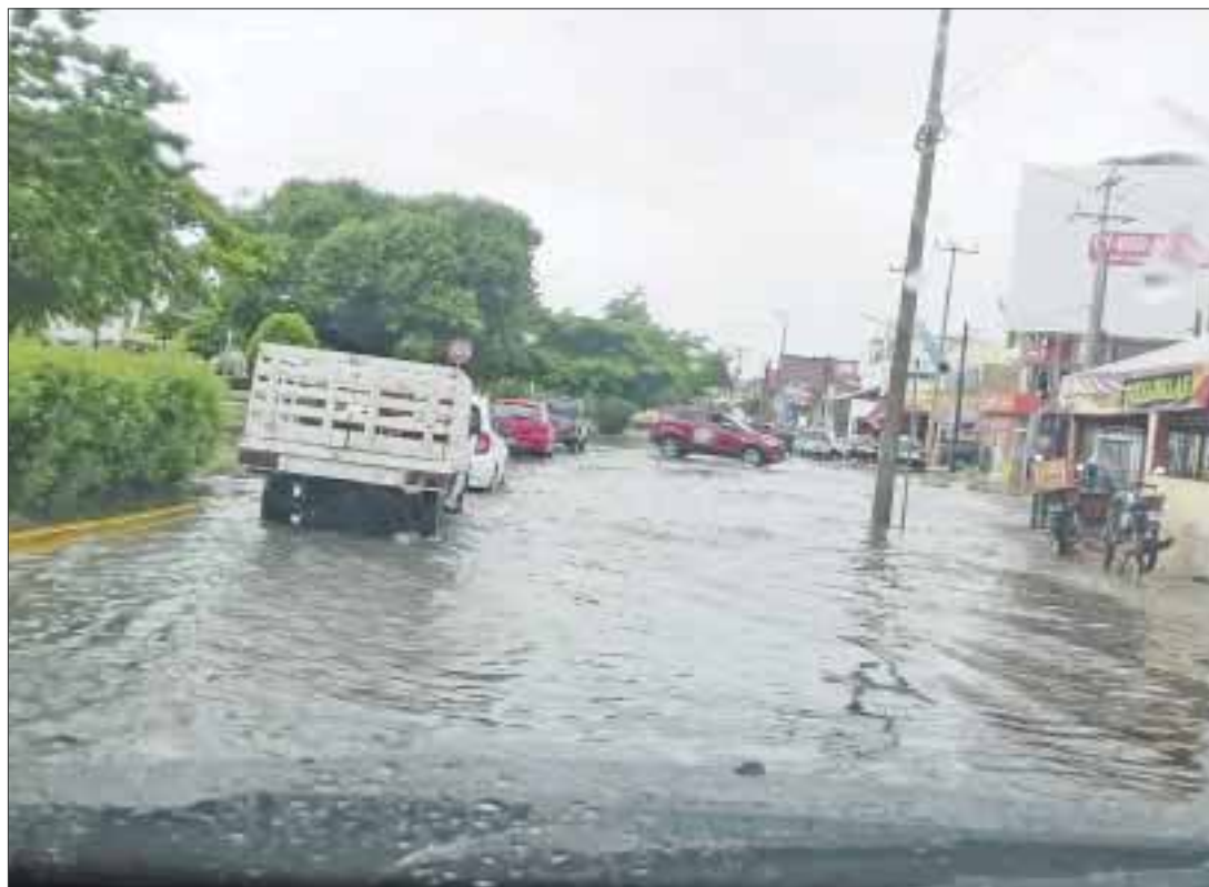
Las zonas más beneficiadas podrían ser el sur del estado, donde las lluvias no llegan a provocar encharcamientos, sino inundaciones severas.

Un sistema así prevé que sin llegar a ser un ciclón tendría que reunir a miembros de auxilio y emergencia en sesión a un comité con un sistema de aviso similar para ver las alternativas preventivas para la población.