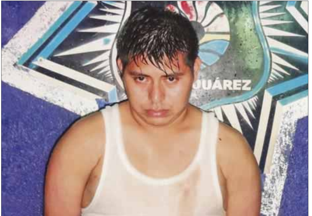
Gracias a que se encerró en el baño con el celular, la mujer pudo llamar a la policía y evitar que su marido la matara.

Al intentar llevarla al cuarto empezaron a forcejear ambos, instante que aprovechó dicho sujeto para a lesionarla en el abdomen, provocándole abundante sangrado. Con la versión de la fémica, los uniformados buscaron al presunto responsable por varias cuerdas de la colonia, hasta que lo encontraron, por lo que lo pusieron a disposición del Ministerio Público.