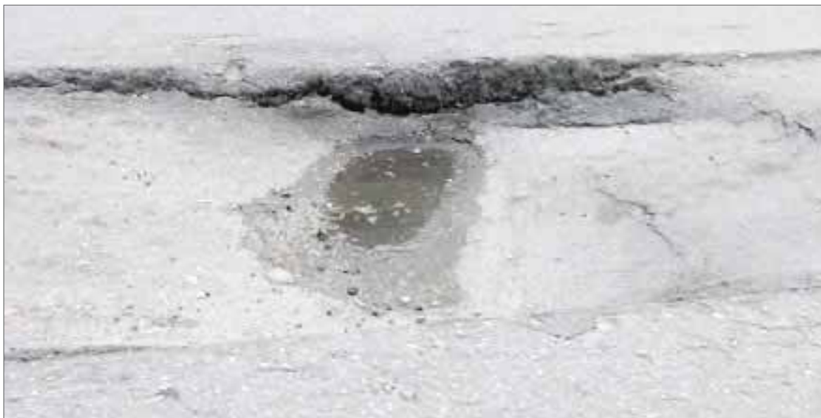
Un trabajo de introducción de cañería sanitaria colapsó por mal trabajo realizado por empleados de Aguakan.

Cancún.- Habitantes de la supermanzana 66 reportaron un "minisocavón" frente a la manzana 02 calle 18, el que lleva más de tres semanas.