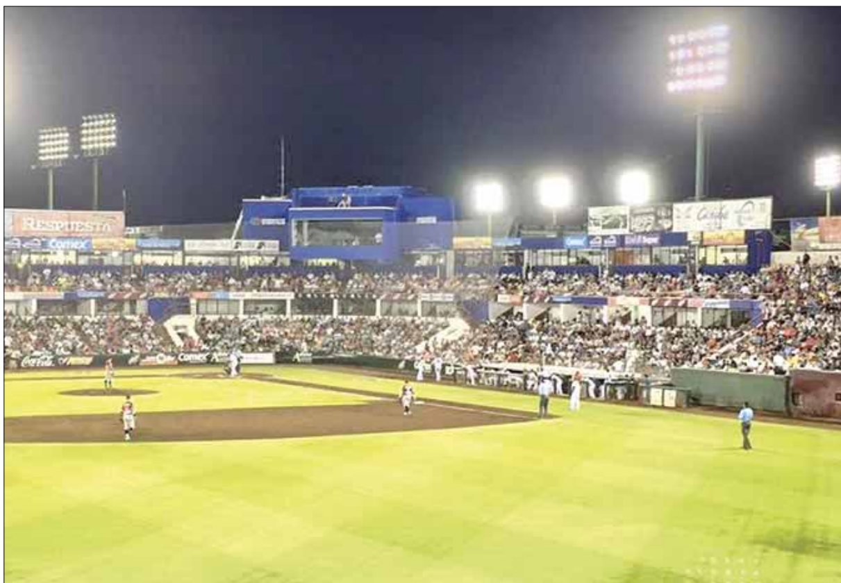
Con gran historia y sede de muchos partidos, el parque de pelota "Beto" Ávila cumplió ayer 35 años de fundado.

Los Tigres de Quintana Roo cumplieron en este 2015 su novena temporada teniendo como sede la ciudad de Cancún, y en específico el estadio Beto Ávila ubicado en la súper manzana 21.