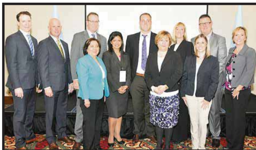
Misión de Marriott se reunió con los medios de comunicación (Foto: JAIME A. ARROYO OLÍN).

Por otra parte, explicó que el estado de Texas cuenta con nuevas opciones de Hoteles Marriott . En 2016 se espera la apertura de un Houston Marquis . Al referirse al JW Marriott en San Antonio, señaló que tuvo una remodelación de 14 millones de dólares, y en él se está construyendo un parque acuático que abrirá en 2016. En Dallas Texas, la cadena hotelera tiene un Renaissance Dallas Richardson Hotel , que brinda servicio excepcional a sus huéspedes con agradables instalaciones como un jardín botánico emblemático estilo atrio con obras de arte de cristal.