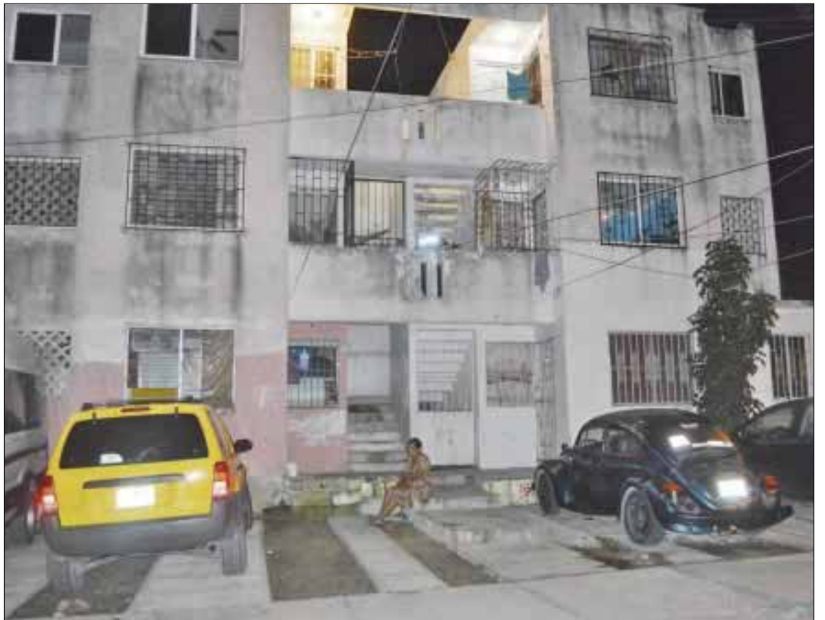
Una joven de 20 años, que vivía con su pareja del mismo sexo, decidió ser la suicida número 51, debido a un ataque de celos.

Explicó que antes del suicidio ambas ingerían bebidas embriagantes en un bar con otras mujeres, pero Estefanía se puso celosa y se fue a su casa