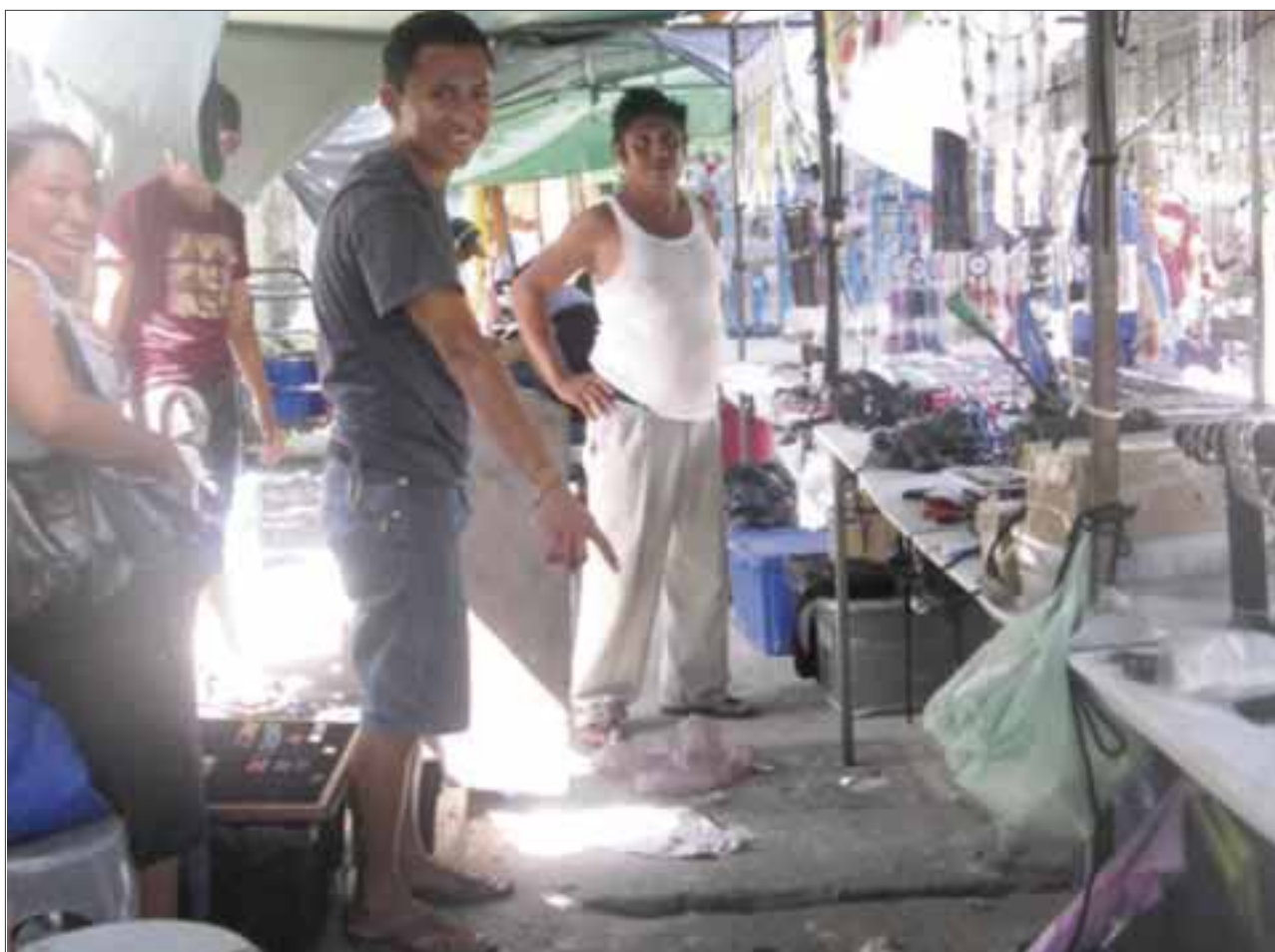
Los tianguistas de las regiones 100 y 101, el más grande de Cancún, piden a gritos que sea desazolvado un pozo de absorción que está generando olores pestilentes en una amplia zona.

Por otra parte, en el tianguis de los jueves en la segunda entrada de la región 94, a una cuadra de la avenida donde está la iglesia y la escuela, no tapan los hoyos, porque sólo repararon unas cuantas calles y otras quedaron inconclusas y cuando llueve es un problema. Ya tiene mucho tiempo, pasan gobiernos y no han hecho nada”.