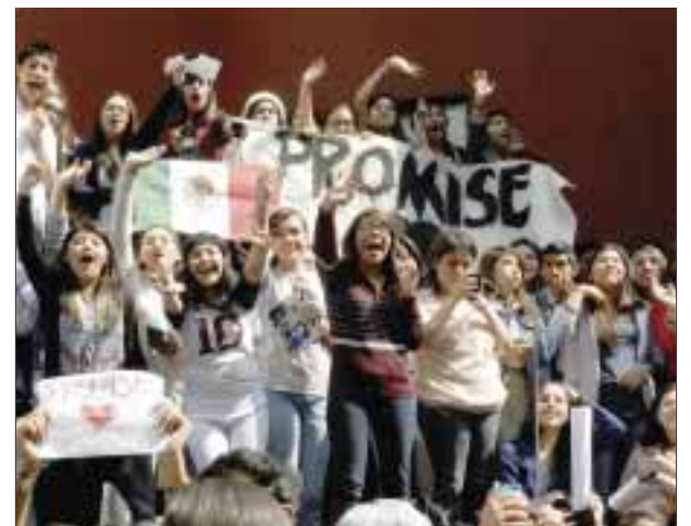
El Four Seasons de Paseo de la Reforma se convirtió en un auténtico carnaval, en el que las jovencitas, vestidas con gorras y playeras de la banda, no pararon de gritar y de emocionarse cada vez que alguna de las cortinas en las ventanas del hotel se movía.

Para finalizar el 2015, Liam Payne manifestó: "queremos relajarnos, estar con nuestras familias, nuestra agenda está totalmente llena, a veces no podemos ver a nuestras familias tanto como quisiéramos, pero hemos hecho cosas maravillosas en todos estos años".