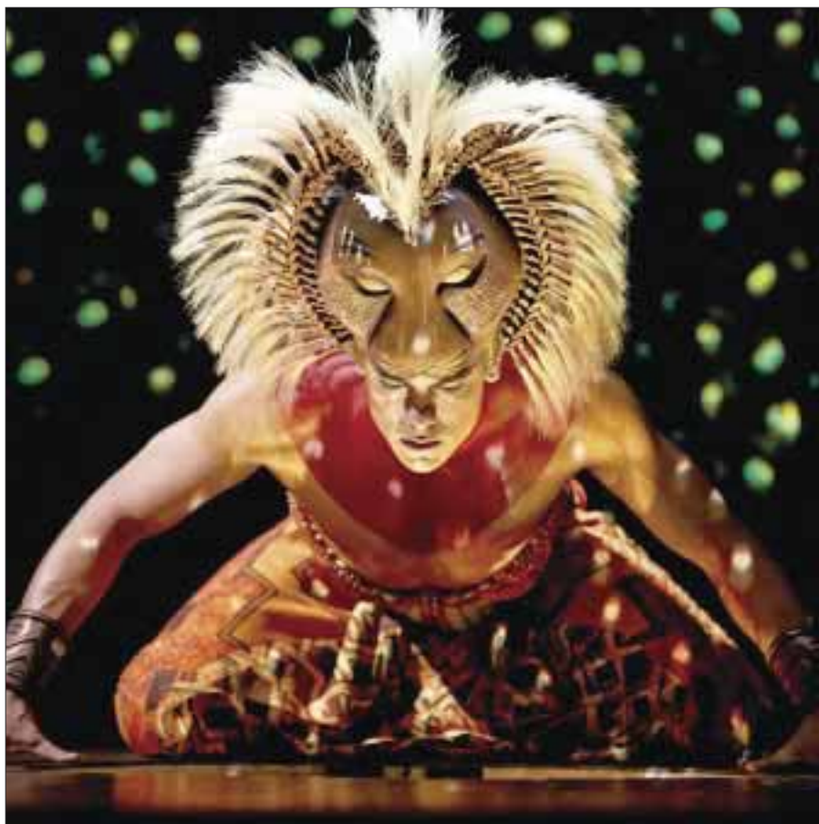
El video se estrenó en Wired.com.

Por segundo año consecutivo celebramos la belleza de todas las mujeres que no miden más de 1.50 m, en un espectacular certamen lleno de música, glamour y belleza.