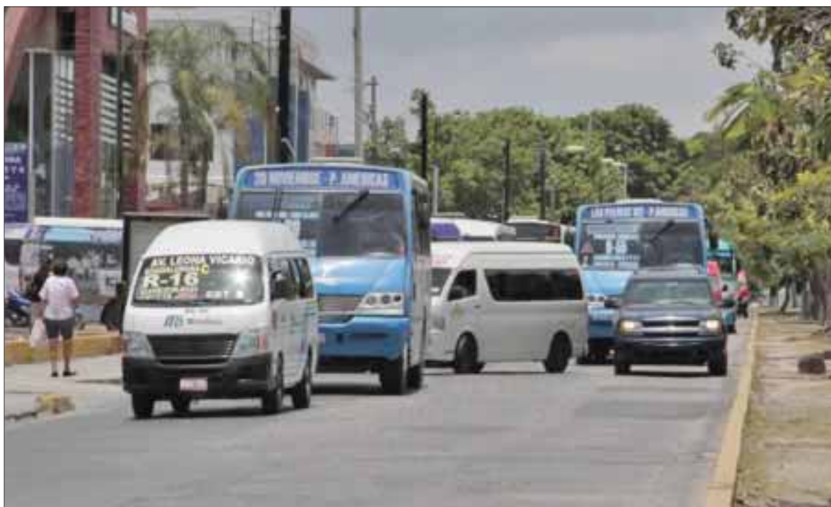
El aumento de la circulación de unidades motoras se hace sentir en la zona norte del estado, en donde el tráfico vehicular de algunas arterias permanece congestionado.

El segmento aporta 23.40 por ciento de los vehículos en la entidad. Los camiones de pasajeros sumaron 2 mil 344 unidades, con una avance de 14.12 por ciento. Pero en el último año 52 unidades se dieron de baja.