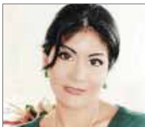
POR YOLANDA MONTALVO