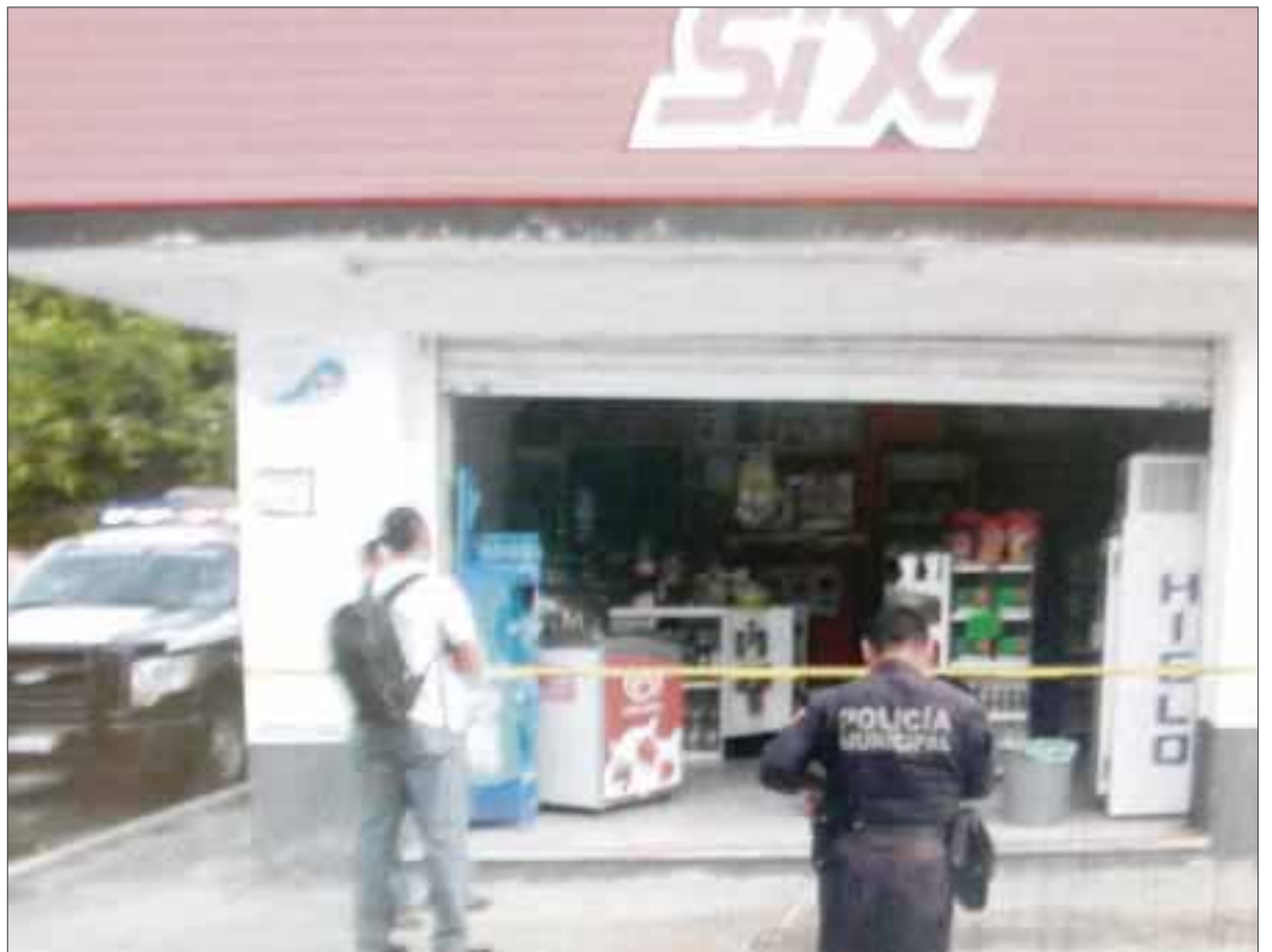
Varios negocios de la 11 Avenida han sido objeto de robo, debido a la poca vigilancia policial.

Por su parte el propietario del negocio de junto que se dedica a la venta de muebles, pide a las autoridades investigar los casos y prevenir a los comerciantes de la zona que puedan ser propensos al robo.