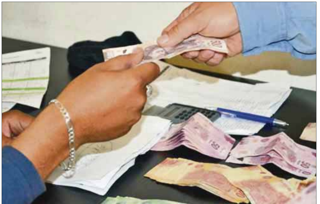
Setenta millones de pesos se les pagará a los trabajadores de confianza y personal sindicalizado del ayuntamiento de Benito Juárez por aguinaldo y prestaciones de ley.

Aunque se incrementa un poco la cifra a pagar, la oficial mayor consideró que al final quedan en el mismo rango ya que cuando se dio de baja a algunos trabajadores, no necesariamente se recontrató a igual número de personas que se dieron de baja.