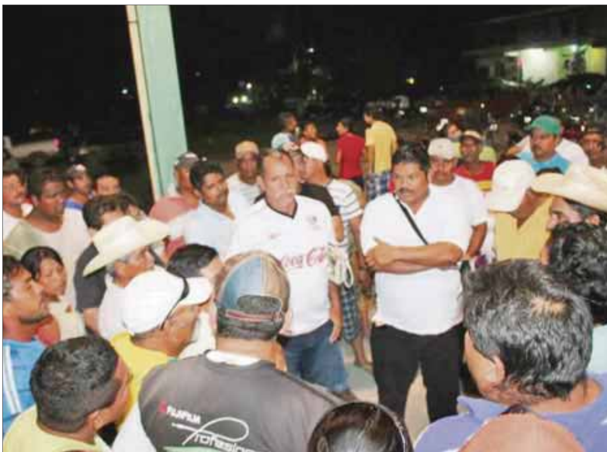
Ayer realizaron un bloqueo en la carrera federal que duró tres horas.

Chetumal.- Pobladores de Carlos A. Madrazo han amenazado con realizar de nueva cuenta un bloqueo carretero con la finalidad que sean liberadas tres personas que fueron detenidas por agentes ministeriales sin orden de aprehensión.