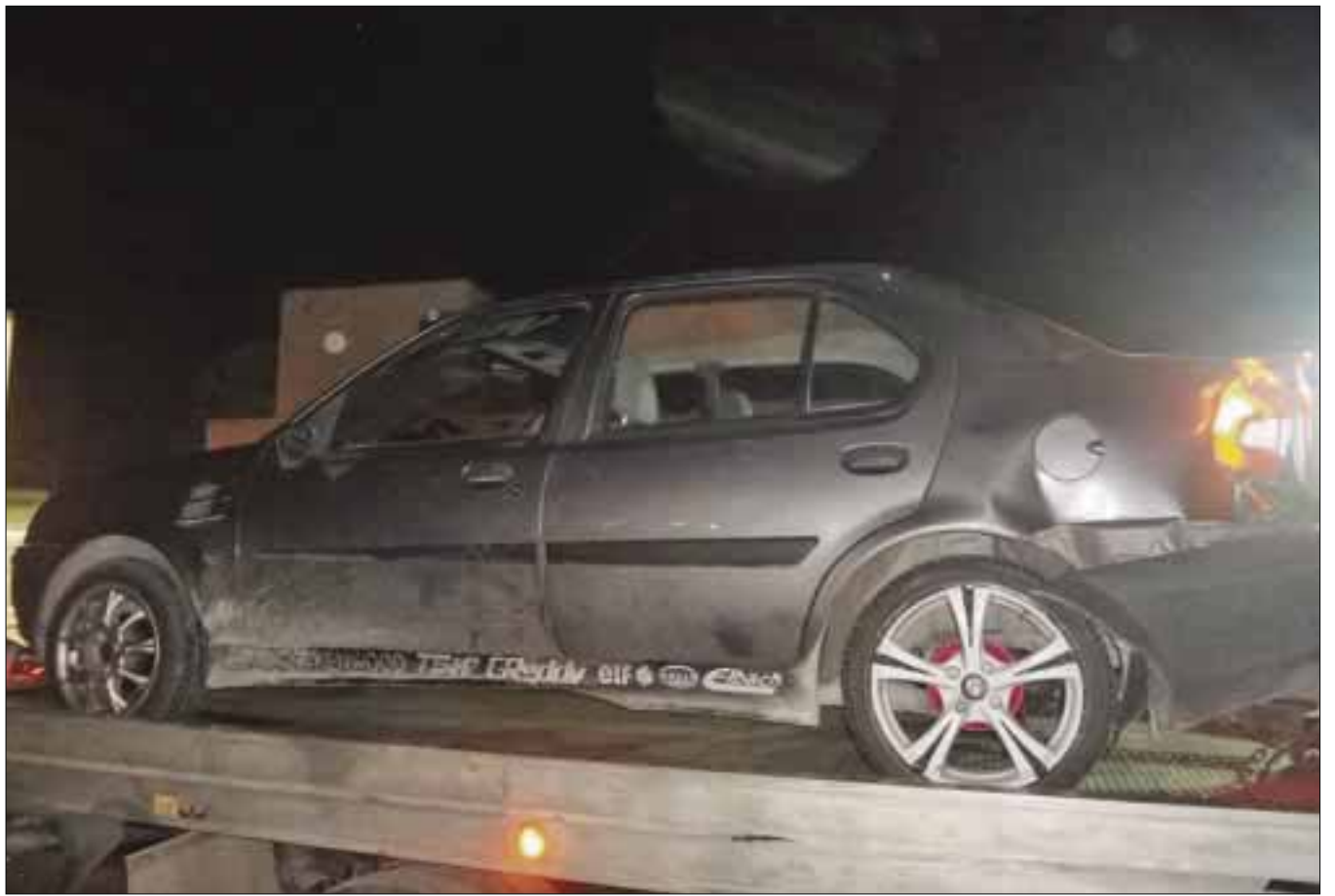
Luego de ser sorprendido en actos inmorales, un menor intentó darse a la fuga a bordo de este auto sobre avenida Bonampak.

Ya en la comandancia, fueron llamados los padres de ambos menores, los cuales no daban crédito a lo que sus hijos estaban haciendo.