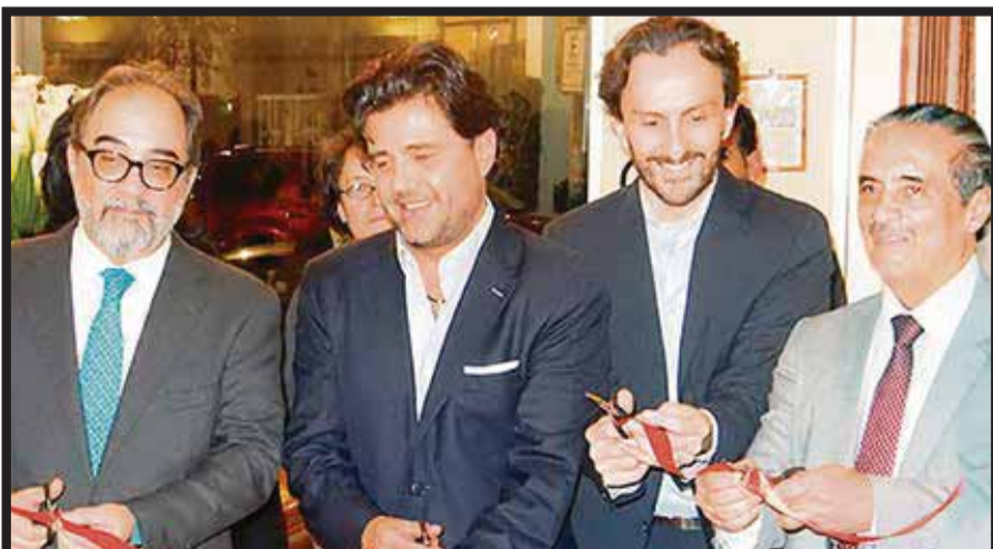
En la inauguración de Mard's Galería.

Pero además, la nueva galería ofrece experiencias culinarias que procuran "cuidar la tradición de