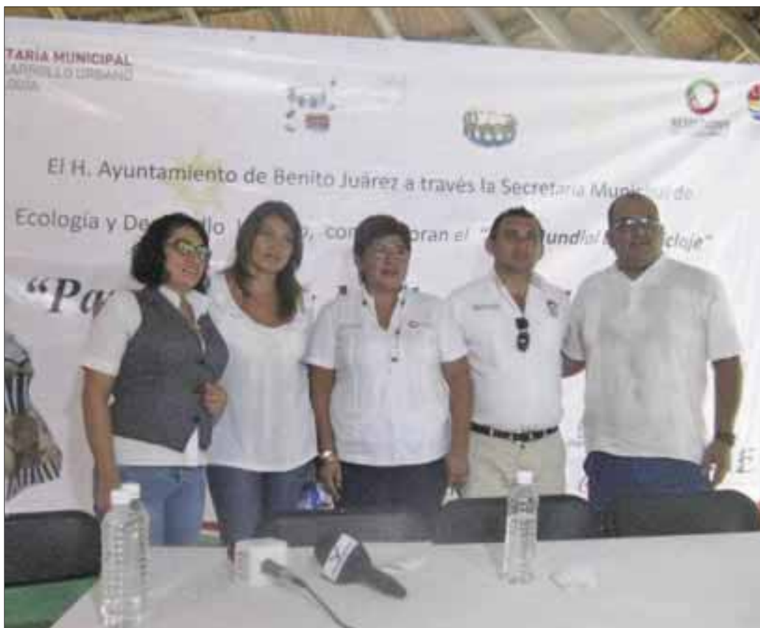
Las organizaciones civiles que participan en la conmemoración del Día Mundial del Reciclaje, presentarán mañana una exposición de accesorios.

Los patrocinadores de premios sorpresa, son: el hotel Ritz Carlton, Haciendas Cancún, Coca-Cola, el grupo inmobiliario Vivo, Arsa Caribe y Vtrolisa, ya que crear conciencia del medio ambiente es responsabilidad de todos