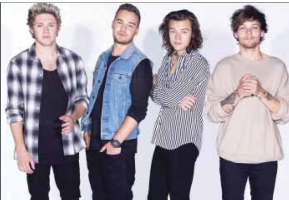
One Direction ya está en México.