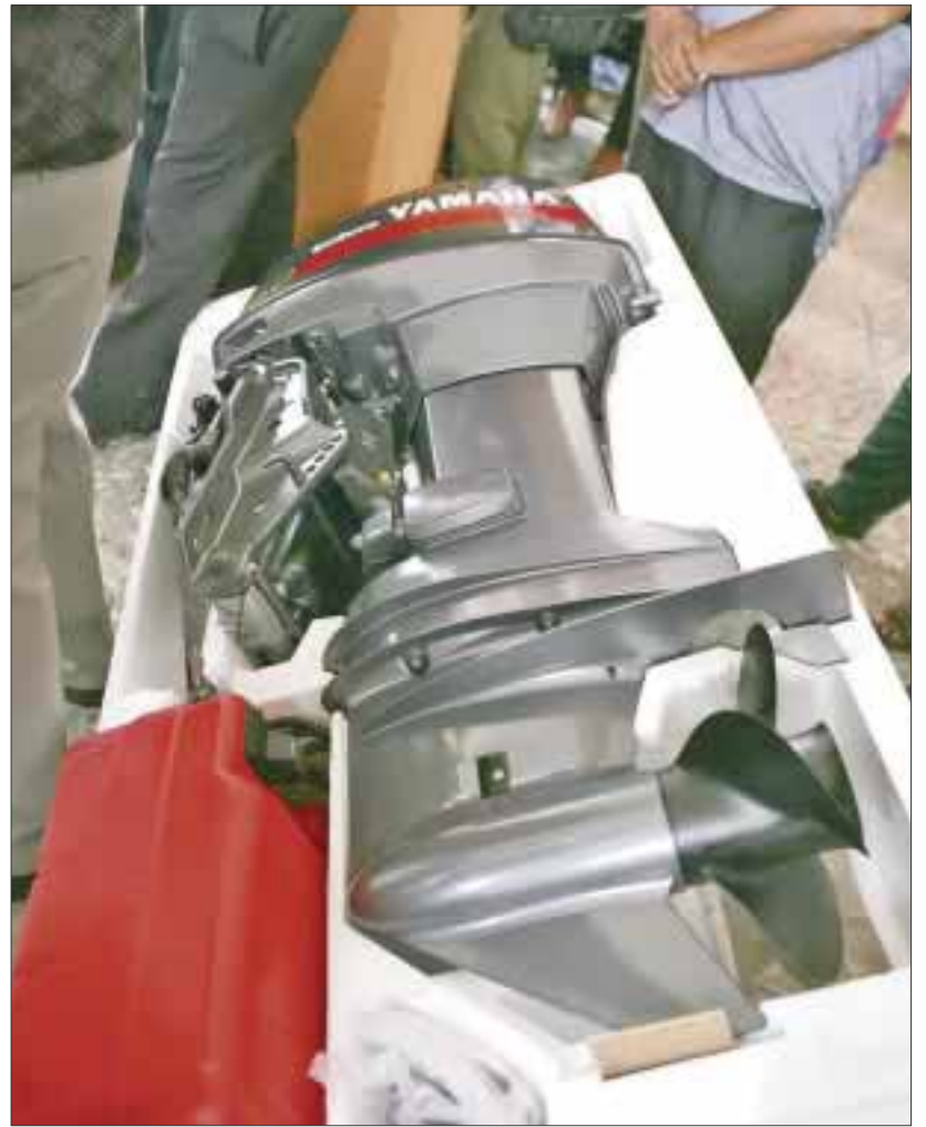
En el estado se generan 4 mil toneladas de productos marinos al año, lo que representa 160 millones de pesos.

Los municipios que serán beneficiados son Benito Juárez, Cozumel, Carrillo Puerto, Isla Mujeres, Lázaro Cárdenas, Cozumel, Tulum y Othón P. Blanco