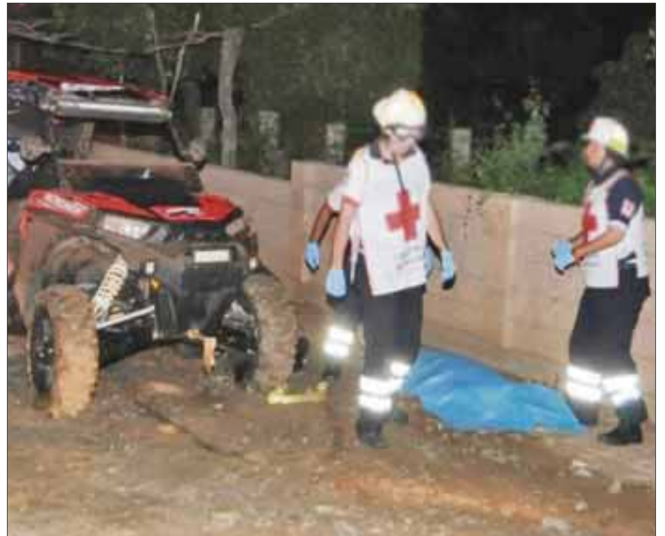
El segundo asesino confesó que mataron a "La Pava", porque se tomó gran parte del licor de caña que habían comprado.

El presunto asesino dijo, que al igual que Sánchez Saraoz, se molestó porque el ahora occiso se había acabado la última botella de licor, por lo que lo agarraron a golpes hasta matarlo