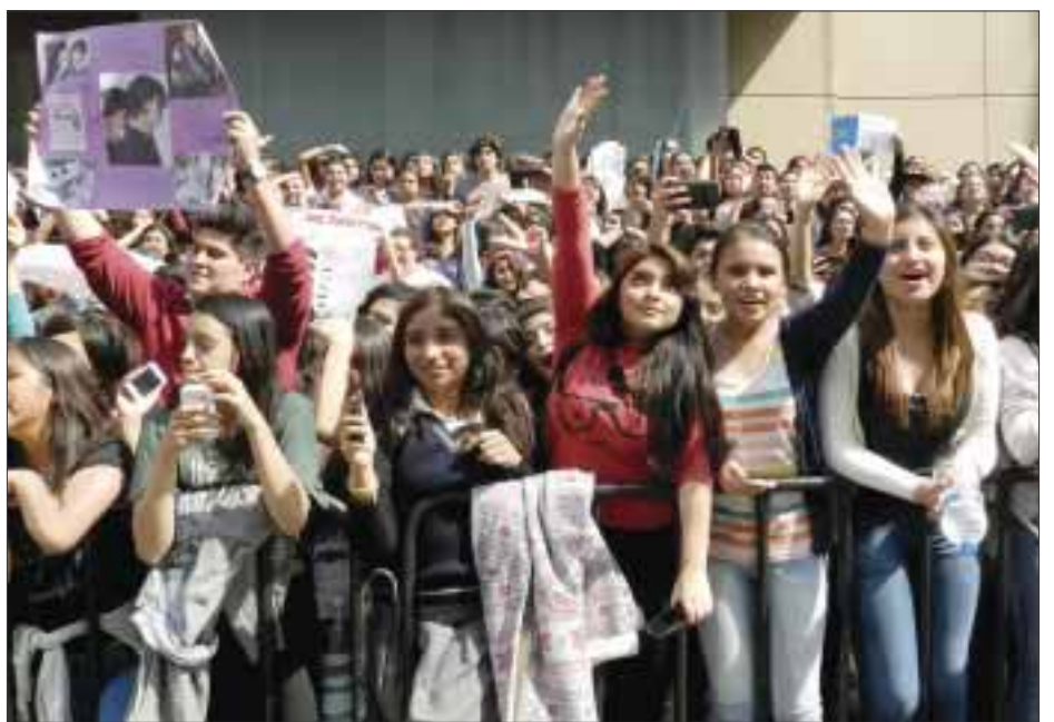
Al ritmo de "Cielito lindo" es como las cientos de fans de One Direction hicieron guardia a las afueras del hotel Four Season, en el que la banda británica se hospeda, esperando verlos por lo menos unos segundos.

to comercial ganando el puesto número uno la lista de popularidad del Reino Unido y la lista de ventas de los Estados Unidos, que son las posiciones más altas conseguidas en dichos ranking de la banda; igualando a What Makes You Beautiful, Little Things y One Way or Another (Teenage Kicks) en el caso británico, y a Live While We're Young y Best Song Ever en el americano: "de lo que más hemos aprendido es el uno sobre el otro, hemos estado juntos tanto tiempo, solemos pasar juntos nuestra adolescencia, entonces hemos aprendidos de cómo es cada uno de nosotros, hemos aprendido a trabajar en un estudio, antes no teníamos ni idea de lo que se trataba ni qué hacer, a lo largo de este tiempo estamos más preparados para eso", dijo Tomlinson.