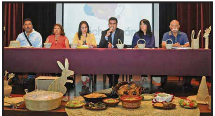
En la presentación de la Feria Nacional del Pulque.