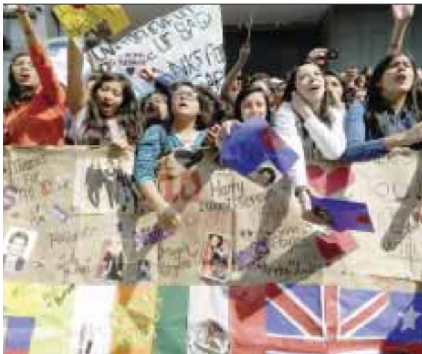
"¡Que salgan, que salgan, que salgan!", fueron algunos de los cánticos que entonaron las fans, que llegaron de todas partes de la ciudad y algunas, incluso, del interior de la República.

Sobre su estancia en nuestro país, en el que se presentarán en el concierto de los Premios Telehit en el Foro Sol, Horan comentó que "estar aquí en México es increíble, los fans son sensacionales, nos encanta hacer música, tocarla, hacer conciertos en todo el mundo, jamás nos esperamos lo que en este país iba a suceder, venimos a México con mucha emoción, y estamos muy agradecidos". Las canciones que incluye Made in the A.M son: Hey Angel, Drag me down, Perfect, Infinity, End of the day, If I could fly, Long way down, Never enough, Olivia, What a feeling, Love you goodbye, I Want to Write You a Song, History . La versión deluxe contiene los temas extras: Temporary Fix, Walking In The Wind, Wolves, A.M.