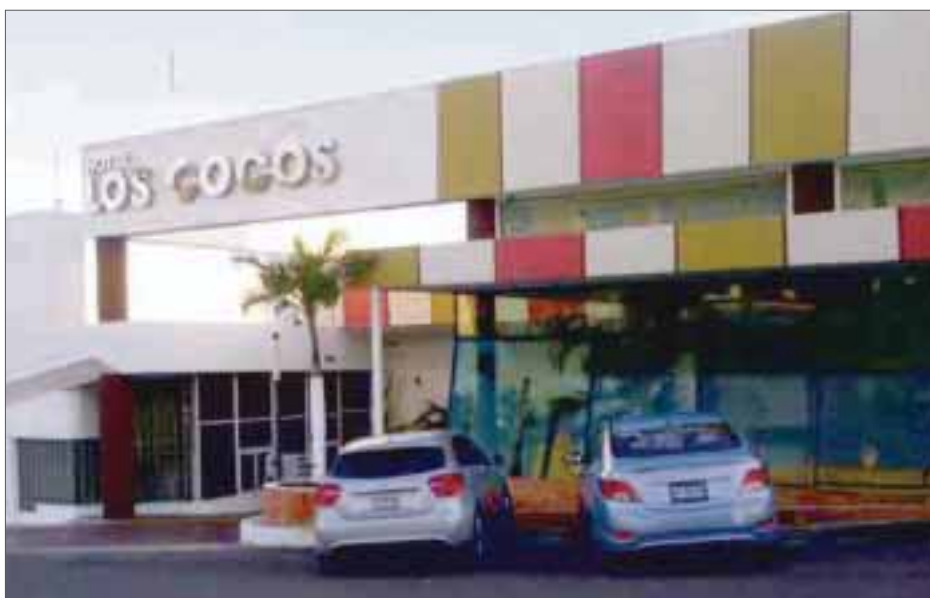
La madrugada del pasado martes una mujer fue violada en el interior de un hotel, lo cual preocupa a los empresarios.

Chetumal.- Empresarios coinciden en señalar la desenfrenada inseguridad que vive el estado, y por ello demandan atender los focos rojos ante la ola de violencia.