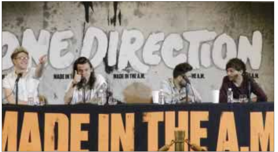
"Estamos seguros que el secreto del éxito siempre ha sido ser nosotros mismos, y el hacer un mejor álbum cada vez", exclamaron en conferencia de prensa los integrantes de One Direction.

El primer sencillo "Drag Me Down" fue un todo un éxi-