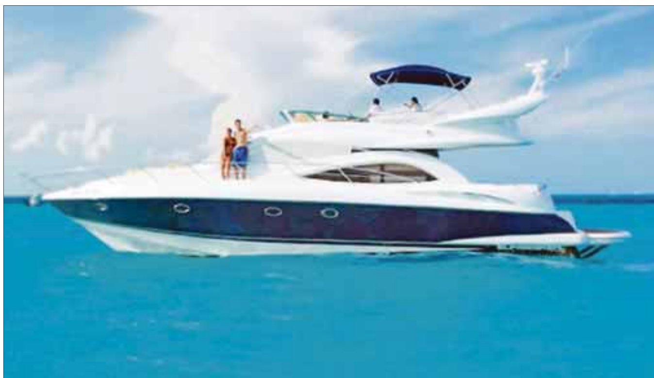
Pérdidas por 300 mil dólares por día registraron los náuticos en Cancún durante tres días de suspensión de actividades por el cierre del puerto por los fuertes vientos.

Cancún.- Pérdidas por 300 mil dólares por día registraron los náuticos en Cancún durante tres días de suspensión de actividades por el cierre del puerto por los fuertes vientos de hasta 50 kilómetros por hora que se sintieron en las últimas horas.