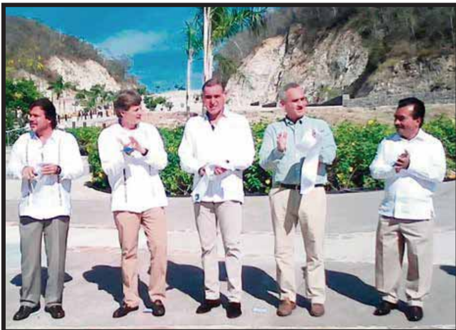
Corte de listón de la primera etapa de mejoramiento de San Agustínillo.

El turismo en Oaxaca debe seguir siendo un factor de desarrollo donde se combinan costumbres,