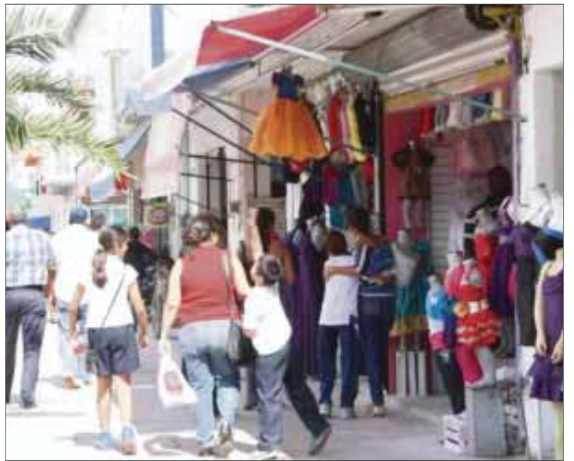
Revela STPS que existe nulo índice que quejas de falta de pago de aguinaldo.

El año pasado alrededor de 750 empresas fueron verificadas y en este 2015 se espera una cifra similar; por ello, las invitó a cumplir en tiempo y forma con esta obligación