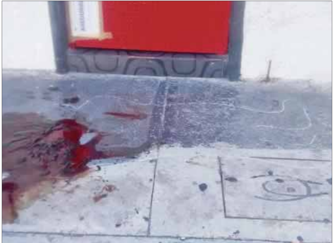
Testigos hablan de una discusión del comandante del EMAP con el integrante de un grupo de ocho sujetos.