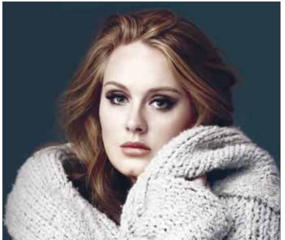
Adele logra la mejor marca para un disco en una semana desde que en 1991 Nielsen SoundScan comenzó a registrar las ventas.

Finalmente, se dijo con ganas de tocar en Vive Latino “Nosotros estamos con los dedos cruzados para que nos inviten, no sabría decirte con certeza la posibilidad que hay de ello, pero ojalá, porque es el más importante en Latinoamérica, por el cartel, llevan lo mejor tanto mexicano como internacional”.