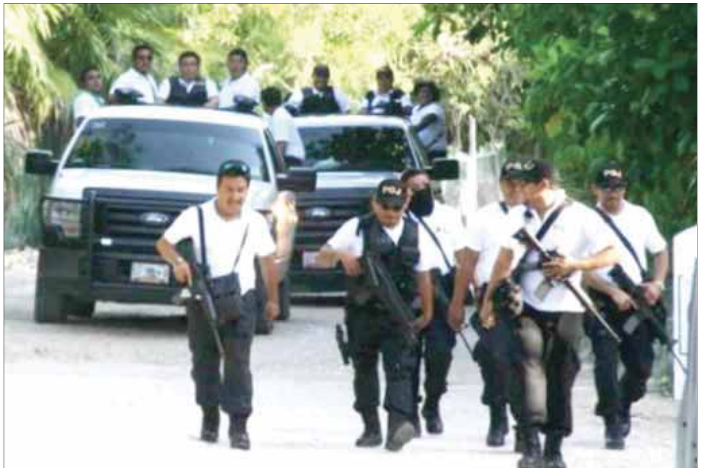
El homicidio es otro delito común en Quintana Roo.

En el caso de homicidios, que es otro delito en Quintana Roo, se registraron 317, de los cuales 199 fueron en Benito Juárez y 31 en Othón P. Blanco.