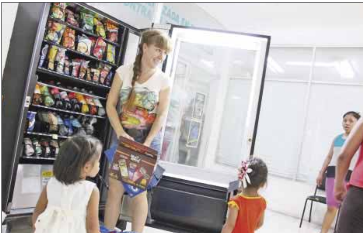
Usuarios de la Procuraduría se ven defraudados por máquinas de comida chatarra , que entraron junto con los nuevos mandos.

Cancún.- Además de robar energía eléctrica al edificio público que ocupa la Subprocuraduría de Justicia en esta ciudad, las cinco máquinas despachadoras de comida chatarra, también roban a los usuarios quienes molestos siempre golpean y hasta rompen los aparatos para que les devuelva sus monedas.