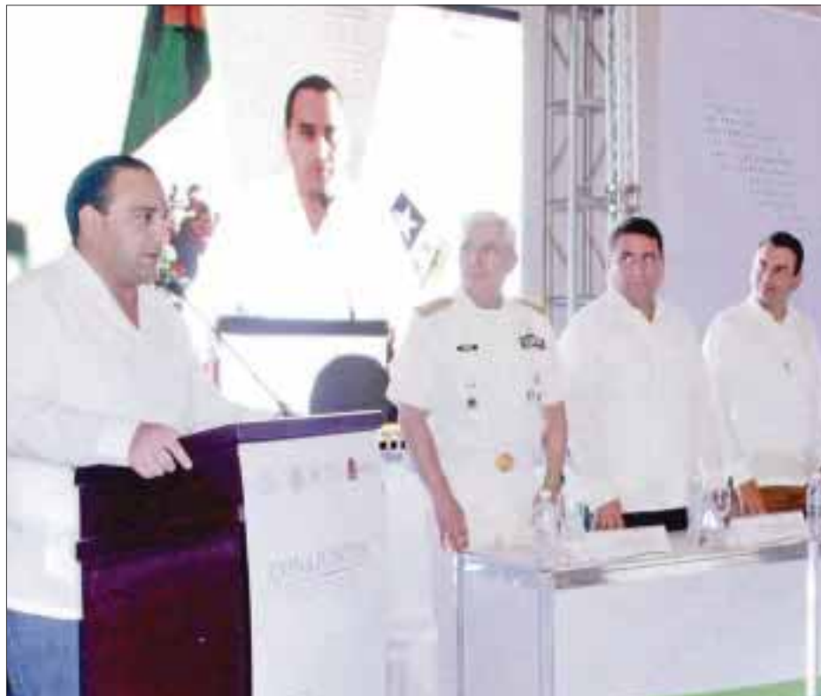
El gobernador Roberto Borge inauguró a Conferencia Nacional de Juntas de Conciliación y Arbitraje.

En ese contexto, Borge Angulo hizo hincapié en que no se puede concebir la política laboral separa-