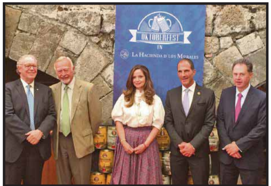
Durante la presentación del Oktoberfest en La Hacienda de los Morales.

La experiencia, el arte culinario, además de una grandiosa arquitectura, serán los valores con los que La Hacienda de los Morales enmarcará