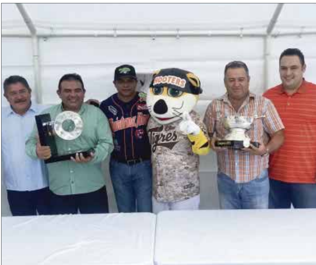
Los trofeos que acreditan a los Tigres como monarcas de la Copa del Rey, iniciaron su travesía por la ciudad, como lo había anunciado la directiva felina.

En el primer cuarto las Mambas desperdiciaron un buen número de oportunidades, sin embargo, fallaron en varias jugadas, dejando de esta manera la oportunidad de abrir el contador