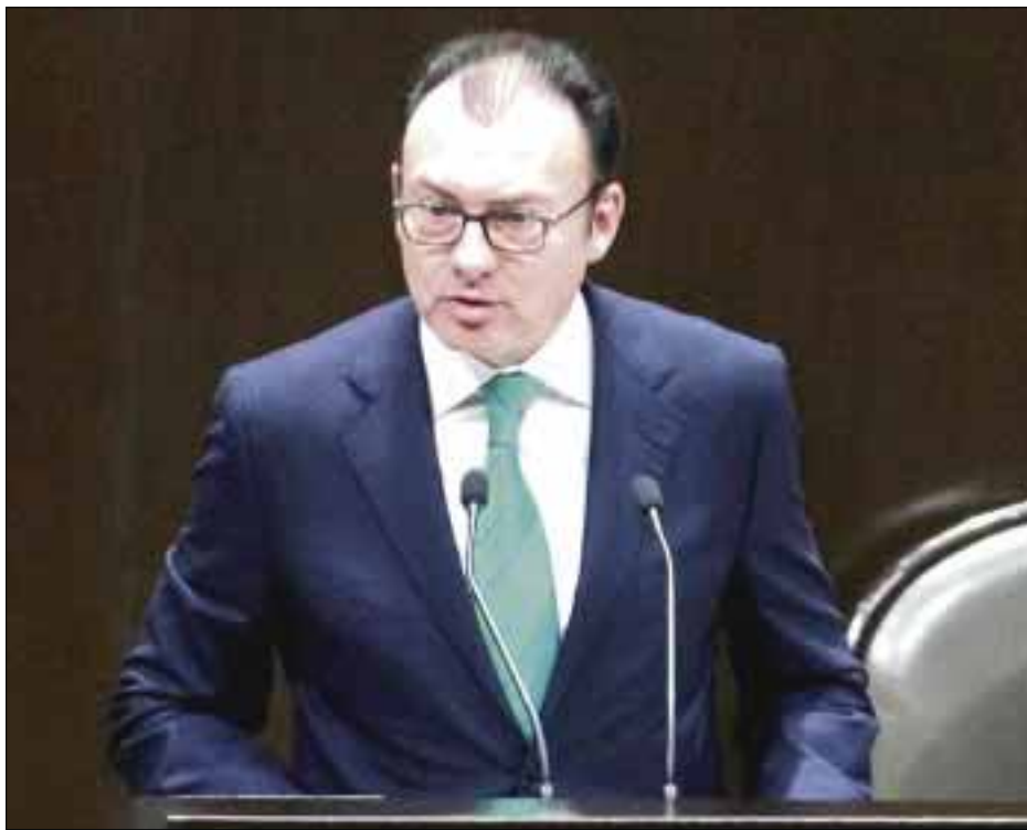
El secretario de Hacienda, Luis Videgaray Caso, compareció ante el pleno de la Cámara de Diputados.

Reiteró su disposición a llevar a cabo un diálogo entre poderes para que los legisladores tengan mayores elementos para una discusión de altura y cons-