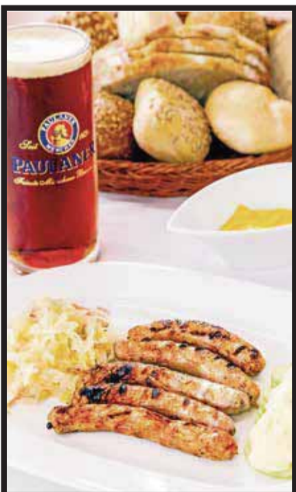
Salchicha Nürnberger, una de las variedades.

Así, La Hacienda de los Morales te ofrecerá una auténtica celebración con música y todo el folclor de la tradicional fiesta alemana.