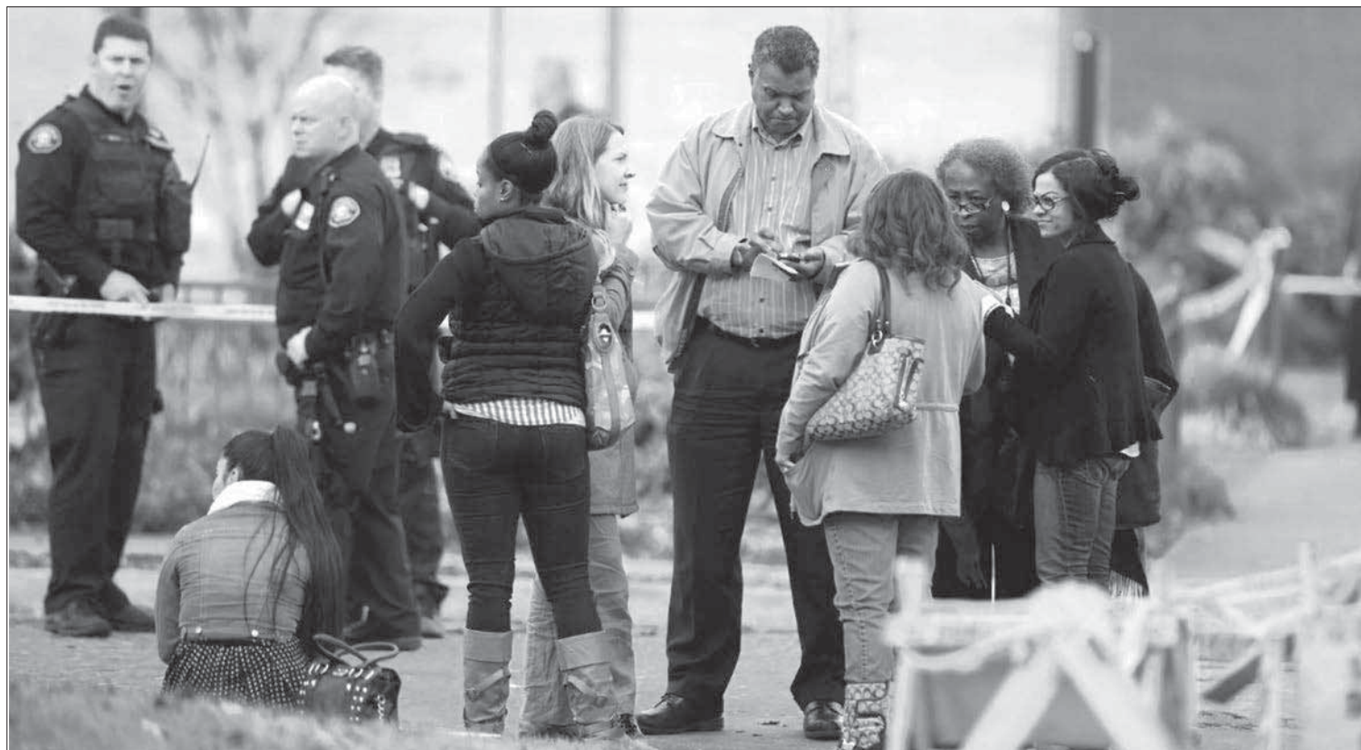
Una gran movilización policiaca se registró en Roseburg, Oregon, tras el tiroteo en la universidad de esa ciudad.

Un portavoz de la Policía Estatal de Oregon reveló que