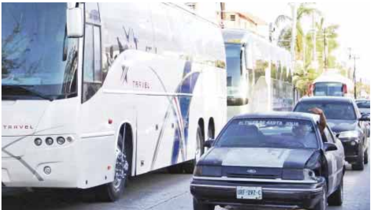
Camiones de turismo se estacionan con impunidad sobre la avenida Yaxchilán, sin que los agentes de Tránsito los quieran mover.

Mientras se atendía a los quejosos en la mencionada avenida, una patrulla de Tránsito pasó por la zona, y al ser cuestionado por los ciudadanos para que moviera a los camiones, los patrulleros dijeron que no pueden hacer nada, porque “son órdenes de arriba”.