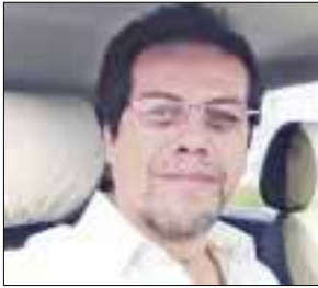
POR MAURICIO CONDE OLIVARES